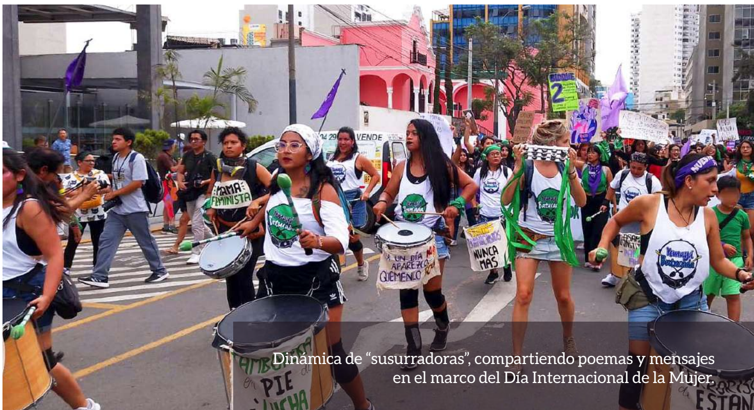
Dinámica de “susurradoras”, compartiendo poemas y mensajes en el marco del Día Internacional de la Mujer.