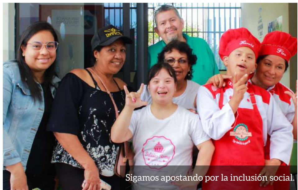
Sigamos apostando por la inclusión social.