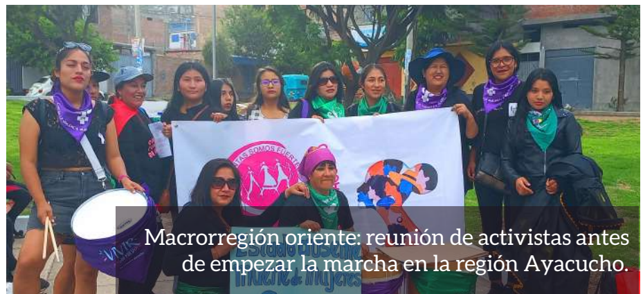
Macroregión oriente: reunión de activistas antes de empezar la marcha en la región Ayacucho.

Desde cada una de nuestras macroregiones se participó en cine foros sobre el Protocolo del Aborto Terapéutico , marchas por la defensa de los derechos de la mujer y su derecho a decidir, banderolazos, acciones artísticas (susurradoras de poemas, impro, pintura), elaboración de carteles y pancartas y otras actividades que en suma buscaban la libertad, una vida sin violencias y en igualdad de oportunidades.