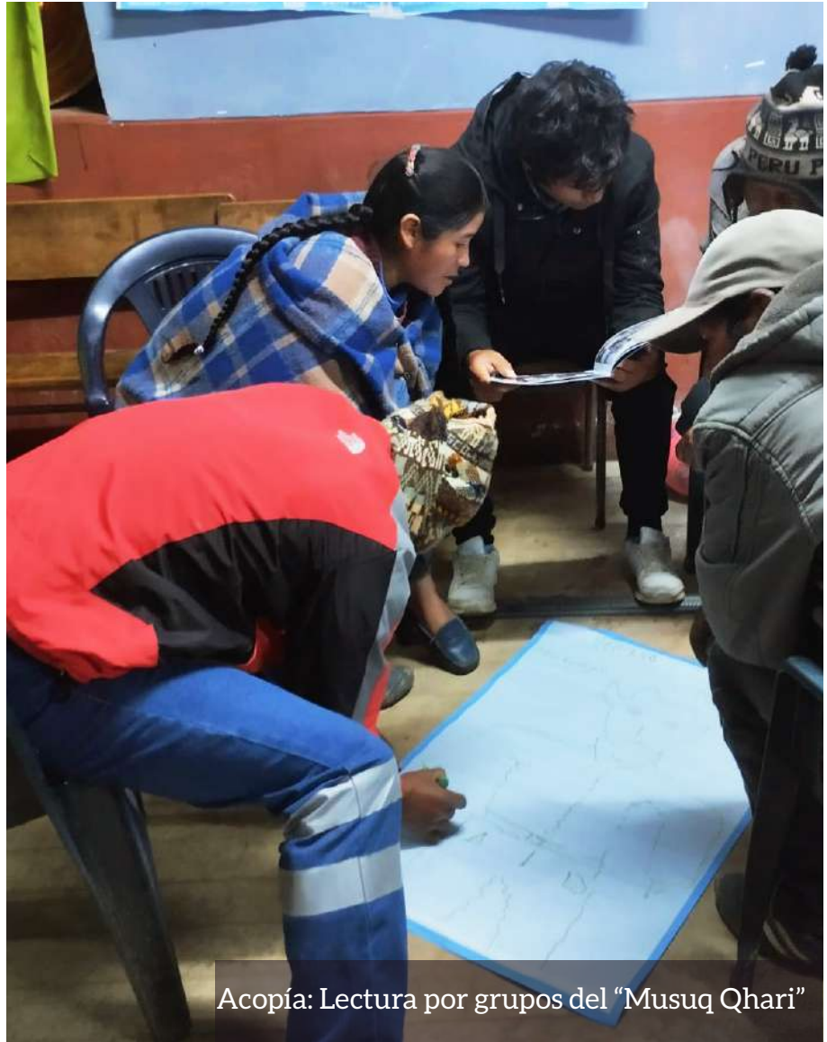
Acopía: Lectura por grupos del "Musuq Qhari"

Gracias a los hombres de Laguna Azul de la zona de cuatro lagunas en Acomayo que se atrevieron a decir que son los Musuq Qhari (hombres nuevos) por una vida sin violencias.