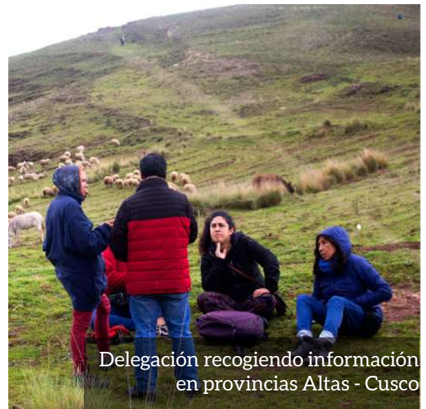
Delegación recogiendo información en provincias Altas - Cusco

En la página 16 podemos ver los mensajes escritos en los carteles que se alzaban en manos de las mujeres, quienes salieron a marchar en busca del respeto a sus derechos y pedido de libertad. De esta manera, aún se cuestionan, después de las torturas, persecución a campesinos y campesinas, a dirigentes populares, desapariciones, terruqueo, racismo, represión con armas de guerra, uso de drones, disparos desde helicópteros, patrullaje, manipulación de medios de comunicación, traumas, miedo, 68 muertes de civiles, policías y militares.