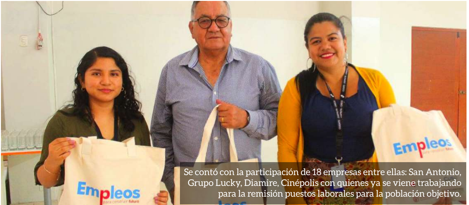
Se contó con la participación de 18 empresas entre ellas: San Antonio, Grupo Lucky, Diamire, Cinépolis con quienes ya se viene trabajando para la remisión puestos laborales para la población objetivo.