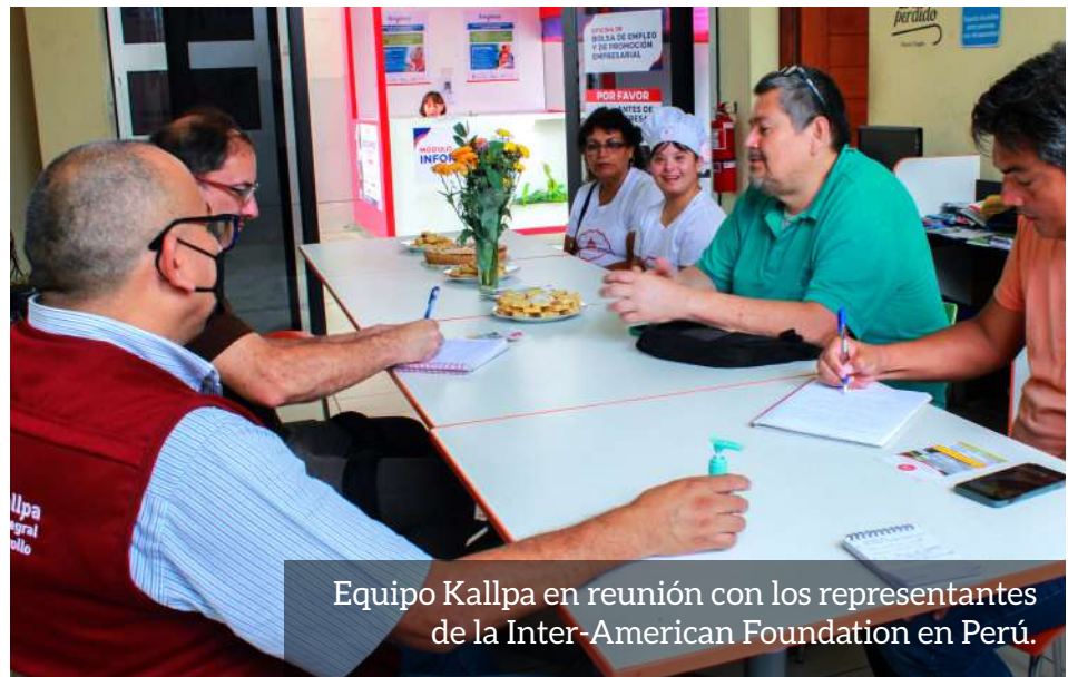
Equipo Kallpa en reunión con los representantes de la Inter-American Foundation en Perú.

“Un pequeño capital semilla fue la gasolina para empezar a arrancar mi negocio”.