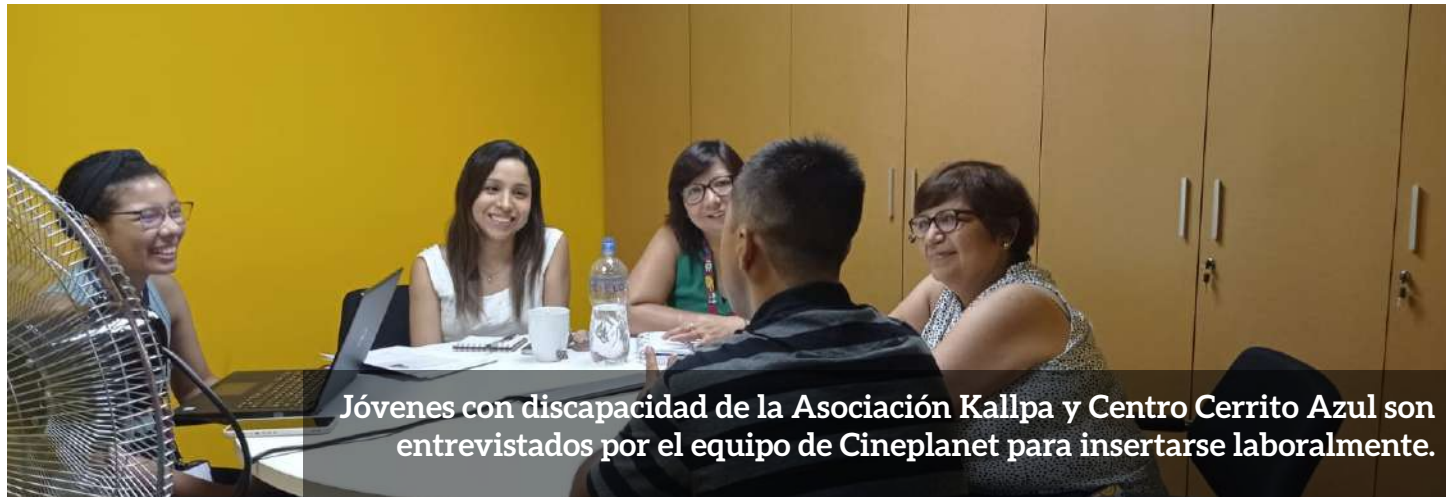
Jóvenes con discapacidad de la Asociación Kallpa y Centro Cerrito Azul son entrevistados por el equipo de Cineplanet para insertarse laboralmente.

“La inclusión no es una cuestión de corrección política. Es la clave para el crecimiento” -