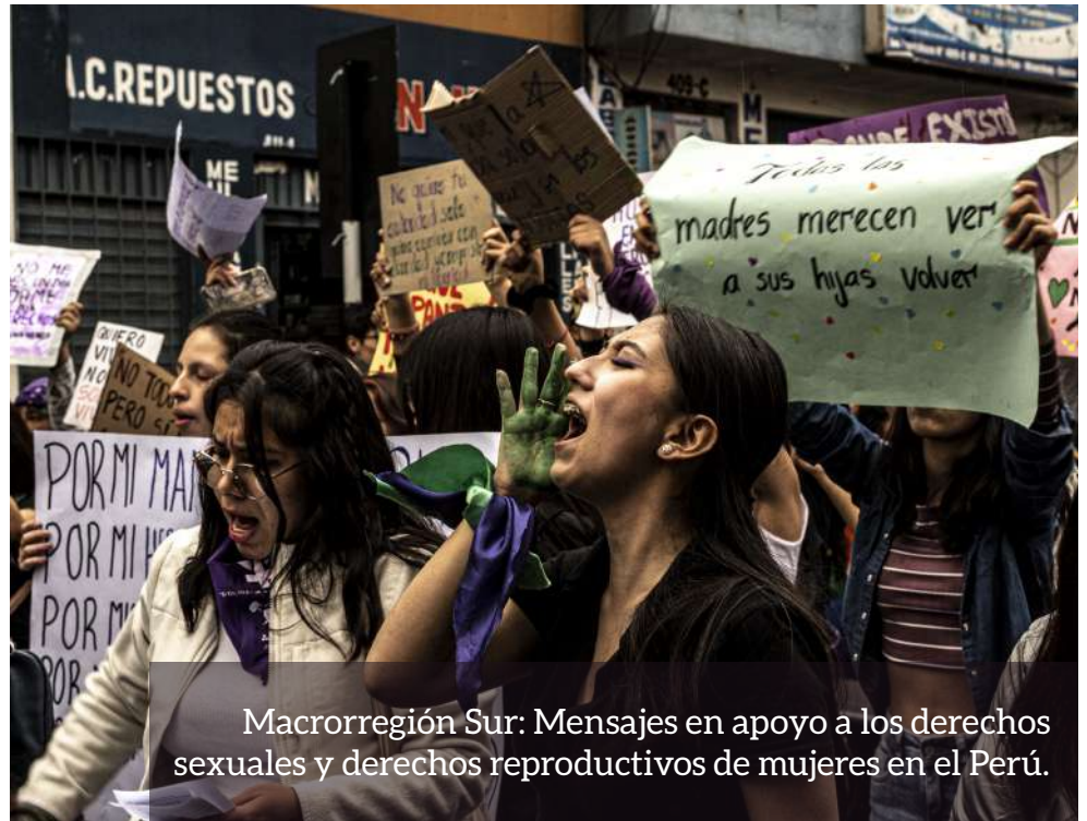
Macrorregión Sur: Mensajes en apoyo a los derechos sexuales y derechos reproductivos de mujeres en el Perú.

Esta fecha es clave para reforzar una lucha que busca integrar de manera correcta en la sociedad civil y en el ámbito político, el derecho a decidir de manera correcta en nuestro país.