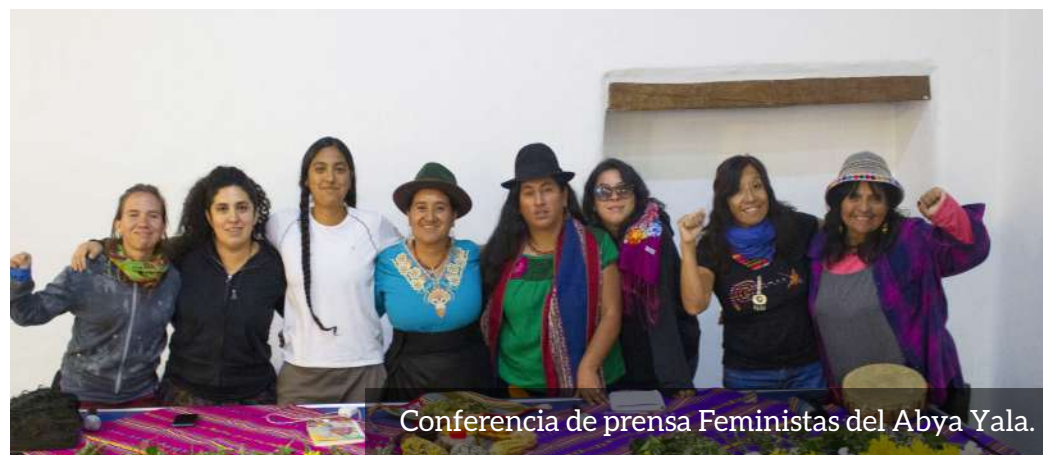
Conferencia de prensa Feministas del Abya Yala.