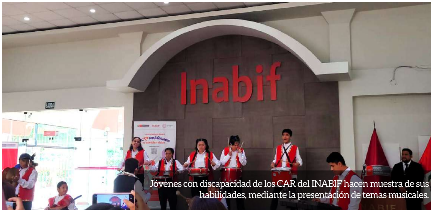
Jóvenes con discapacidad de los CAR del INABIF hacen muestra de sus habilidades, mediante la presentación de temas musicales.

Las visitas se realizaron en sus centros laborales, donde el equipo conversó sobre su experiencia, desde su inserción laboral hasta la puesta en práctica.