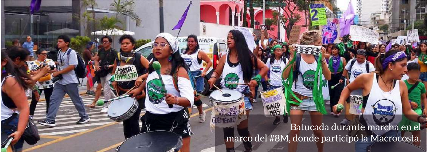
Batucada durante marcha en el marco del #8M, donde participó la Macrocosta.

La Marea Verde Perú es un grupo conformado por jóvenes diversas, activistas, independientes, organizadas en 20 regiones del Perú por la defensa del derecho a decidir que participan en campañas nacionales tanto virtuales como presenciales, empleando estrategias de comunicación e incidencia. Desde las cuatro macroregiones, sabemos que es importante sumar la voz de nuestras y nuestros jóvenes para generar el cambio y así poder hacer del derecho a la libre decisión una realidad.