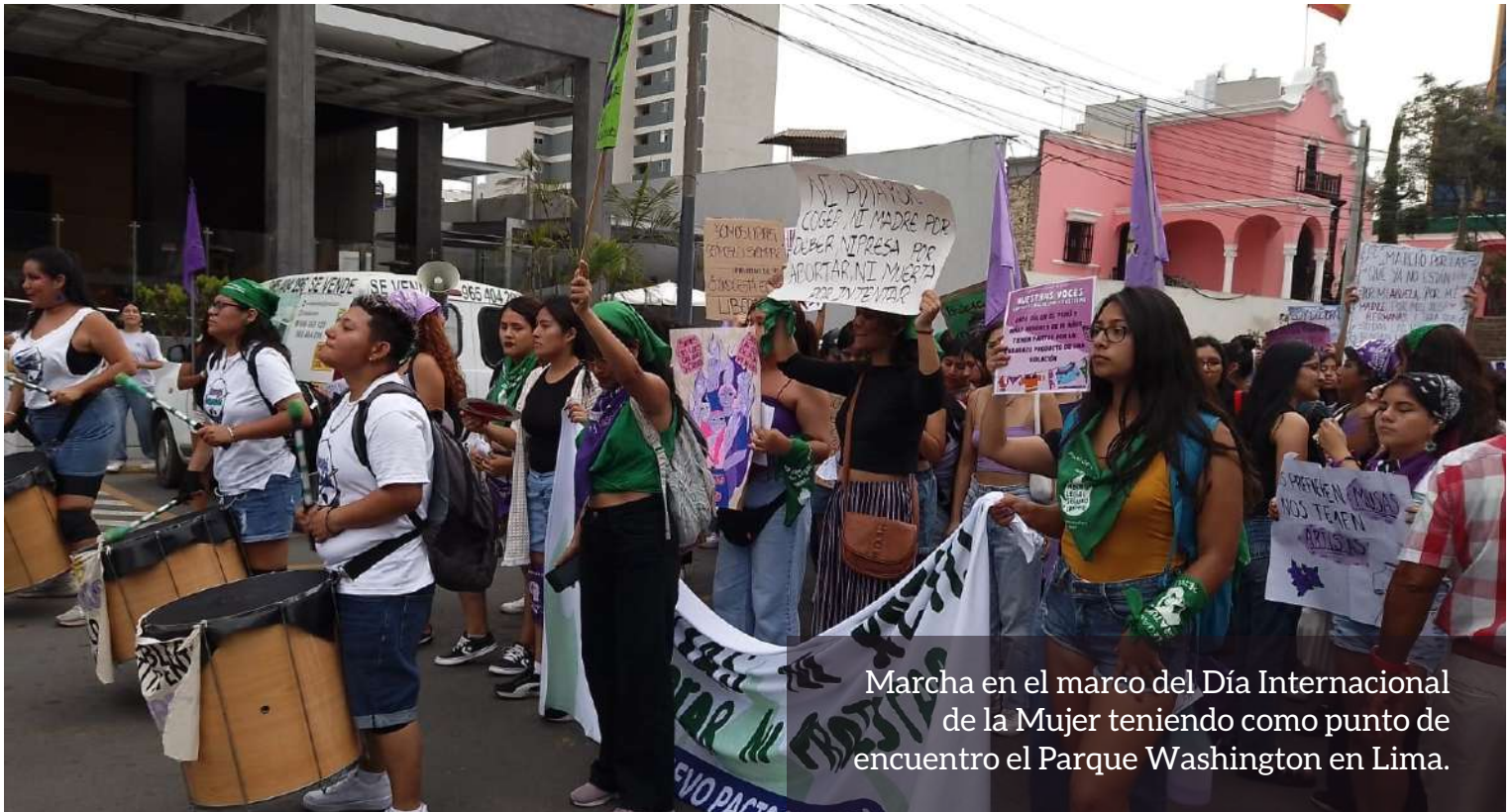
Marcha en el marco del Día Internacional de la Mujer teniendo como punto de encuentro el Parque Washington en Lima.