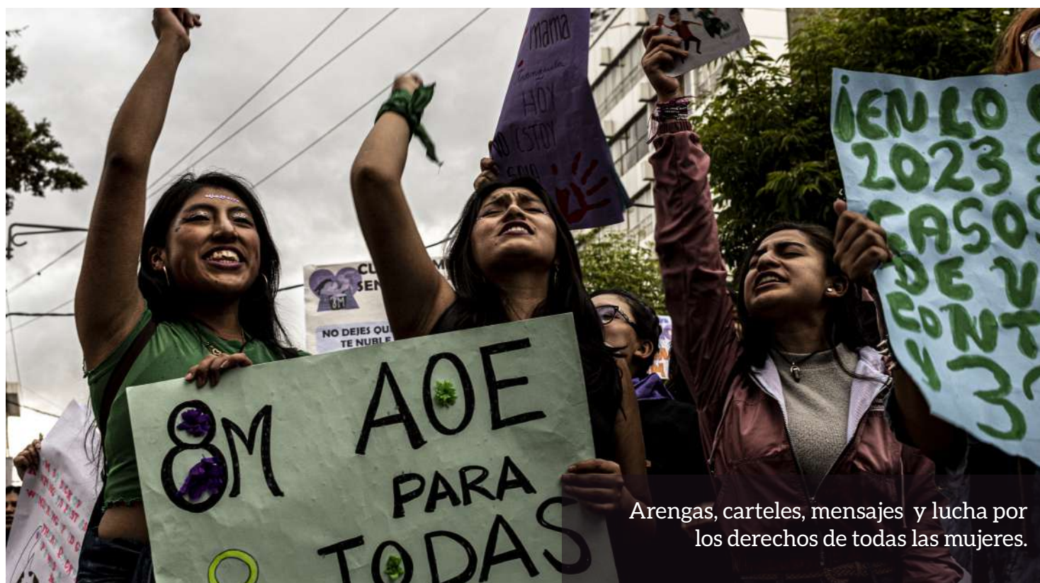
Arenas, carteles, mensajes y lucha por los derechos de todas las mujeres.