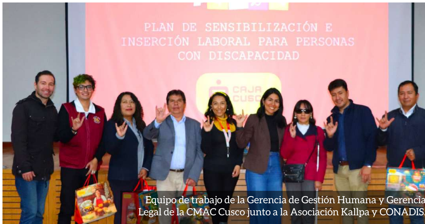
Equipo de trabajo de la Gerencia de Gestión Humana y Gerencia Legal de la CMAC Cusco junto a la Asociación Kallpa y CONADIS.