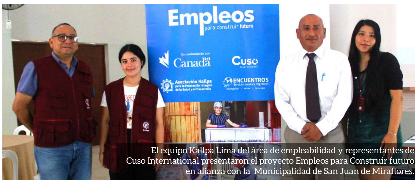
El equipo Kallpa Lima del área de empleabilidad y representantes de Cuso Internacional presentaron el proyecto Empleos para Construir futuro en alianza con la Municipalidad de San Juan de Miraflores.

Presentación del proyecto Empleos para Construir Futuros en la bolsa de trabajo de la Municipalidad San Juan de Miraflores”