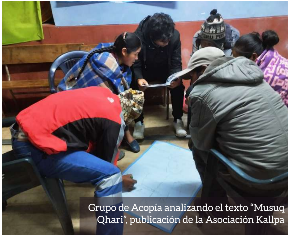
Grupo de Acopía analizando el texto “Musuq Qhari”, publicación de la Asociación Kallpa

diálogos: las espinas que también hieren a los hombres, reflexionando acerca de los autocuidados y privilegios masculinos, y asumiendo nuevos retos de las paternidades y masculinidades transformadoras. Participaron más de 90 hombres de los distritos de Pomacanchi, Acopía y Mosoqllaqta, resultando 30 hombres referente como nuevos