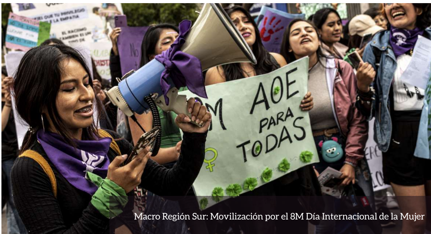
Macro Región Sur: Movilización por el 8M Día Internacional de la Mujer