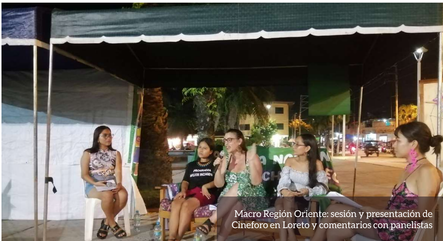
Macro Región Oriente: sesión y presentación de Cineforo en Loreto y comentarios con panelistas