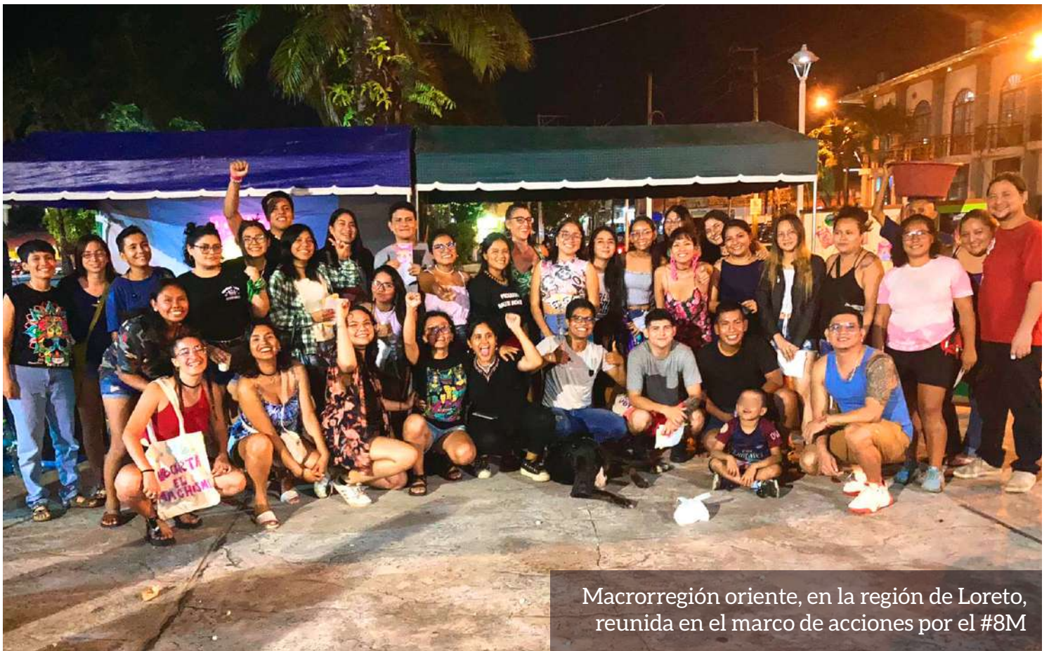
Macrorregión oriente, en la región de Loreto, reunida en el marco de acciones por el #8M