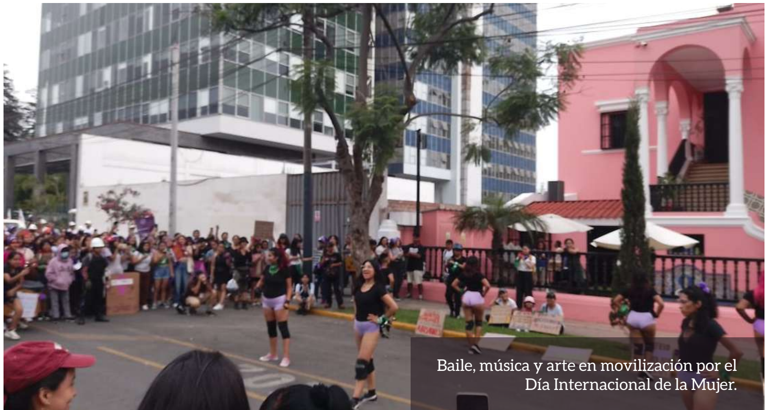
Baile, música y arte en movilización por el Día Internacional de la Mujer.