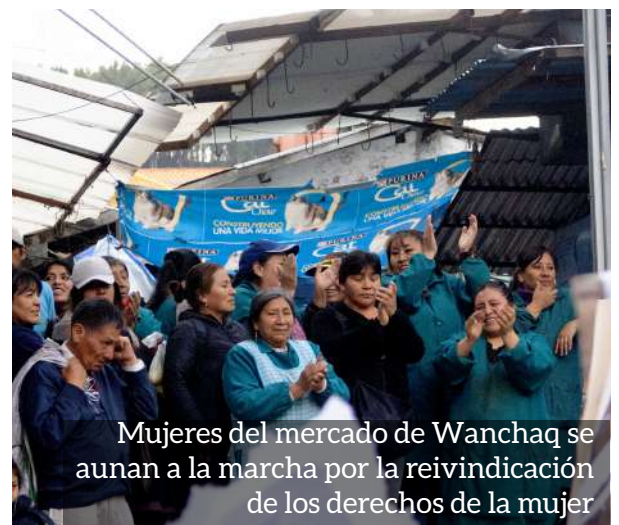
Mujeres del mercado de Wanchaq se aunan a la marcha por la reivindicación de los derechos de la mujer