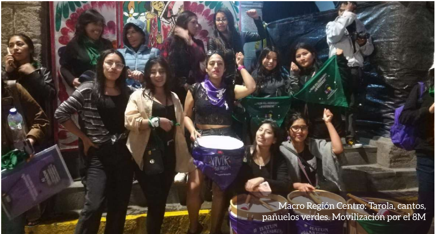
Macro Región Centro: Tarola, cantos, pañuelos verdes. Movilización por el 8M