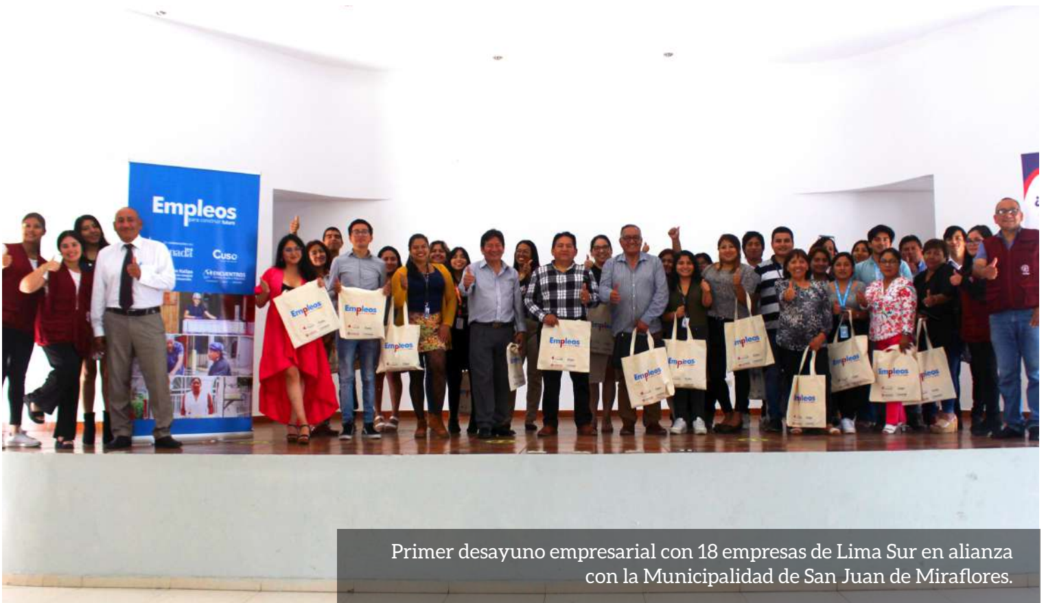
Primer desayuno empresarial con 18 empresas de Lima Sur en alianza con la Municipalidad de San Juan de Miraflores.