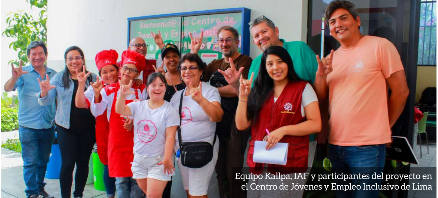
Equipo Kallpa, IAF y participantes del proyecto en el Centro de Jóvenes y Empleo Inclusivo de Lima

¡GRACIAS POR LA CONFIANZA PUESTA EN NOSOTROS!