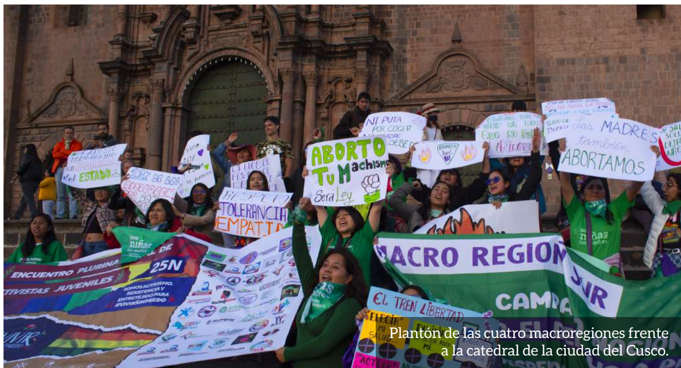
Plantón de las cuatro macroregiones frente a la catedral de la ciudad del Cusco.