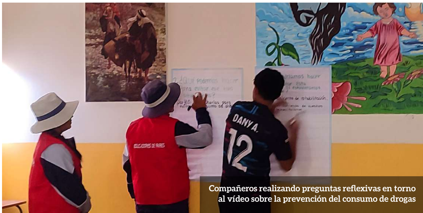
Compañeros realizando preguntas reflexivas en torno al vídeo sobre la prevención del consumo de drogas