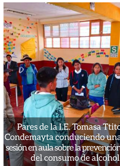
Pares de la I.E. Tomasa Ttito Condemayta conduciendo una sesión en aula sobre la prevención del consumo de alcohol.