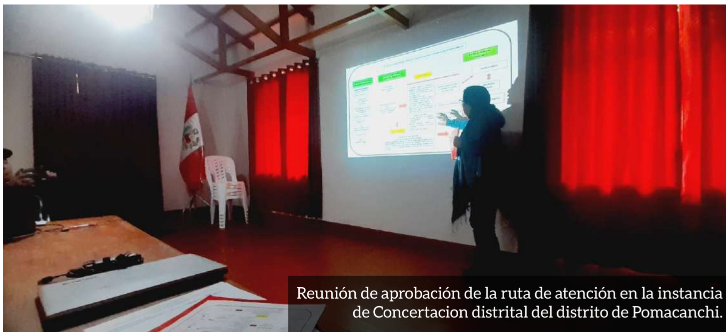
Reunión de aprobación de la ruta de atención en la instancia de Concertación distrital del distrito de Pomacanchi.

hacer seguimiento a la recuperación y rehabilitación de la víctima reconociendo también los documentos ya establecidos en cada municipalidad como las ordenanzas municipales que reconocen las Instancias de Concertación Distrital para finalmente pasar por el proceso de revisión, validación y aprobación en la instancia y finalmente en sesión de consejo mediante Ordenanza Distrital, validando para su difusión a nivel distrital, sus centros poblados y comunidades.