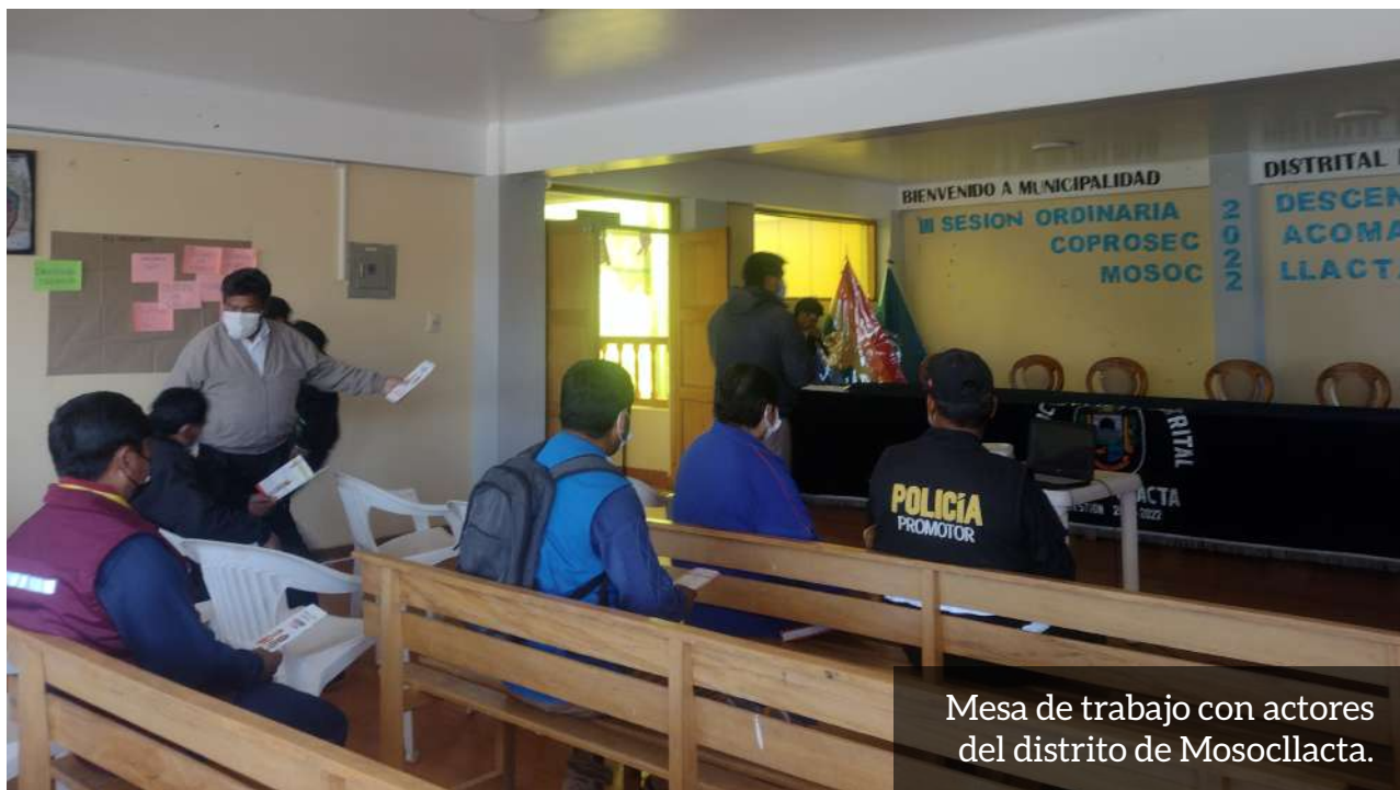
Mesa de trabajo con actores del distrito de Mosocllacta.