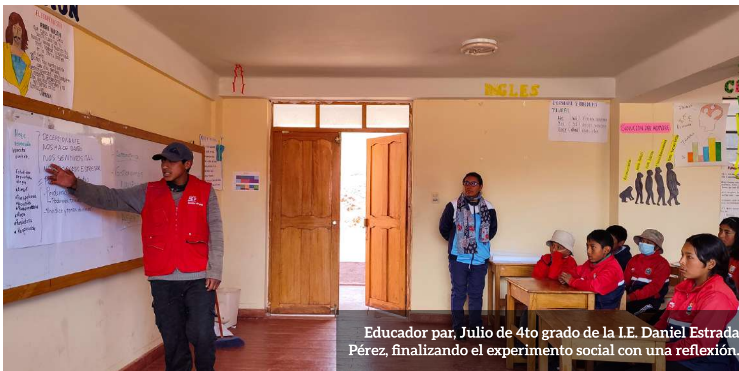
Educador par, Julio de 4to grado de la I.E. Daniel Estrada Pérez, finalizando el experimento social con una reflexión.