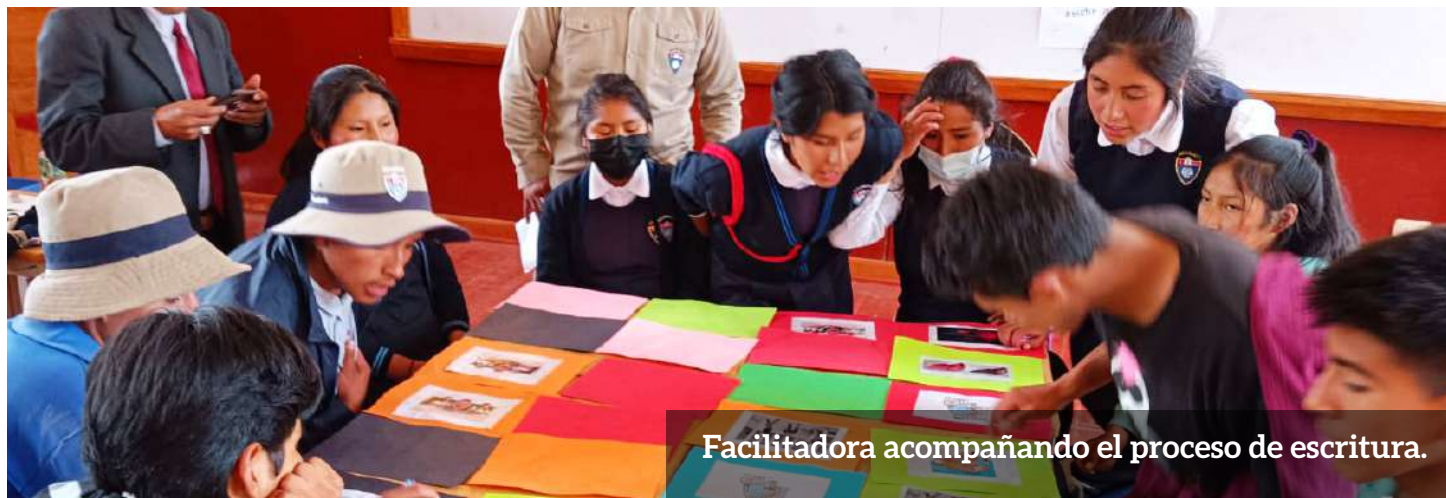
Facilitadora acompañando el proceso de escritura.

Educadores de la I.E. Tomasa Ttito Condemayta, de Acomayo, desarrollan el juego “Memorias”, con sus pares, como parte del asunto público Prevención del Consumo de Alcohol.