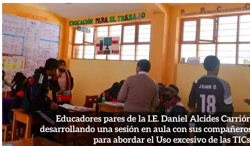
Educadores pares de la I.E. Daniel Alcides Carrión desarrollando una sesión en aula con sus compañeros para abordar el Uso excesivo de las TICs.

necesidad a abordar. Es decir, consideran que las agresiones verbales y los insultos les afectan a ellos y a sus compañeros. Para ello la especialista de la Asociación Kallpa , incidió en conceptos y practicas asociadas a las habilidades sociales como: el autoestima, la gestión de emociones y la comunicación asertiva. Y posteriormente realizaron un experimento social con toda la población estudiantil, para reflexionar sobre las relaciones interpersonales entre las y los estudiantes. El experimento fue dividido en 3 bloques. En el primer bloque invitaron a sus compañeros a identificar los insultos que oyen a diario, a escribirlos en la pizarra y a reflexionar sobre cómo les hace sentir oír esos insultos. La mayoría reconoció muchos adjetivos descalificativos, como “torpe, tonta, animal, pitufina, manco, mascota”, pero también expresiones interjectivas como “cállate o miércoles”. En el segundo bloque, les pidieron a sus compañeros