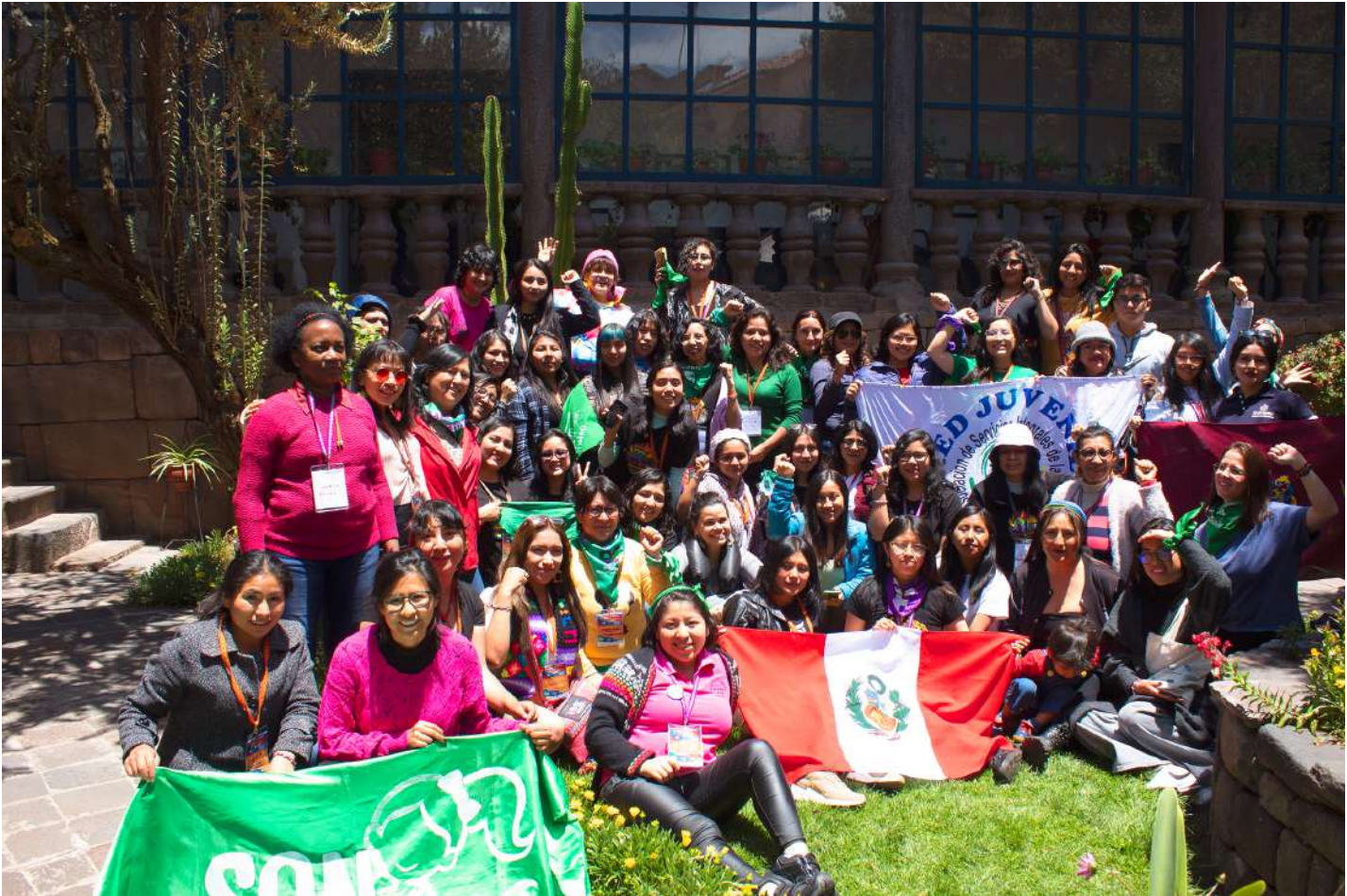
■ Foto final y grupal de integrantes de todas las macroregiones.