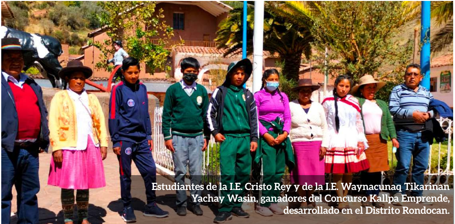
Estudiantes de la I.E. Cristo Rey y de la I.E. Waynacunaq Tikarinan Yachay Wasin, ganadores del Concurso Kallpa Emprede, desarrollado en el Distrito Rondocan.