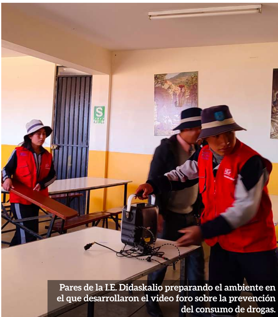
Pares de la I.E. Didaskalio preparando el ambiente en el que desarrollaron el video foro sobre la prevención del consumo de drogas.

Finalmente, se les invitó a reemplazar el uso de insultos, por halagos, o dirigirse solo por sus nombres.