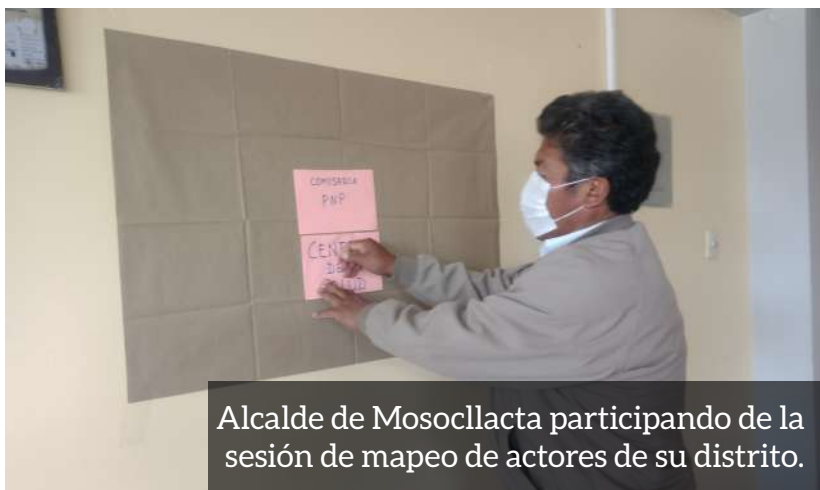
Alcalde de Mosocllacta participando de la sesión de mapeo de actores de su distrito.

contenidos relacionados a la Ley 30364 y su reglamento como también las funciones que realizan las instituciones públicas al momento de asistir, proteger, recibir denuncias y sancionar mediante un proceso judicial y