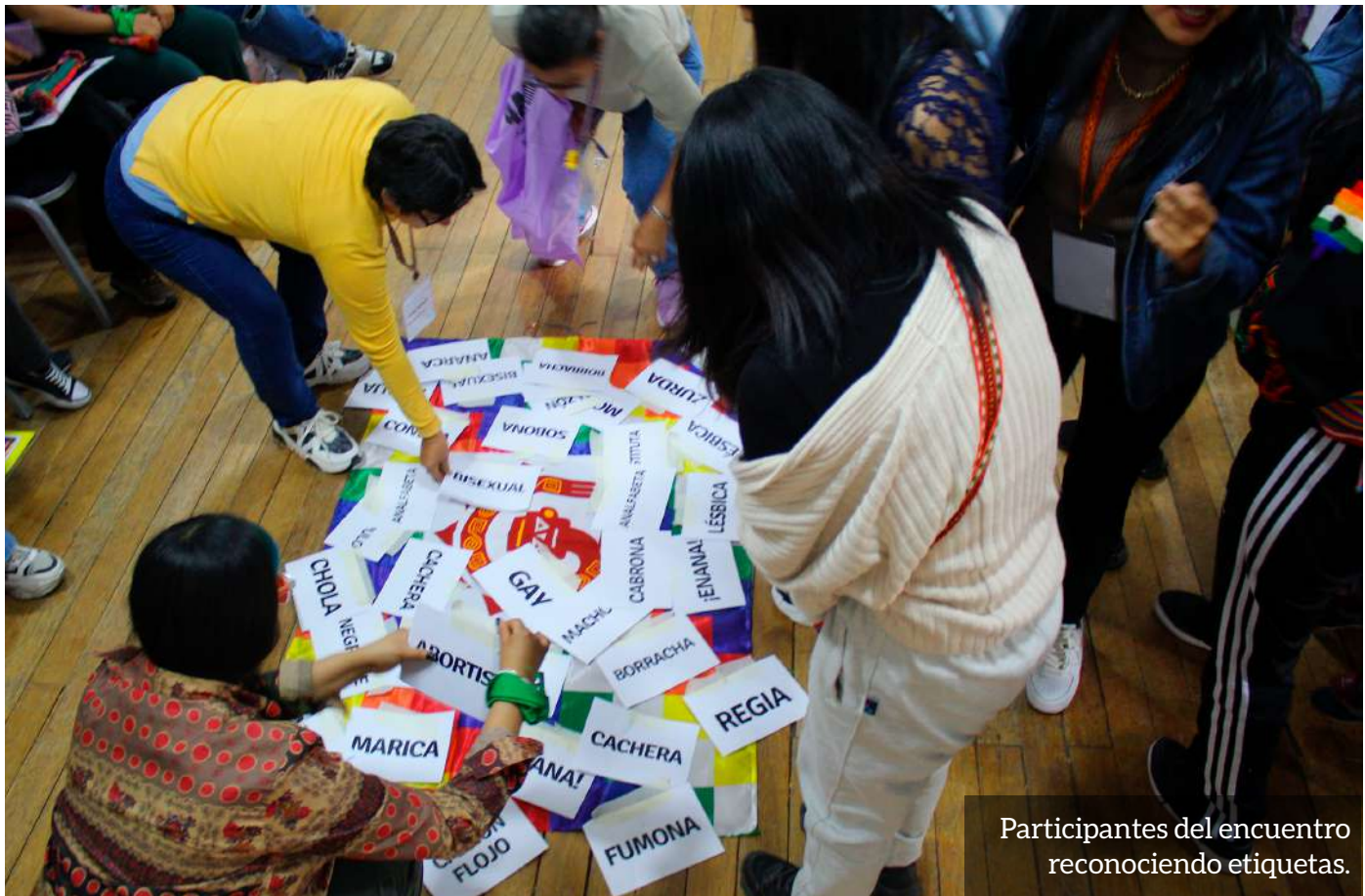
Participantes del encuentro reconociendo etiquetas.