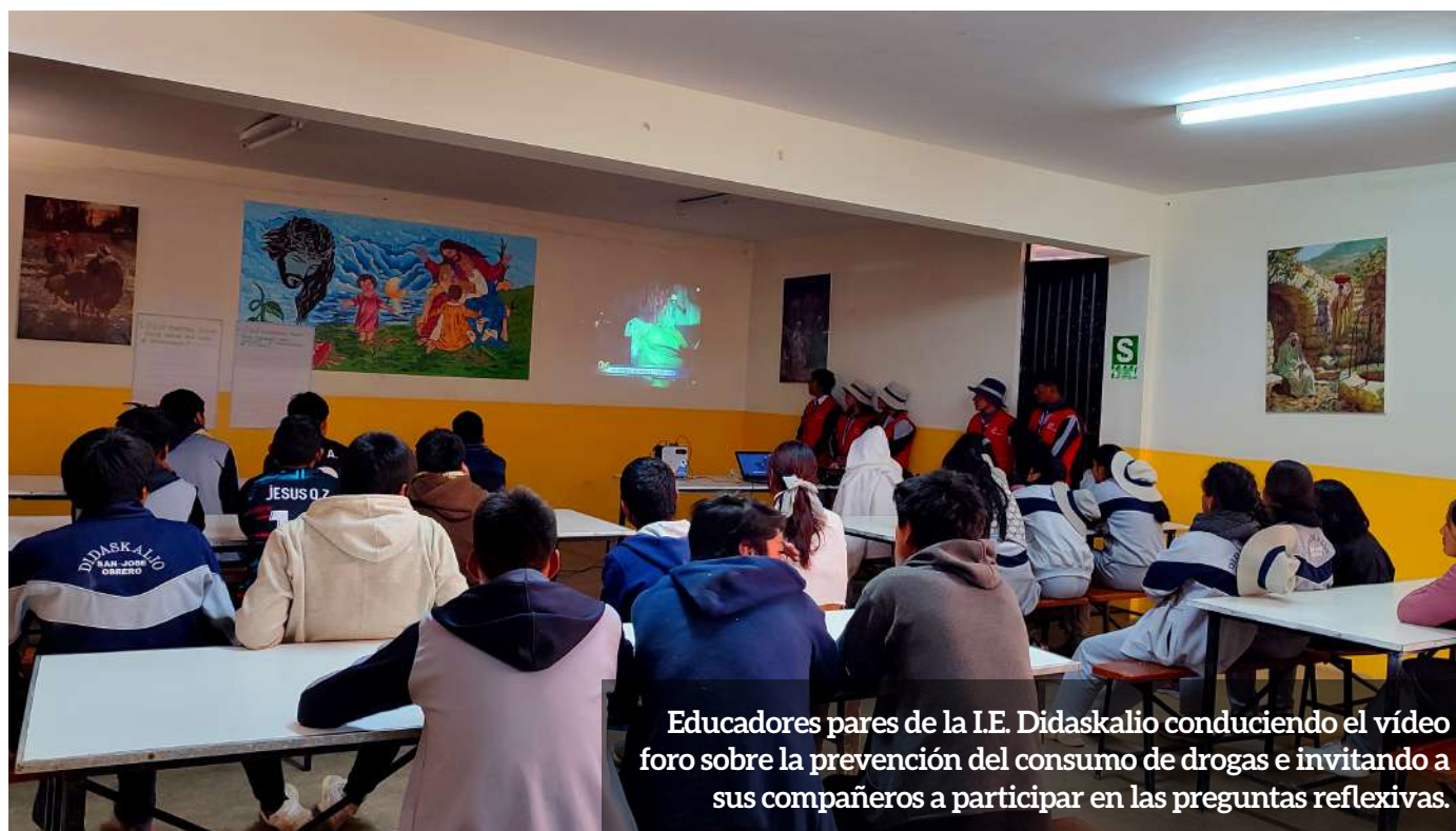
Educadores pares de la I.E. Didaskalio conduciendo el video foro sobre la prevención del consumo de drogas e invitando a sus compañeros a participar en las preguntas reflexivas.