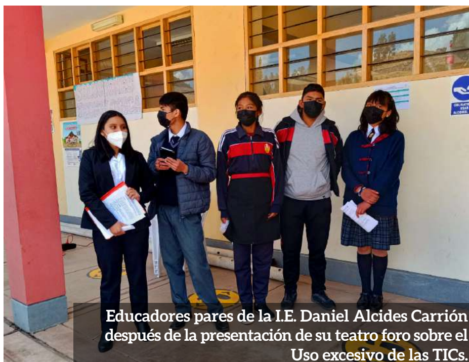
Educadores pares de la I.E. Daniel Alcides Carrión después de la presentación de su teatro foro sobre el Uso excesivo de las TICs.