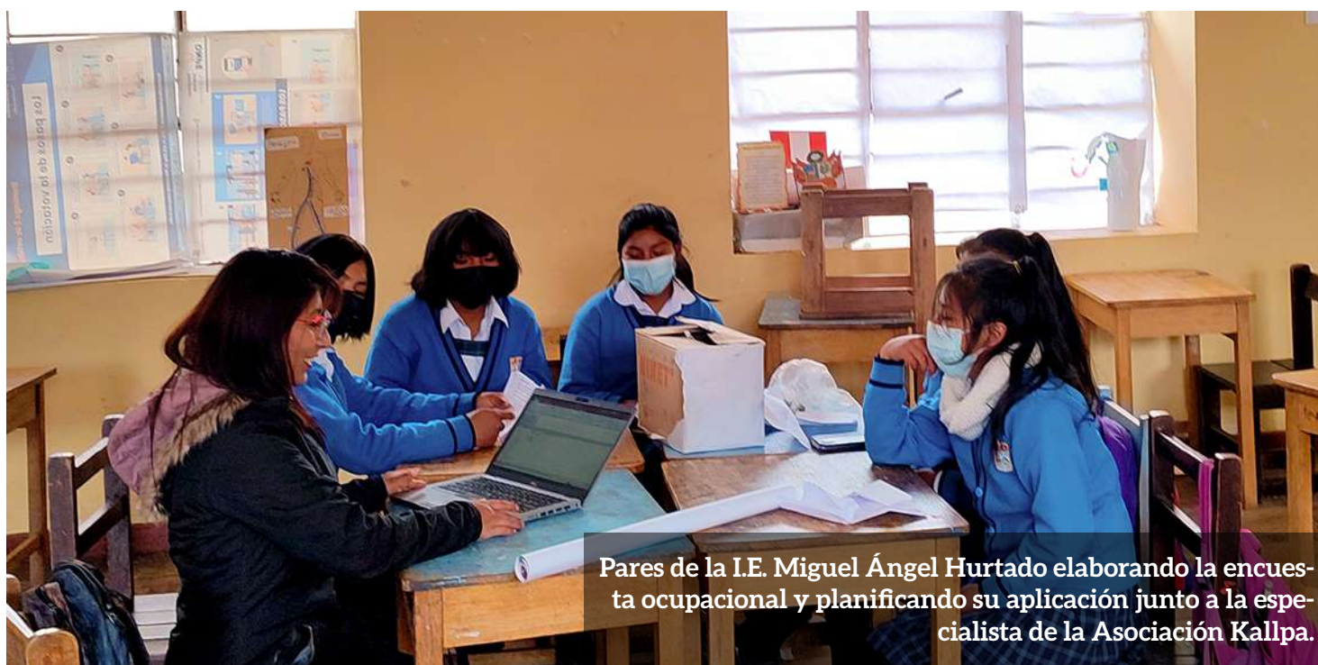
Pares de la I.E. Miguel Ángel Hurtado elaborando la encuesta ocupacional y planificando su aplicación junto a la especialista de la Asociación Kallpa.