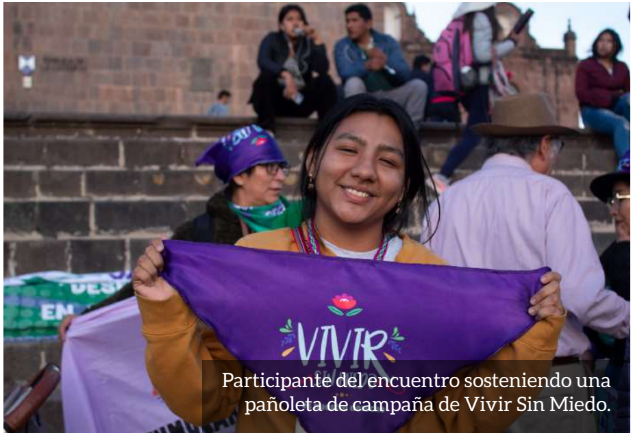
Participante del encuentro sosteniendo una pañoleta de campaña de Vivir Sin Miedo.

esta actividad no habría sido posible sin el apoyo de nuestras aliadas y aliados de DEMUS, Entrepueblos, Enraiza Derechos, AIETI, la Cooperación española y Planned Parenthood.