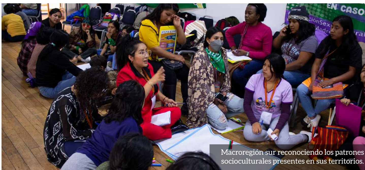
Macroregión sur reconociendo los patrones socioculturales presentes en sus territorios.

Por último, este encuentro permitió sentar las bases para generar una plataforma nacional de jóvenes por el derecho a decidir con la intención de poder sumar a más organizaciones a la misma con el fin de que más colectivas y organizaciones en sus territorios se sumen a sus iniciativas y todas juntas puedan hacerle frente a los conservadores que legitiman sistemas de opresión patriarcal y machista que día a día atenta contra su derecho a una vida digna y libre de violencias. Finalmente,