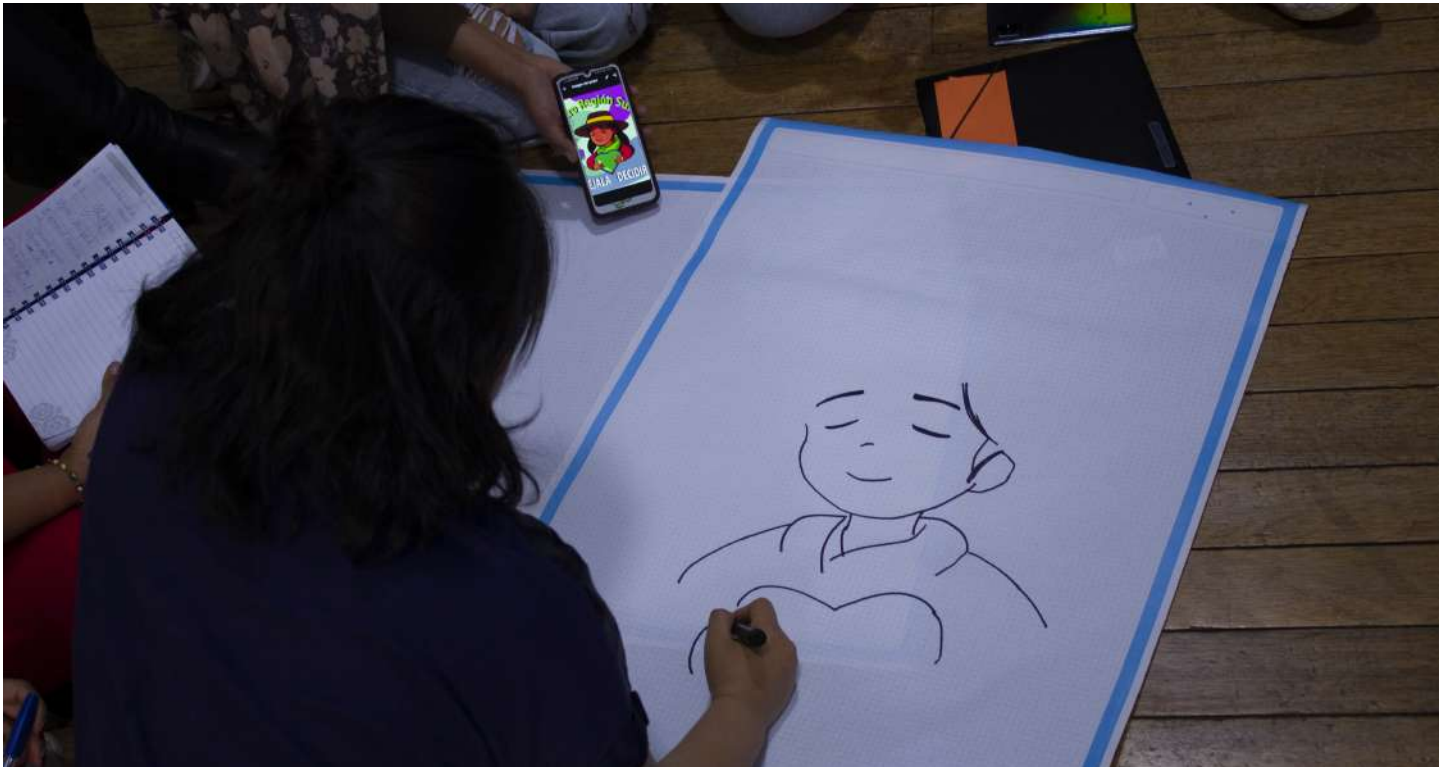
■ Ilustrando a la Kallpita por el derecho a decidir.