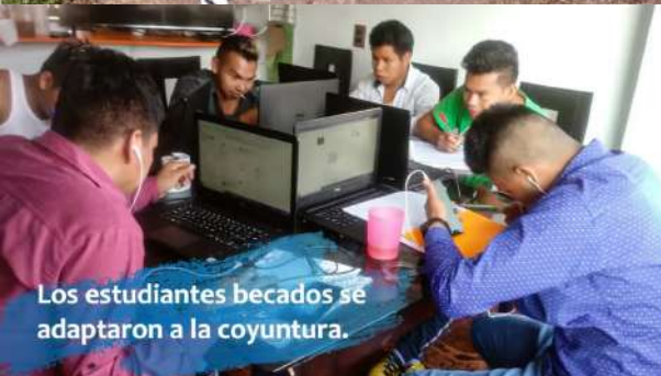
Los estudiantes becados se adaptaron a la coyuntura.