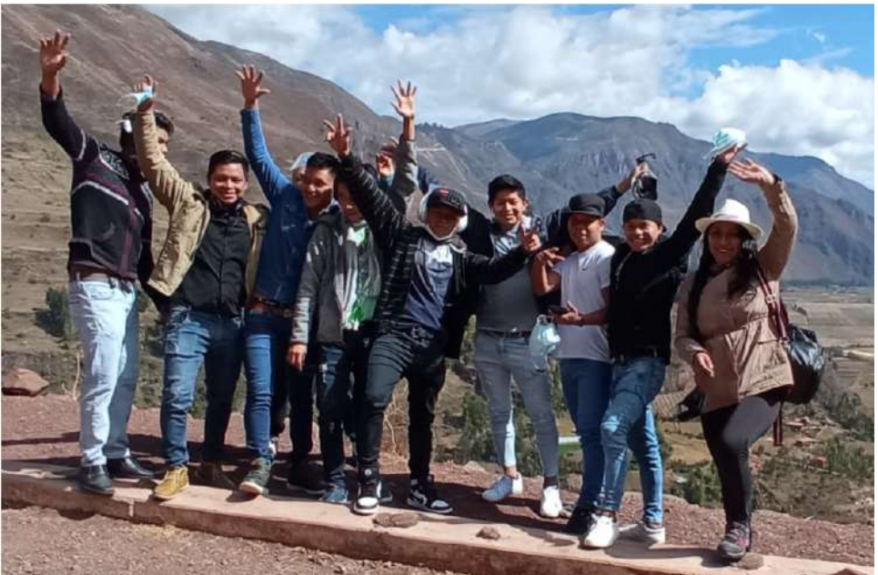
El equipo Kallpa Cusco nos resalta la importancia de las salidas de esparcimiento con los jóvenes becarios en la atención de su salud mental sobre todo en tiempos de aislamiento y distanciamiento social.