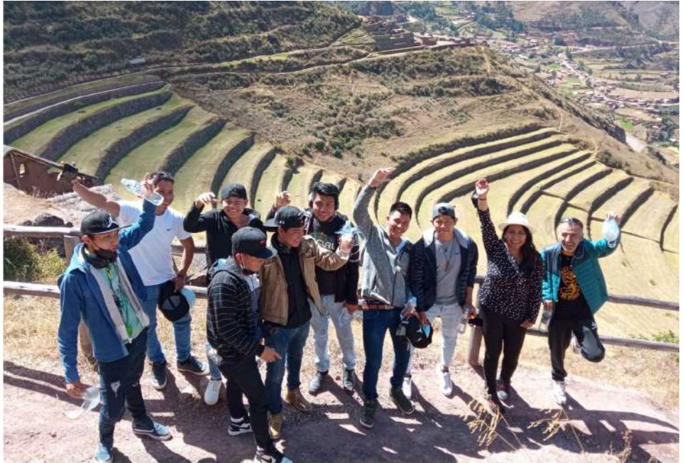
Paseo con los estudiantes becados a los restos arqueológicos de Pisac y Ollantaytambo . Fue un día muy bonito donde los estudiantes se relajaron caminando y visitando los lugares atractivos.