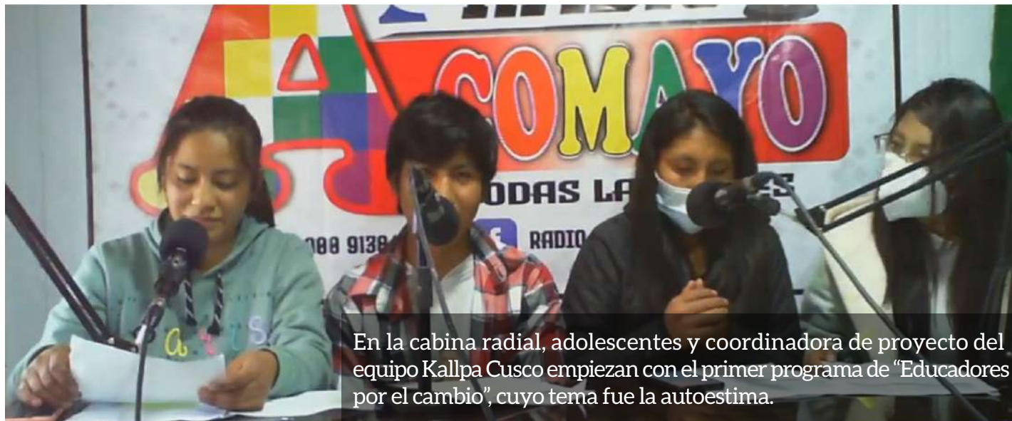
En la cabina radial, adolescentes y coordinadora de proyecto del equipo Kallpa Cusco empiezan con el primer programa de “Educadores por el cambio”, cuyo tema fue la autoestima.