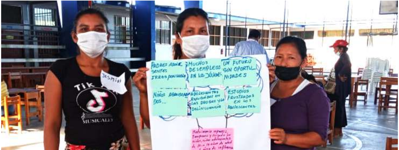
Mujeres lideresas del programa Vaso de Leche, quienes participaron en la consulta sobre la problemática sobre uniones forzadas y embarazo temprano en la región Loreto.

Iniciativa para reducir el riesgo de niñas y adolescentes a las uniones y embarazo tempranos en Belén