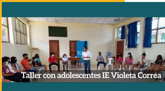
Taller con adolescentes IE Violeta Correa

“¡Niñas, niños y adolescentes de las comunidades de Belén han decidido tomar la palabra!”