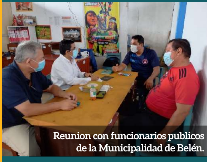
Reunion con funcionarios publicos de la Municipalidad de Belén.