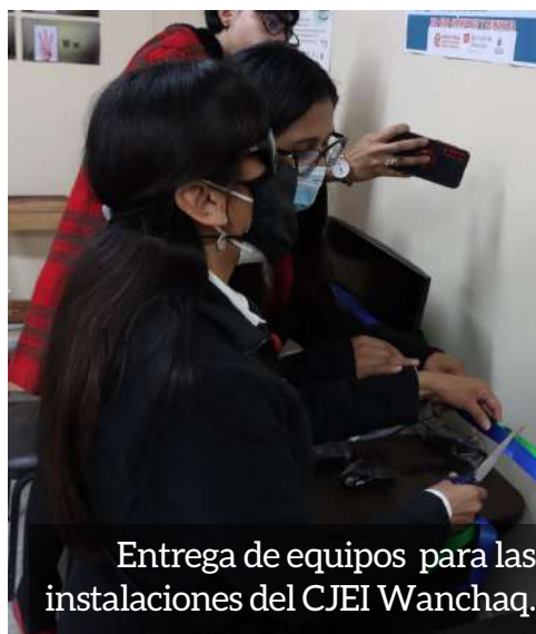
Entrega de equipos para las instalaciones del CJEI Wanchaq.

Los CJEI de Kallpa Lima y Cusco brindan servicios de orientación vocacional, asesoría para búsqueda de empleo y emprendimiento de negocios, con el objetivo de lograr la inserción formativa y laboral de jóvenes con discapacidad.