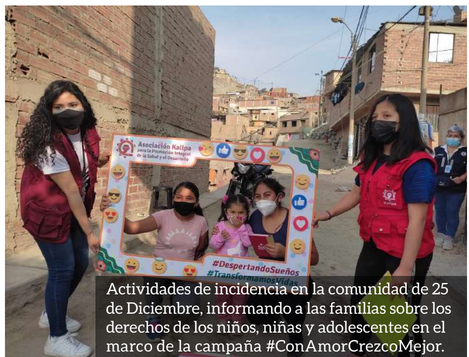
Actividades de incidencia en la comunidad de 25 de Diciembre, informando a las familias sobre los derechos de los niños, niñas y adolescentes en el marco de la campaña #ConAmorCrezcoMejor .

En cada una de las actividades se contó con la participación activa de la Red Interinstitucional por la No Violencia hacia la mujer, infancia y adolescencia, DEMUNA SJL, CEM - SJL (Centro Emergencia Mujer), COPEME, Aldeas infantiles, madres voluntarias del Comité de Vigilancia y la agrupación de promotores y promotoras voluntarias del proyecto de protección.