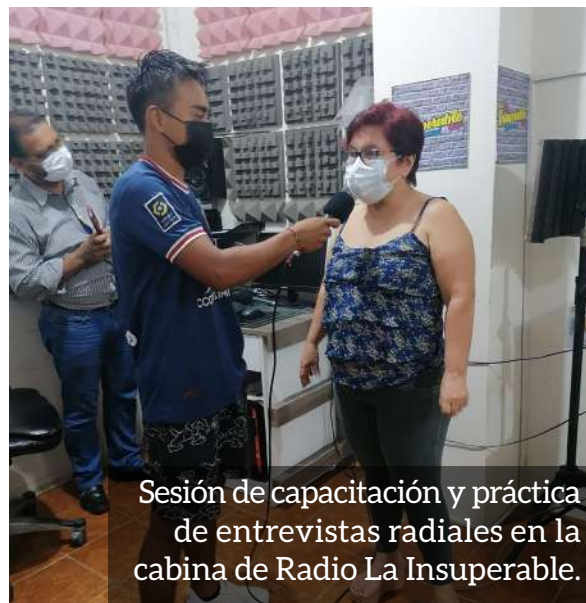
Sesión de capacitación y práctica de entrevistas radiales en la cabina de Radio La Insuperable.

incidencia en cada una de sus comunidades.