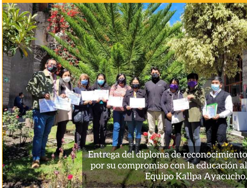
Entrega del diploma de reconocimiento por su compromiso con la educación al Equipo Kallpa Ayacucho.

El reconocimiento hace énfasis en el trabajo de Kallpa por su valioso compromiso en la formación de los estudiantes de las Instituciones Educativas, contribuyendo así a una mejora educativa en la región Ayacucho durante el 2021 .