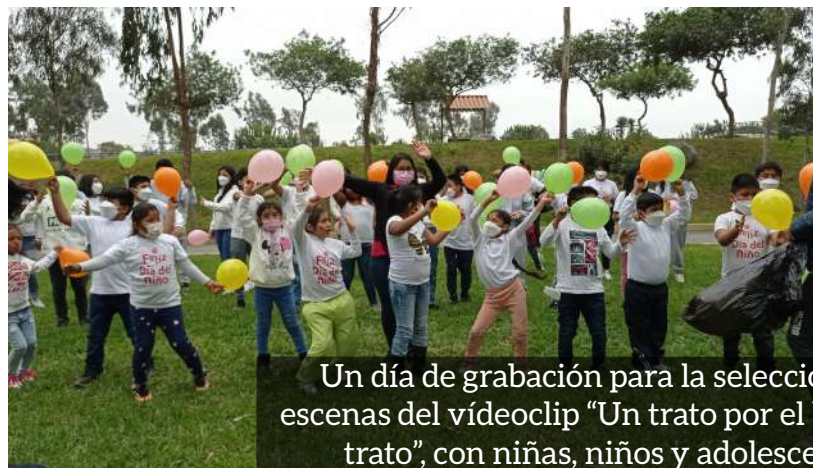
Un día de grabación para la selección de escenas del videoclip “Un trato por el buen trato”, con niñas, niños y adolescentes.

¡Click aquí para ver vídeos y el microprograma!