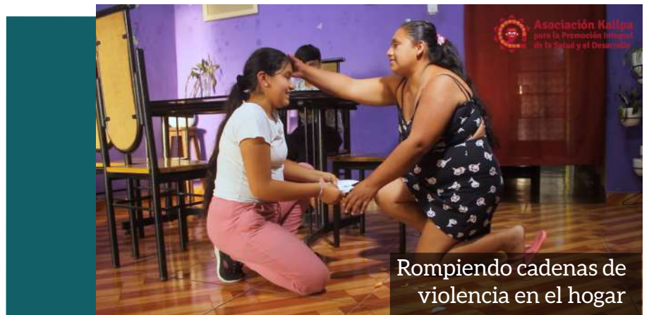
Rompiedo cadenas de violencia en el hogar