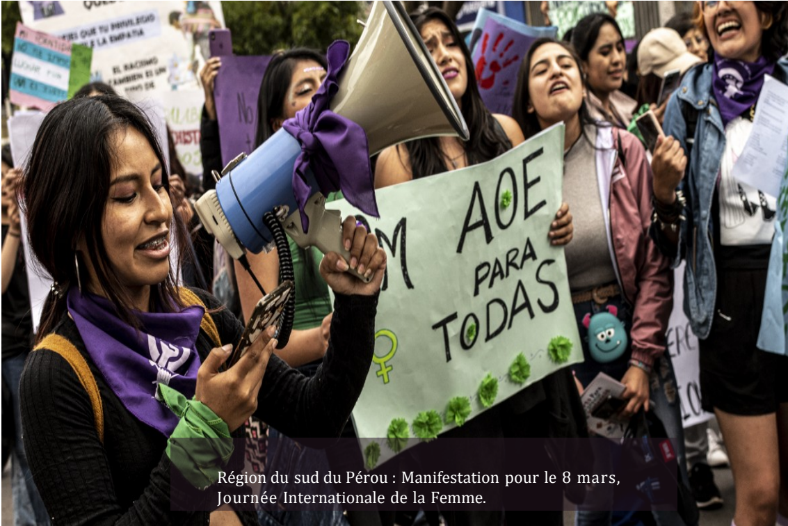
Région du sud du Pérou : Manifestation pour le 8 mars, Journée Internationale de la Femme.