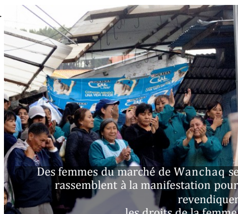
Des femmes du marché de Wanchaq se rassemblent à la manifestation pour revendiquer les droits de la femme.