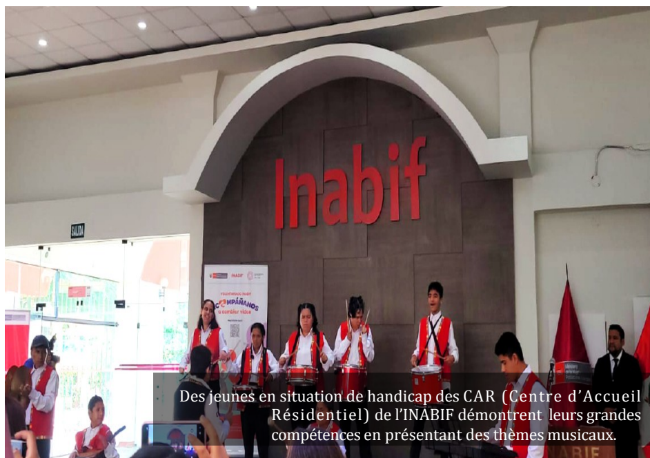
Des jeunes en situation de handicap des CAR (Centre d'Accueil Résidentiel) de l'INABIF démontrent leurs grandes compétences en présentant des thèmes musicaux.

Les visites ont eu lieu dans les centres de travail, où l'équipe a discuté de leurs expériences, de leur insertion professionnelle à leur mise en pratique.