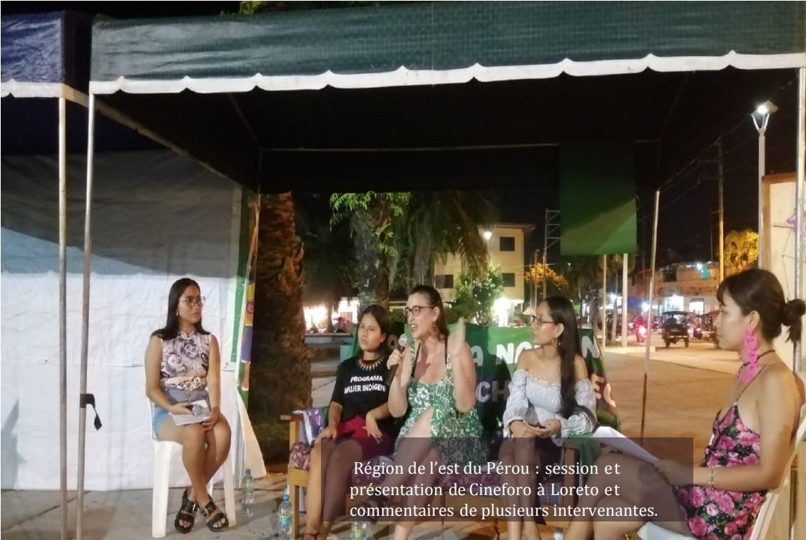
Région de l'est du Pérou : session et présentation de Cineforo à Loreto et commentaires de plusieurs intervenantes.