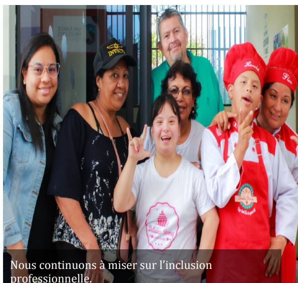
Nous continuons à miser sur l’inclusion professionnelle.