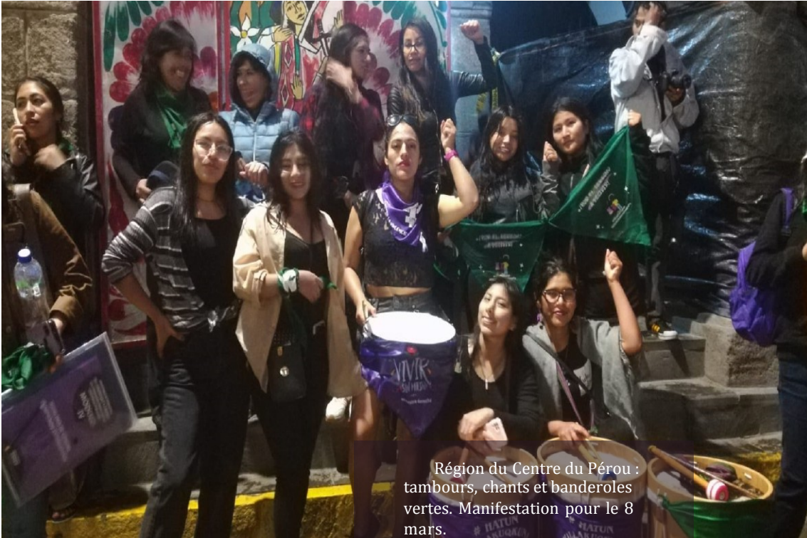
Région du Centre du Pérou : tambours, chants et banderoles vertes. Manifestation pour le 8 mars.