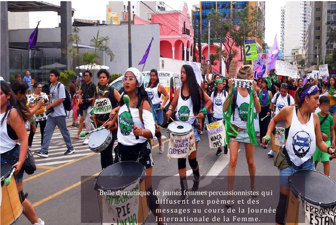
Belle dynamique de jeunes femmes percussionnistes qui diffusent des poèmes et des messages au cours de la Journée Internationale de la Femme.