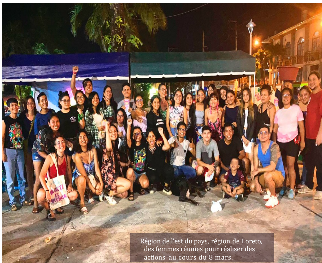
Région de l'est du pays, région de Loreto, des femmes réunies pour réaliser des actions au cours du 8 mars.