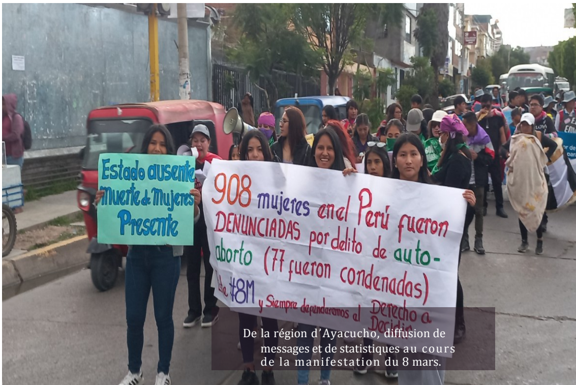
De la région d'Ayacucho, diffusion de messages et de statistiques au cours de la manifestation du 8 mars.