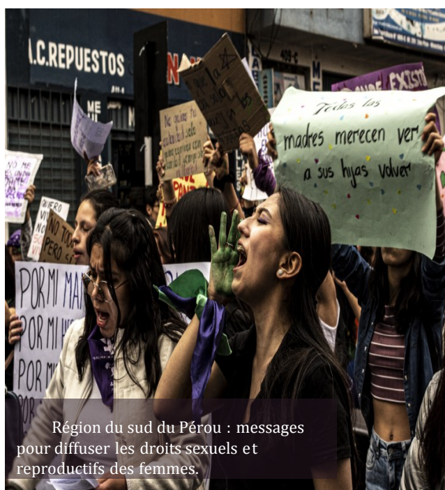
Région du sud du Pérou : messages pour diffuser les droits sexuels et reproductifs des femmes.

Le 8 mars est une date clé pour mettre en avant la lutte des femmes qui cherche à intégrer dans la société civile et dans le monde politique le DROIT de décider correctement dans notre pays.