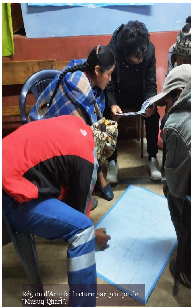
Région d'Acopía: lecture par groupe de "Musuq Qhari".

Merci aux hommes de Laguna Azul de la zone des quatre lacs d'Acomayo qui ont osé dire qu'ils sont des Musuq Qhari (des nouveaux hommes) pour une vie sans violence.