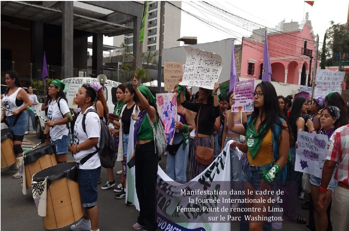
Manifestation dans le cadre de la Journée Internationale de la Femme. Point de rencontre à Lima sur le Parc Washington.