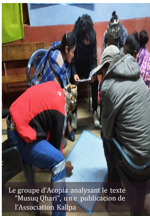
Le groupe d'Acopia analysant le texte "Musuq Qhari", une publication de l'Association Kallpa

Kallpa permet dès lors aux hommes de se reconnaître comme des êtres humains avec des bons et des mauvais côtés, d'être conscients de leurs défauts pour se réinventer et ainsi d'avoir une coexistence harmonieuse, basée sur le respect et le dialogue dans la famille. En travaillant avec le Grand "Saturnino", qui