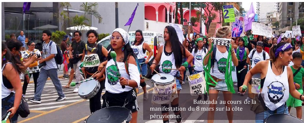
Batucada au cours de la manifestation du 8 mars sur la côte péruvienne.

La Marée Verte au Pérou est un groupe de jeunes militantes indépendantes présente dans 20 régions du Pérou pour défendre le droit de décider. Ces jeunes femmes organisent des campagnes virtuelles et présentielle en utilisant des stratégies de communication et de plaidoyer. Depuis les quatre régions du pays, nous savons qu'il est important d'associer la voix des jeunes pour susciter le changement et revendiquer le droit à la libre décision.