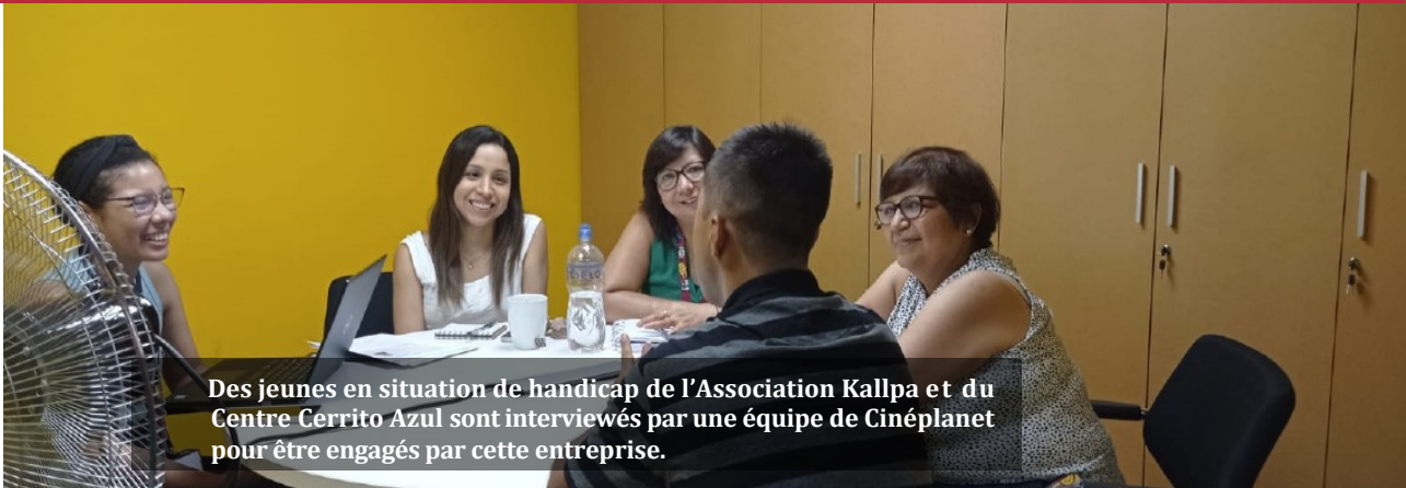
Des jeunes en situation de handicap de l'Association Kallpa et du Centre Cerrito Azul sont interviewés par une équipe de Cinéplanet pour être engagés par cette entreprise.

"L'inclusion n'est pas une question d'être politiquement correct. C'est la clé de la croissance" -