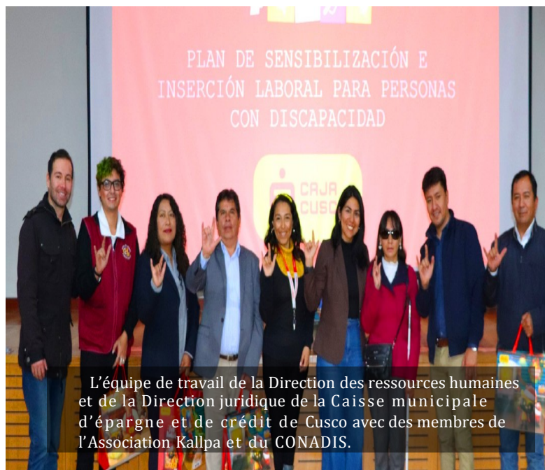
L'équipe de travail de la Direction des ressources humaines et de la Direction juridique de la Caisse municipale d'épargne et de crédit de Cusco avec des membres de l'Association Kallpa et du CONADIS.