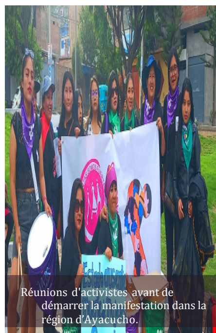
Réunions d'activistes avant de démarrer la manifestation dans la région d'Ayacucho.

la défense des droits de la femme et son droit à décider. Beaucoup de banderoles et d'affiches différentes ont été déployées au cours des marches pour mettre en avant la liberté des femmes, une vie sans violence et l'égalité des chances.