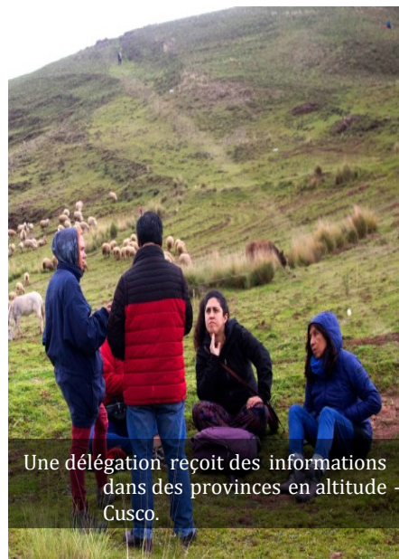
Une délégation reçoit des informations dans des provinces en altitude – Cusco.

À la page 16, nous pouvons voir certains messages écrits sur des affiches tenues par des femmes qui ont manifesté pour le respect de leurs droits et de leur liberté. Malgré tout, beaucoup de questionnements sont exprimés sur des tortures, des persécutions à l’encontre de paysans et de paysannes, de dirigeants populaires, des disparitions, du racisme et la répression par des armes de guerre, l’utilisation de drones, la manipulation des mass-médias et la mort de 68 personnes.