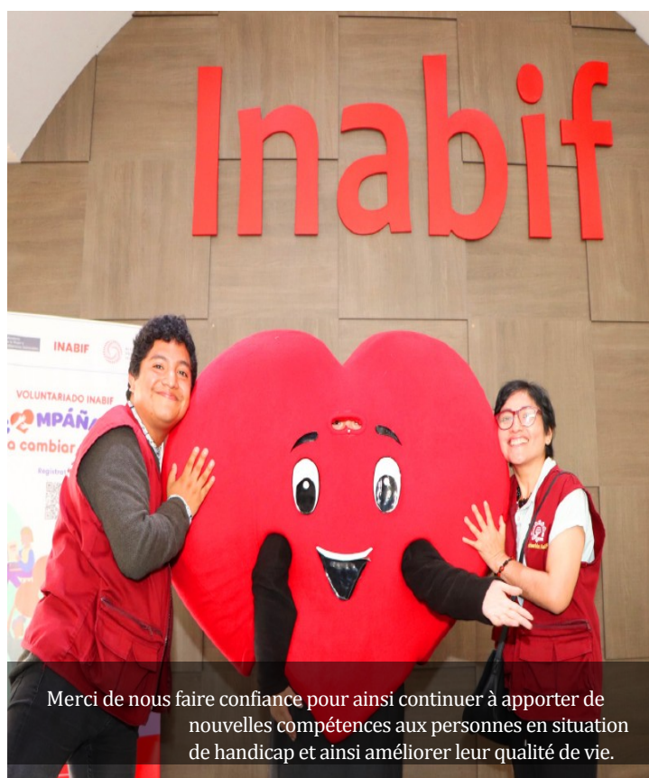
Merci de nous faire confiance pour ainsi continuer à apporter de nouvelles compétences aux personnes en situation de handicap et ainsi améliorer leur qualité de vie.