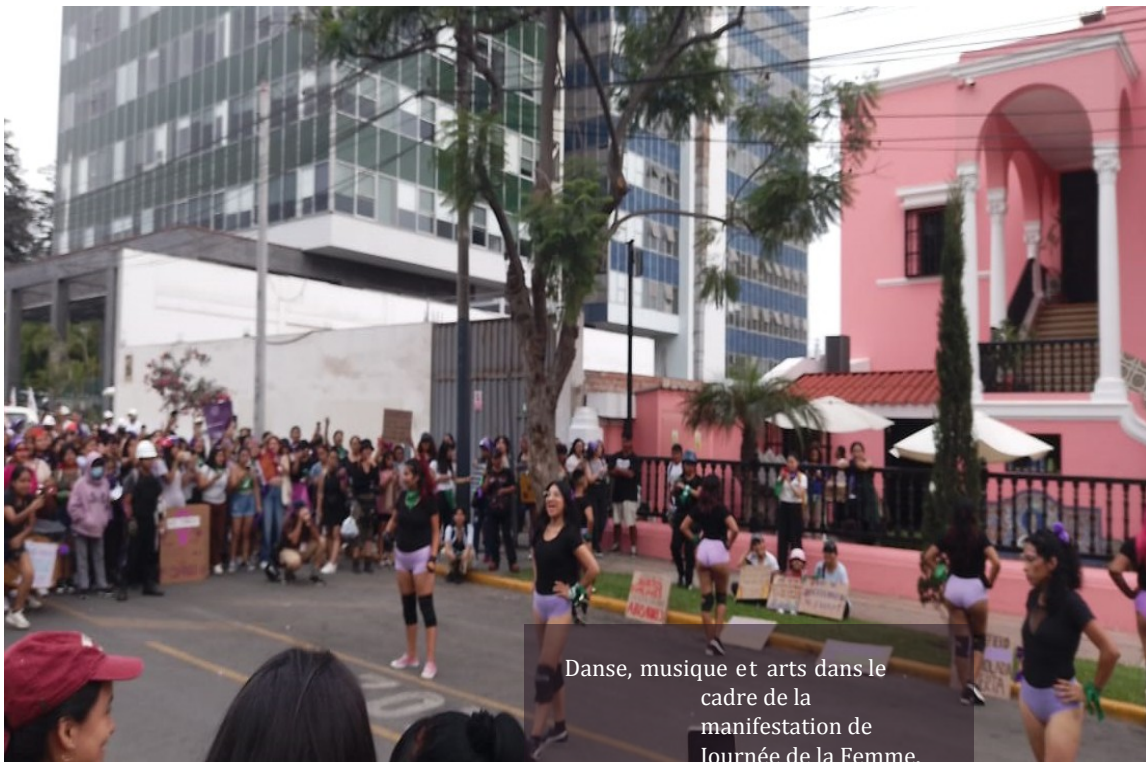
Danse, musique et arts dans le cadre de la manifestation de Journée de la Femme.