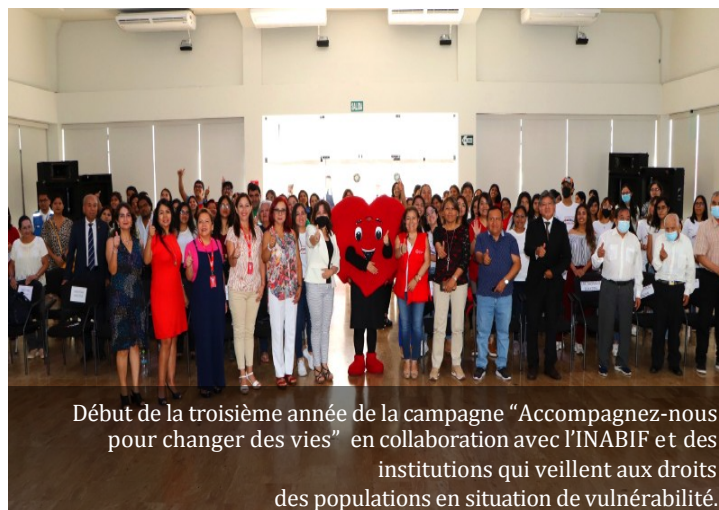
Début de la troisième année de la campagne "Accompagnez-nous pour changer des vies" en collaboration avec l'INABIF et des institutions qui veillent aux droits des populations en situation de vulnérabilité.

Nous continuons à unir nos efforts pour les personnes en situation de handicap. En travaillant ensemble, nous rendons réalistes des rêves et nous transformons des vies.