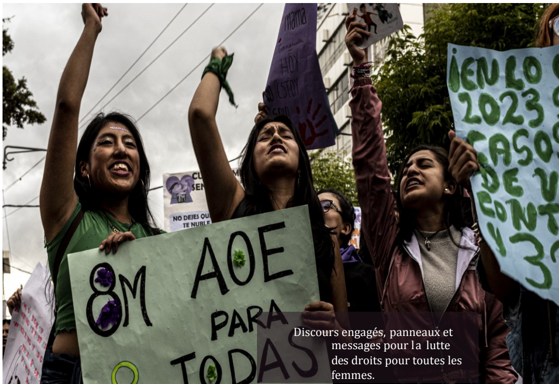
Discours engagés, panneaux et messages pour la lutte des droits pour toutes les femmes.