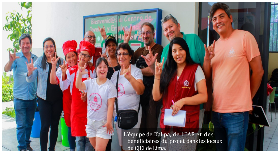
L'équipe de Kallpa, de l'IAF et des bénéficiaires du projet dans les locaux du CJEI de Lima.