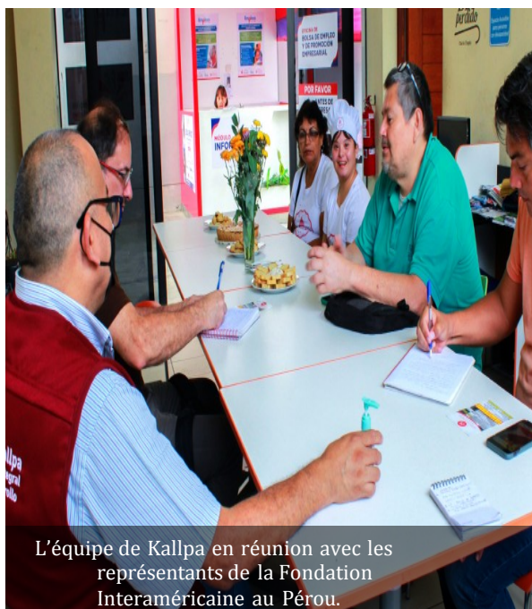
L’équipe de Kallpa en réunion avec les représentants de la Fondation Interaméricaine au Pérou.

“Le capital de départ a été le petit “plus” pour démarrer mon entreprise.”