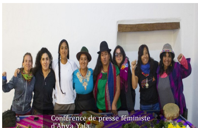
Conférence de presse féministe d’Abya Yala.