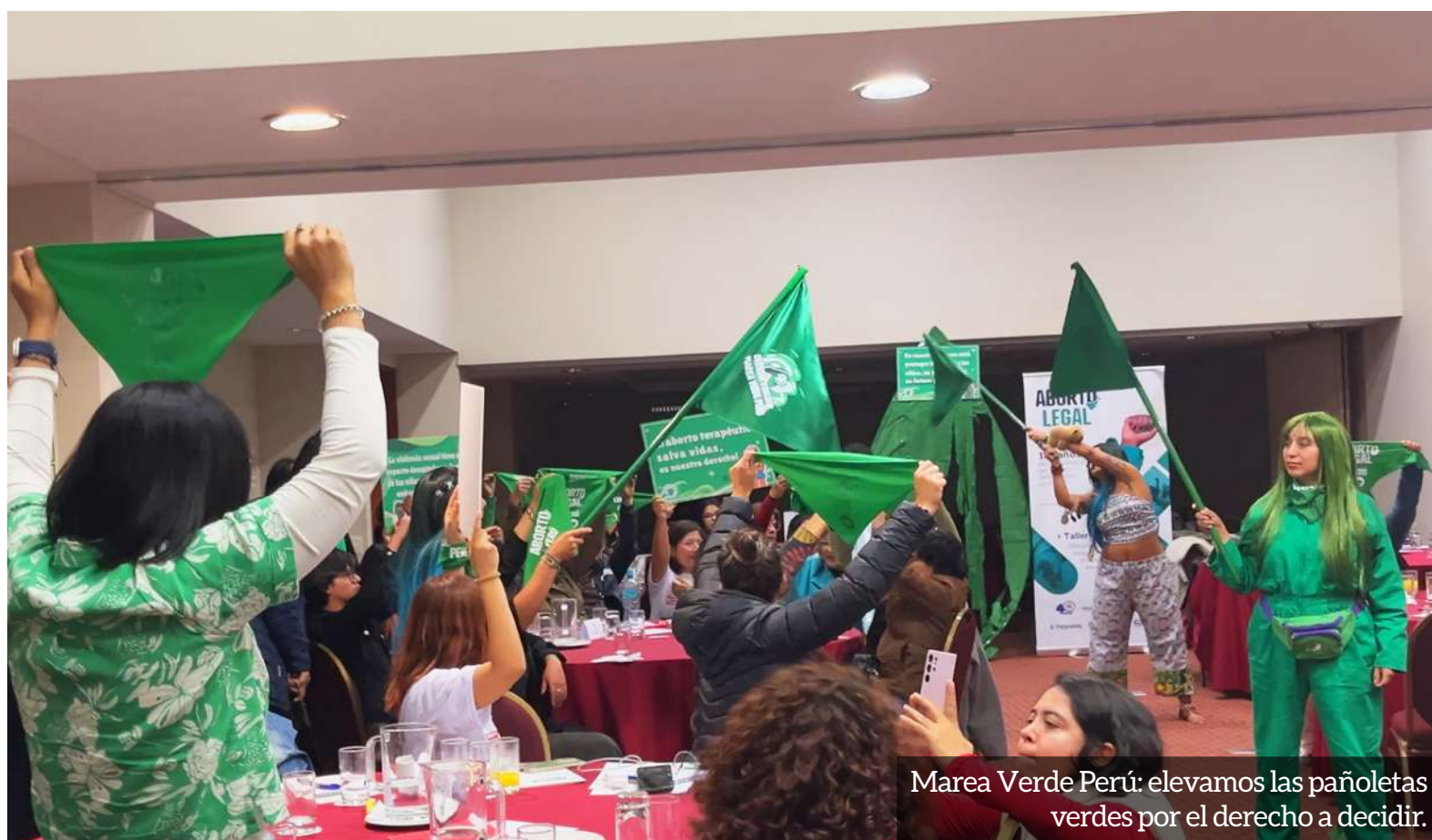
Marea Verde Perú: elevamos las pañoletas verdes por el derecho a decidir.