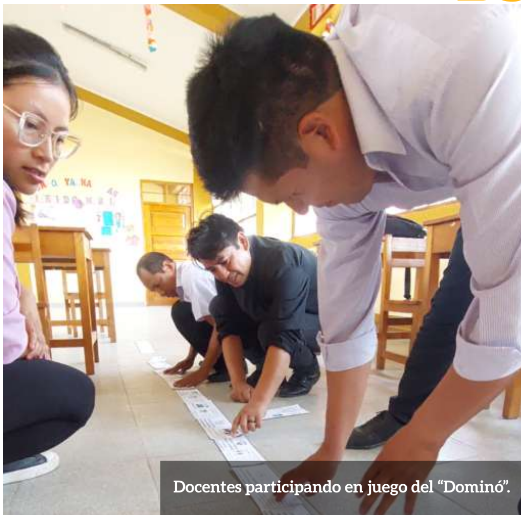
Docentes participando en juego del "Dominó".

Los facilitadores proporcionaron un Kit de Materiales