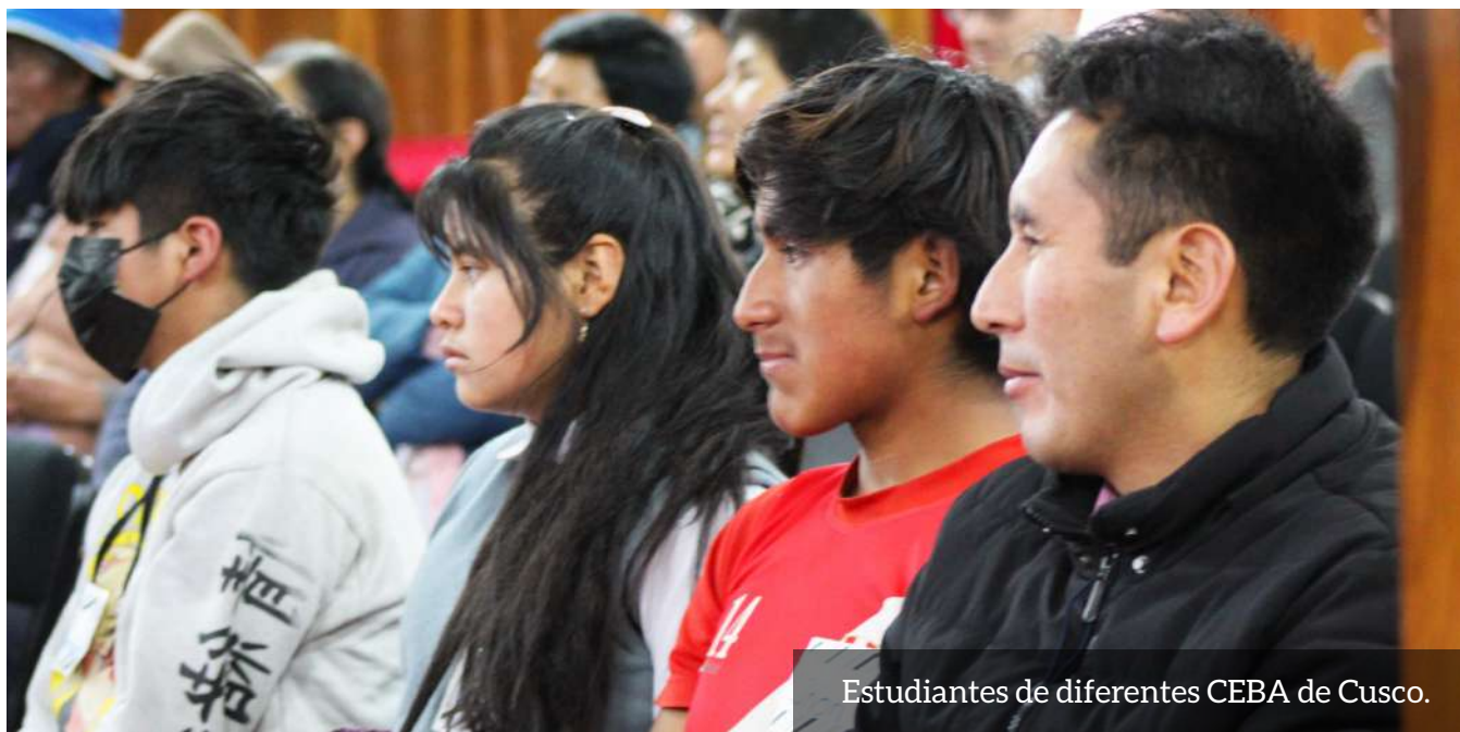
Estudiantes de diferentes CEBA de Cusco.