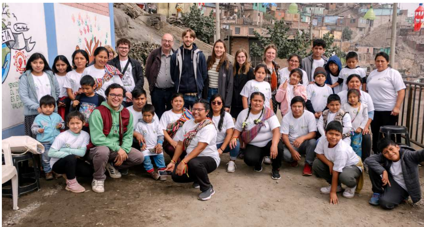
Foto grupal: Comunidades de San Juan de Lurigancho, niñas, niños, adolescentes y madres y padres de familia; Entraide & Fraternité, Equipo Kallpa Lima.