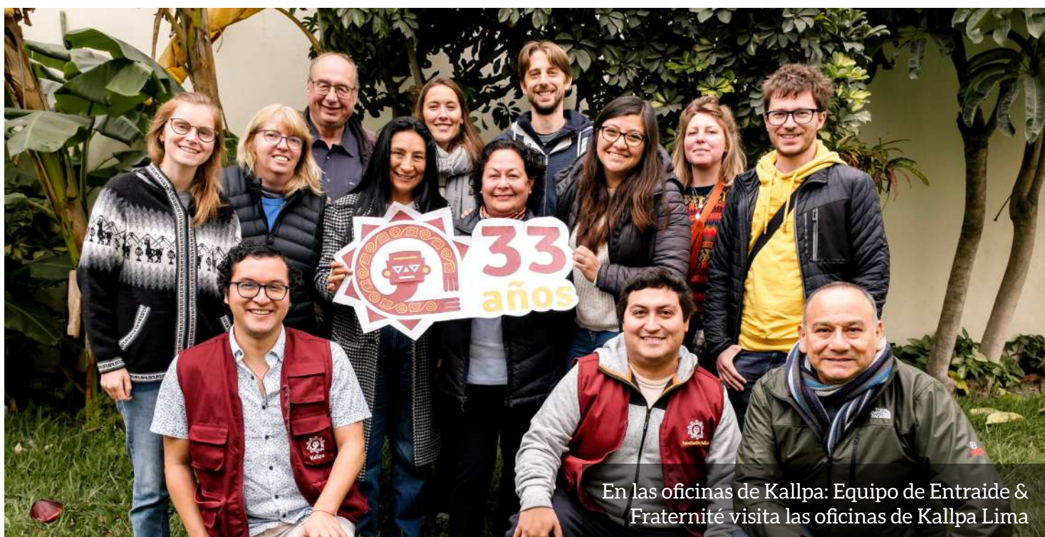
En las oficinas de Kallpa: Equipo de Entraide & Fraternité visita las oficinas de Kallpa Lima

Con esas palabras llenas de esperanza, reiteramos nuestro agradecimiento a Entraide et Fraternité por el apoyo brindado a estas familias en lo que consideramos es lo más importante: aprender a cuidar nuestro medio ambiente.