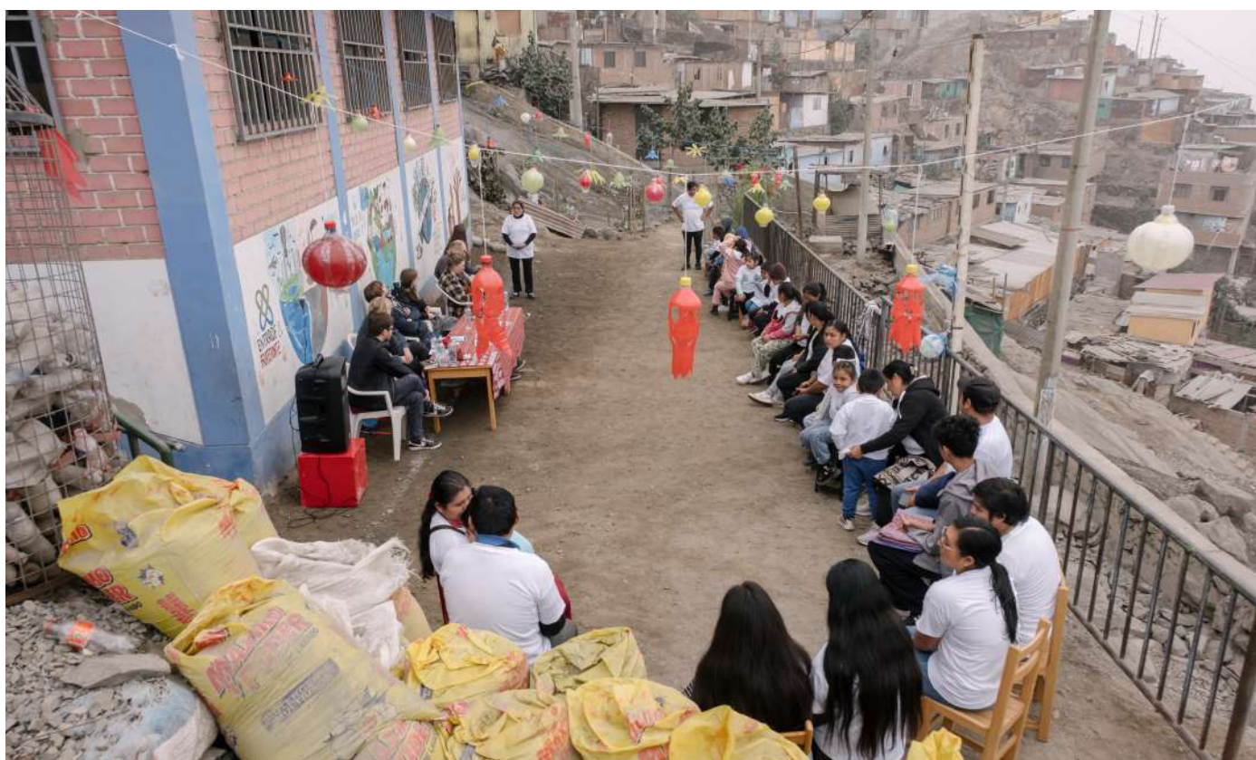
Bienvenida de las comunidades de San Juan de Lurigancho al equipo de Entraide & Fraternité.