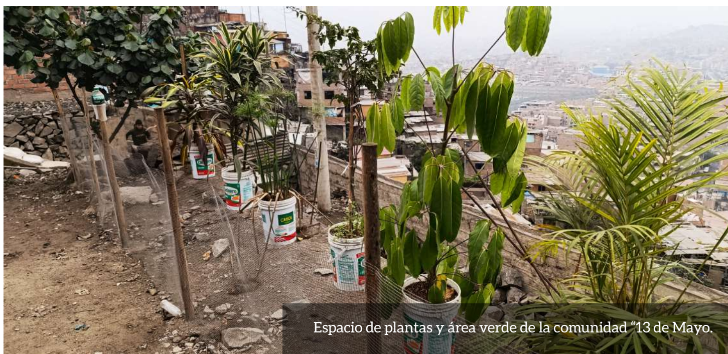
Espacio de plantas y área verde de la comunidad “13 de Mayo.

“...aprendemos sobre el cuidado de plantas, a cómo sembrar nuestros biohuer-