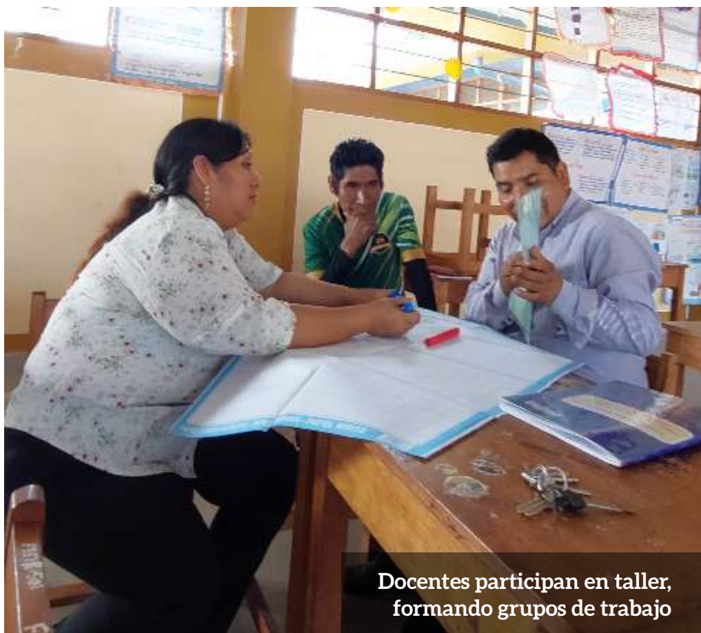
Docentes participan en taller, formando grupos de trabajo