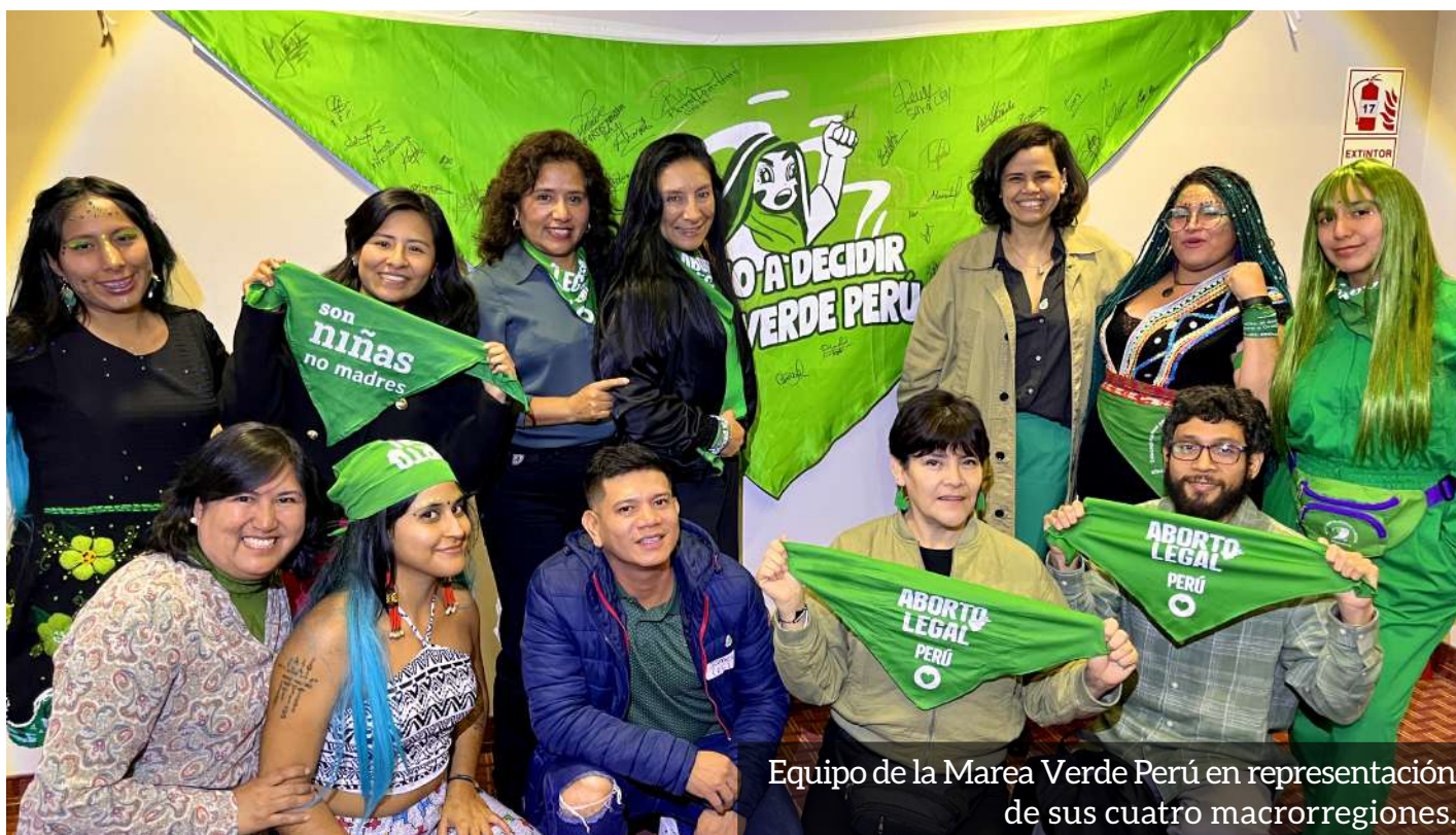
Equipo de la Marea Verde Perú en representación de sus cuatro macrorregiones.

El 26 de septiembre, en el marco del centenario de la legalización del aborto terapéutico en Perú, Marea Verde Perú participó en un taller organizado por PROMSEX , donde se visibilizó el contexto de la lucha por el acceso al Protocolo del Aborto Terapéutico , así como los retos y dificultades que enfrenta.