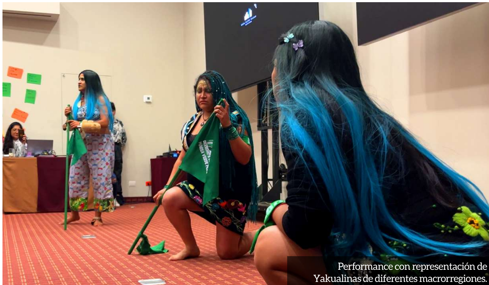
Performance con representación de Yakualinas de diferentes macrorregiones.