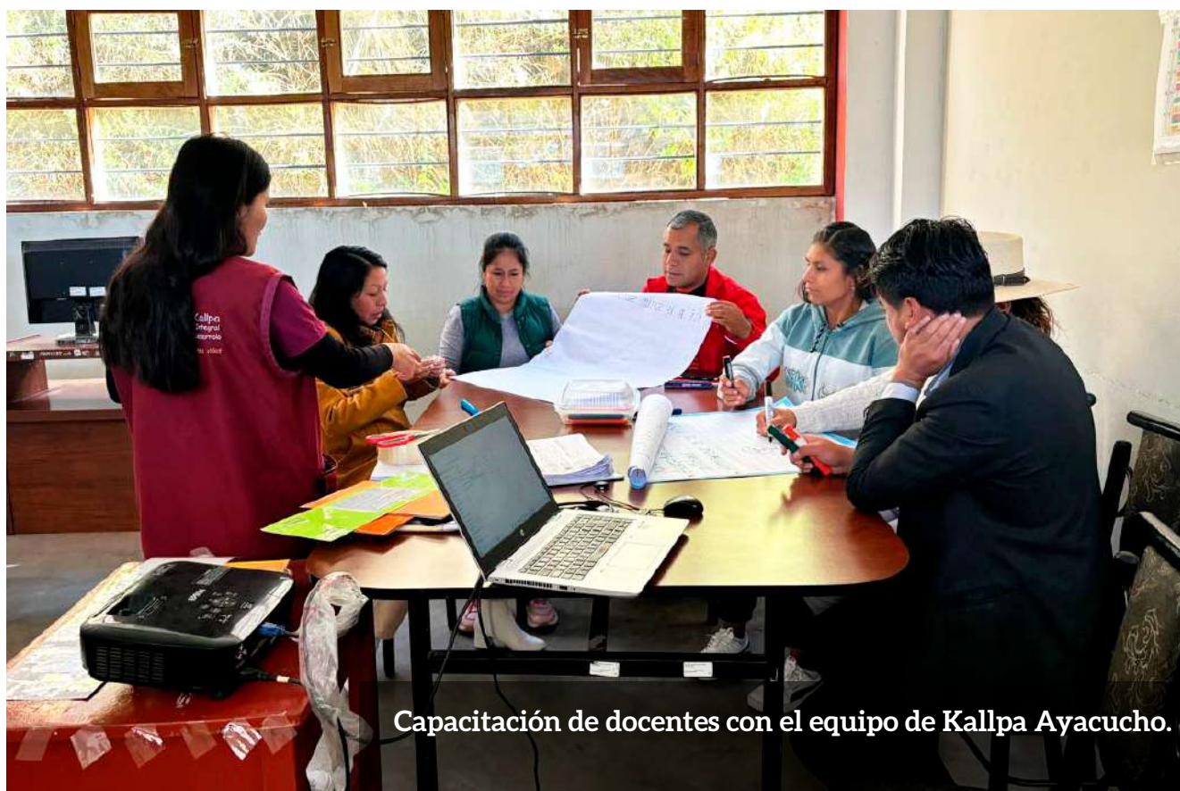
Capacitación de docentes con el equipo de Kallpa Ayacucho.