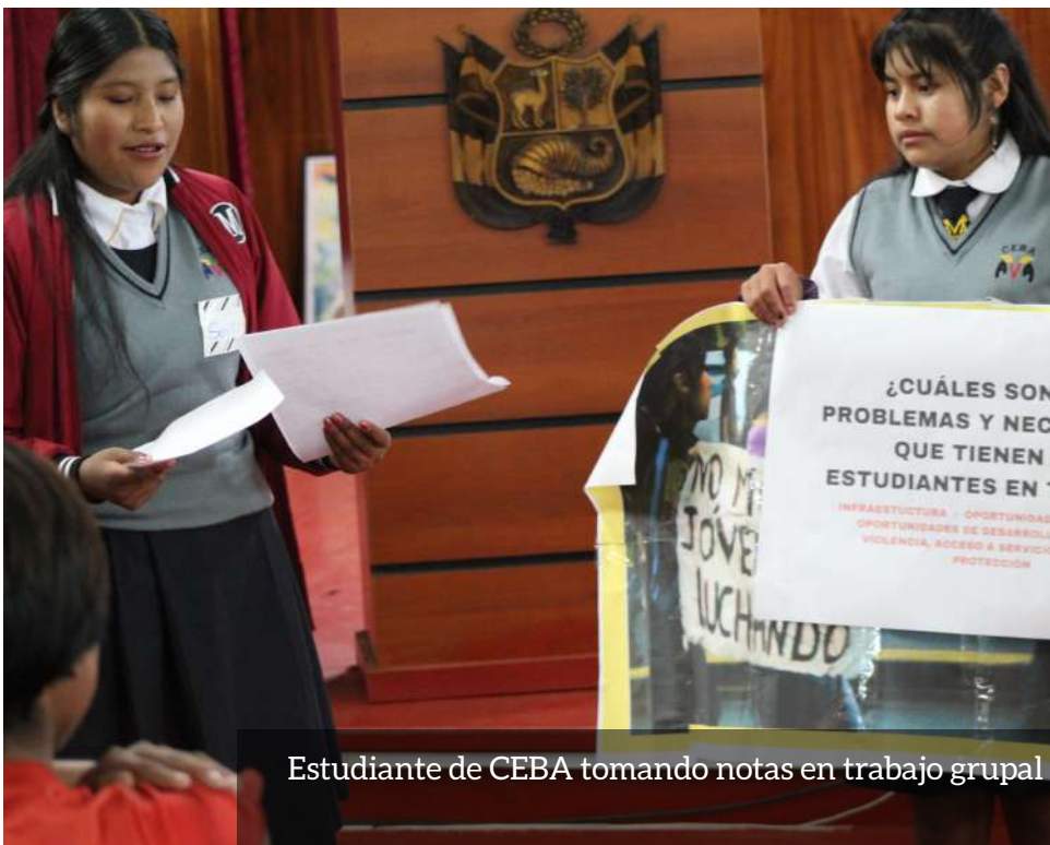
Estudiante de CEBA tomando notas en trabajo grupal

Este encuentro es solo el primer paso en un camino hacia la incidencia en los derechos de los estudiantes de CEBA de Cusco. Es crucial contar con espacios donde puedan expresarse libremente y hacer llegar sus demandas a las autoridades responsables de mejorar la calidad educativa para todos. Por esto, seguimos trabajando para que cada estudiante pueda transformar su vida y continuar hacia adelante.