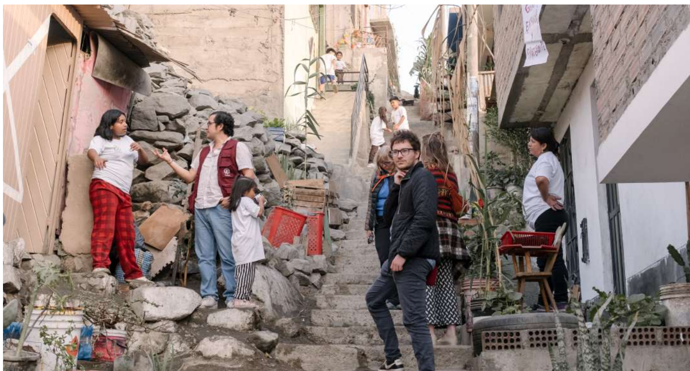
Visitando las casas de las niñas, niños y sus familias guardianes del medio ambiente.