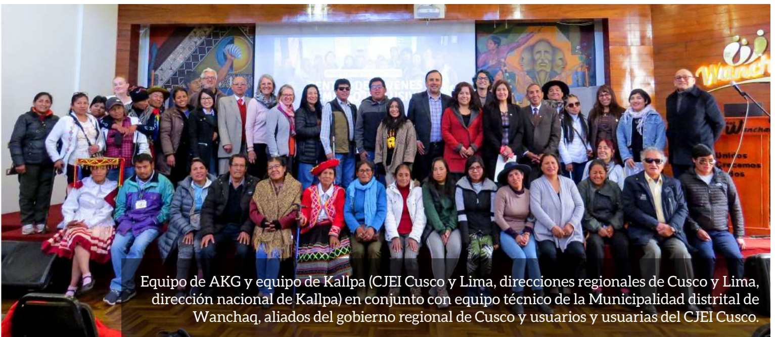
Equipo de AKG y equipo de Kallpa (CJEI Cusco y Lima, direcciones regionales de Cusco y Lima, dirección nacional de Kallpa) en conjunto con equipo técnico de la Municipalidad distrital de Wanchaq, aliados del gobierno regional de Cusco y usuarios y usuarias del CJEI Cusco.