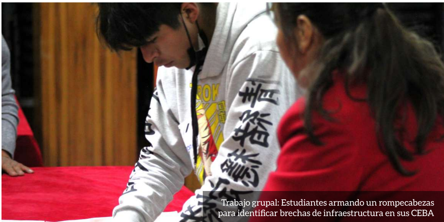
Trabajo grupal: Estudiantes armando un rompecabezas para identificar brechas de infraestructura en sus CEBA