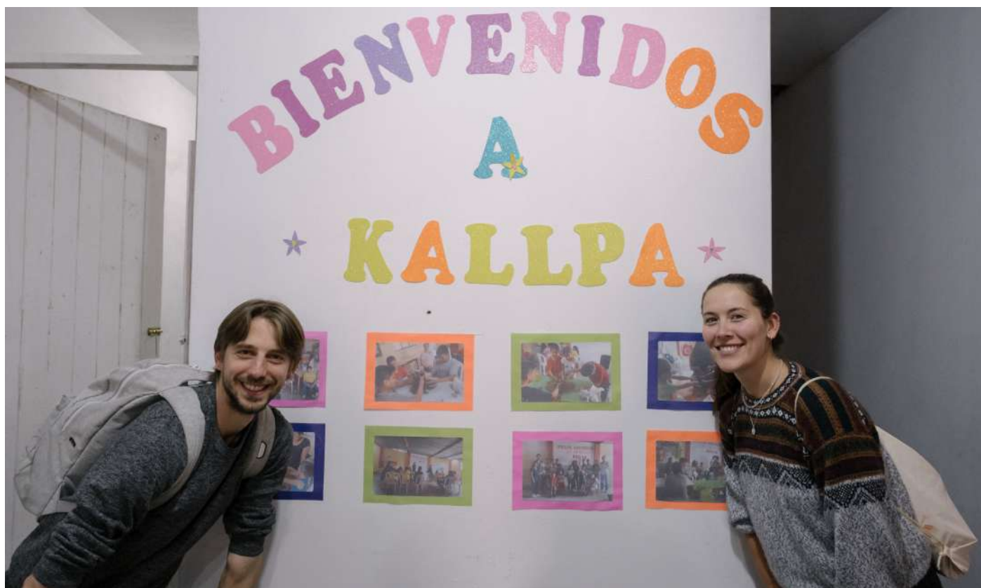
Equipo de Entraide & Fraternité visitando los espacios donde Kallpa trabaja con las comunidades por el cuidado del medio ambiente.