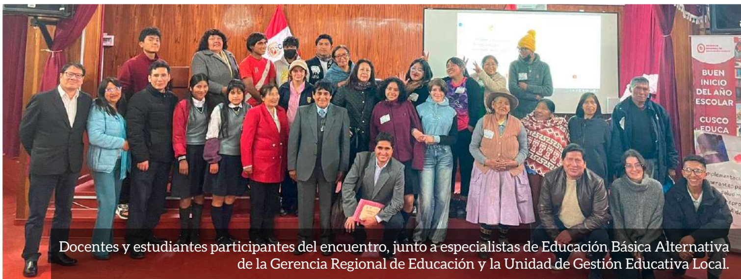
Docentes y estudiantes participantes del encuentro, junto a especialistas de Educación Básica Alternativa de la Gerencia Regional de Educación y la Unidad de Gestión Educativa Local.