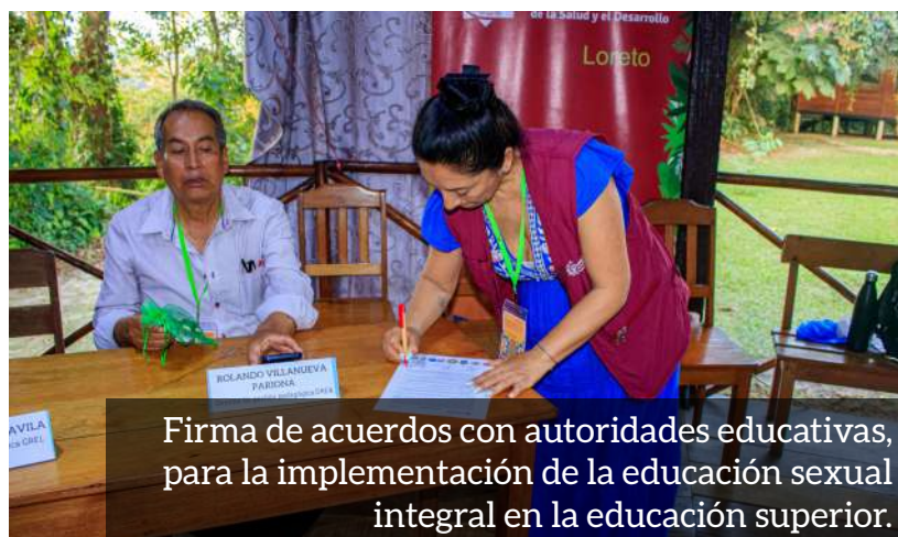
Firma de acuerdos con autoridades educativas, para la implementación de la educación sexual integral en la educación superior.

fue establecer alianzas estratégicas para colaborar con instituciones públicas y de la sociedad civil, así como promover la incorporación de la ESI y mejorar la calidad educativa en la educación