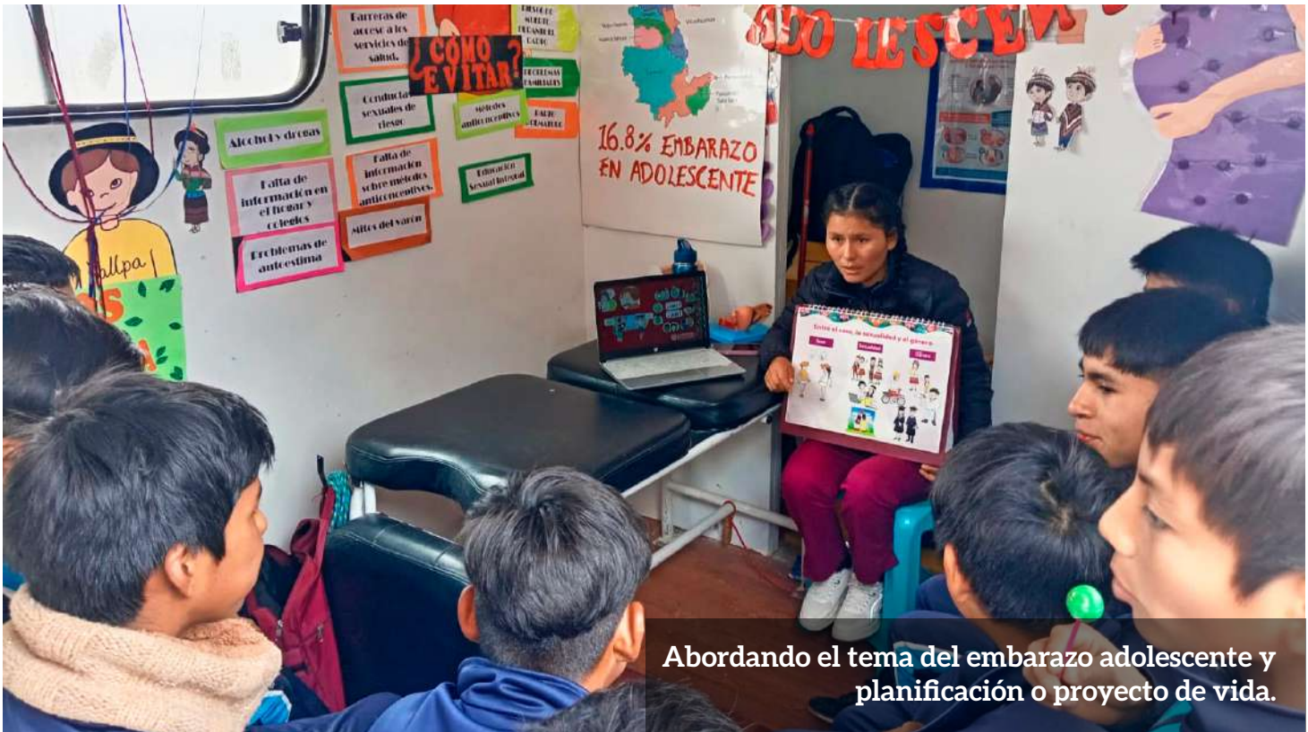
Abordando el tema del embarazo adolescente y planificación o proyecto de vida.