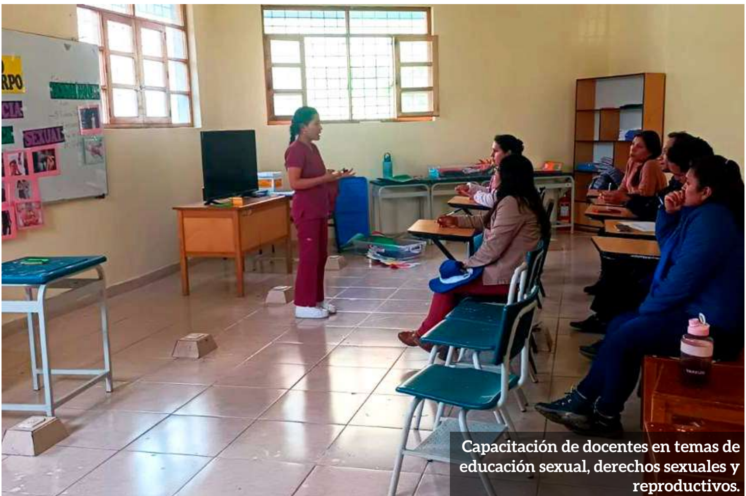
Capacitación de docentes en temas de educación sexual, derechos sexuales y reproductivos.