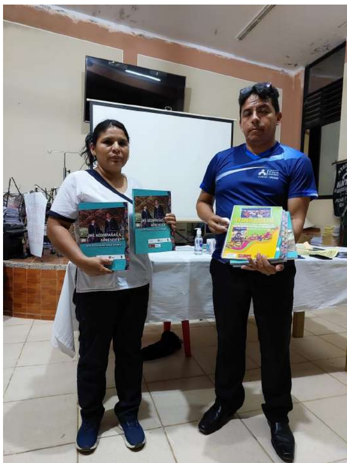
Asociación Kallpa hizo entrega de materiales educativos y virtuales al Centro de Salud de Pichari Kimbiri.