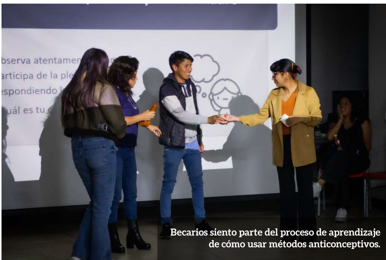
Becarios sienten parte del proceso de aprendizaje de cómo usar métodos anticonceptivos.