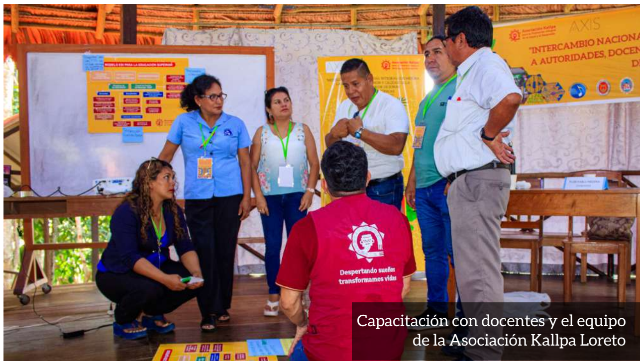
Capacitación con docentes y el equipo de la Asociación Kallpa Loreto