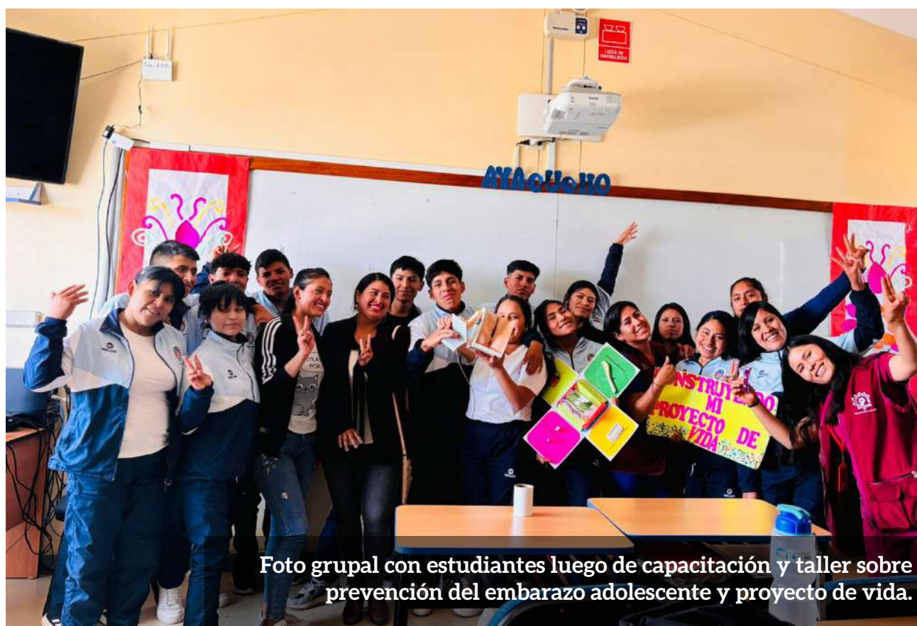
Foto grupal con estudiantes luego de capacitación y taller sobre prevención del embarazo adolescente y proyecto de vida.