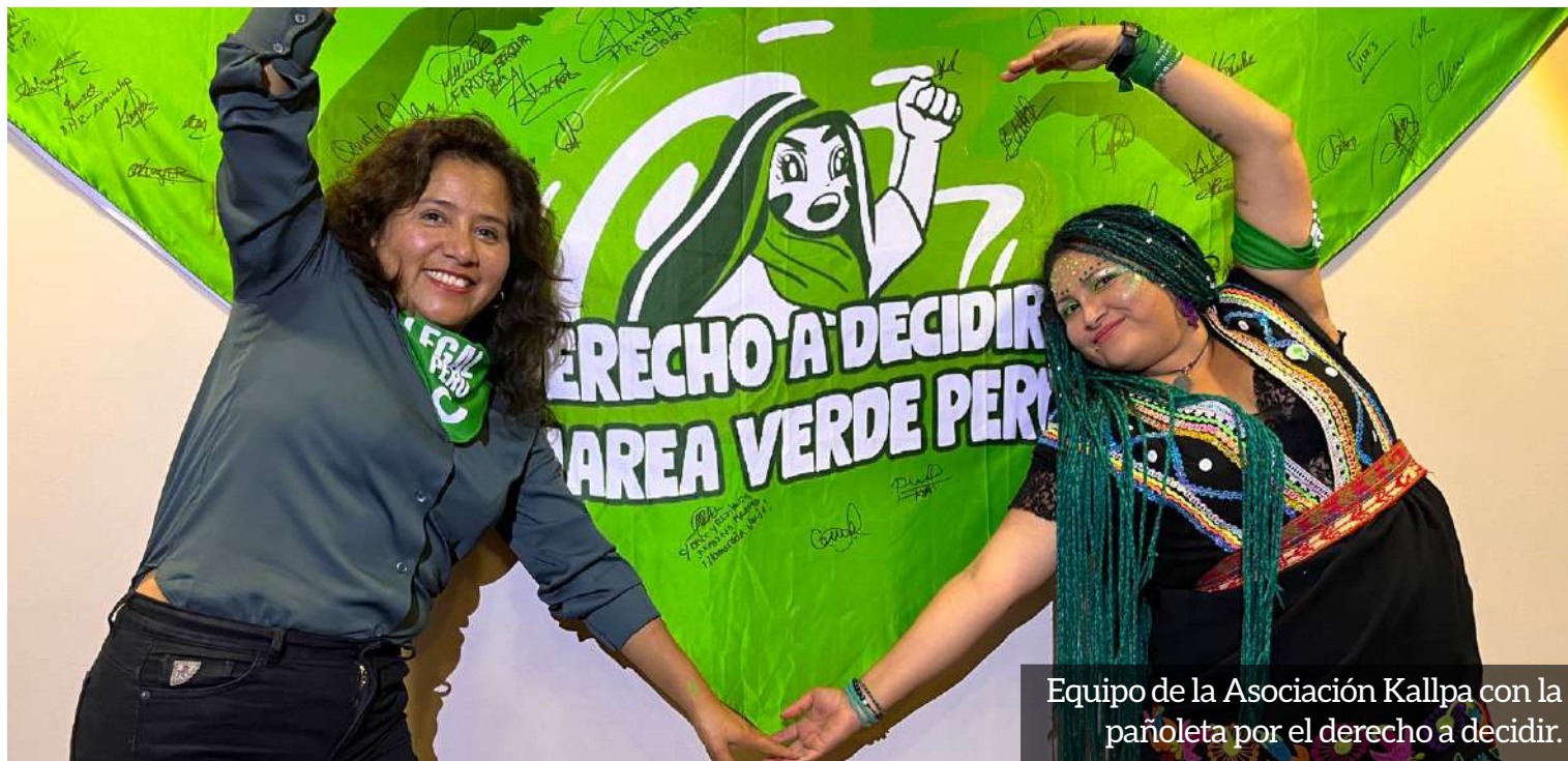
Equipo de la Asociación Kallpa con la pañoleta por el derecho a decidir.