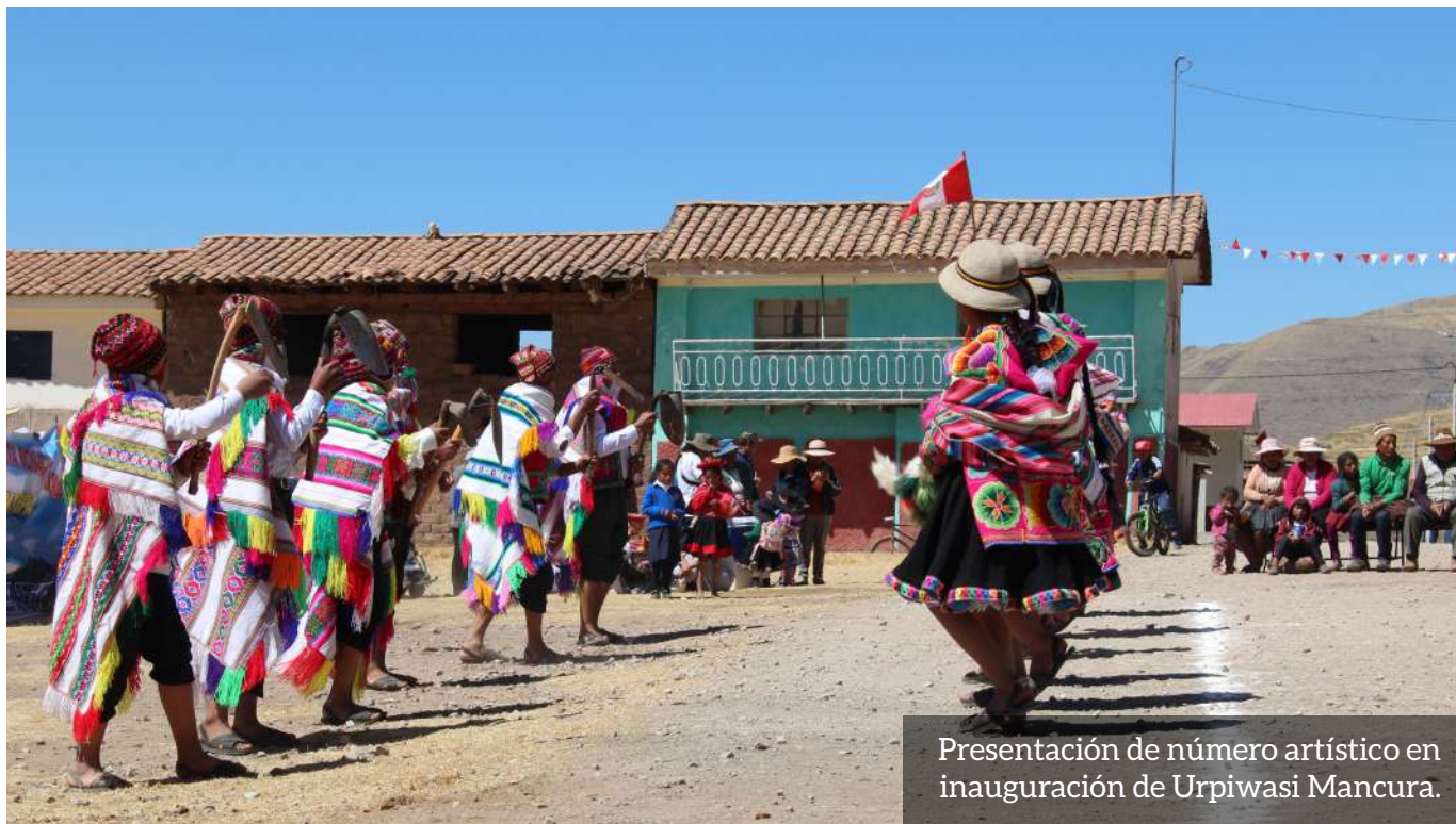
Presentación de número artístico en inauguración de Urpiwasi Mancura.