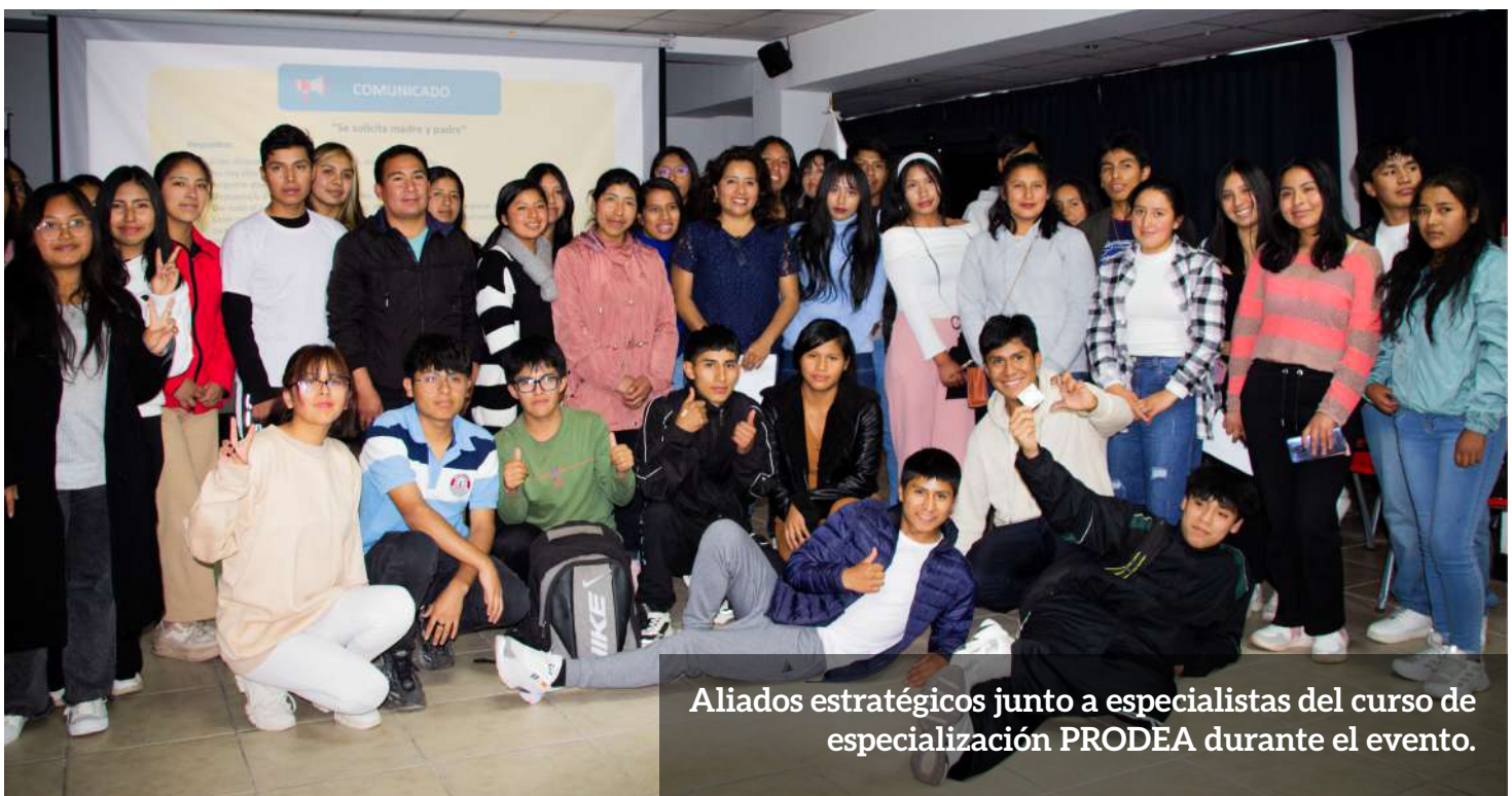
Aliados estratégicos junto a especialistas del curso de especialización PRODEA durante el evento.

El Programa comenzó en junio de manera presencial en las 13 provincias de la región y, posteriormente, se estableció una alianza con el Centro de Investigaciones y Servicios Educativos (CISE) de la Pontificia Universidad Católica del Perú (PUCP) para ofrecerlo virtualmente hasta noviembre, aseguran-