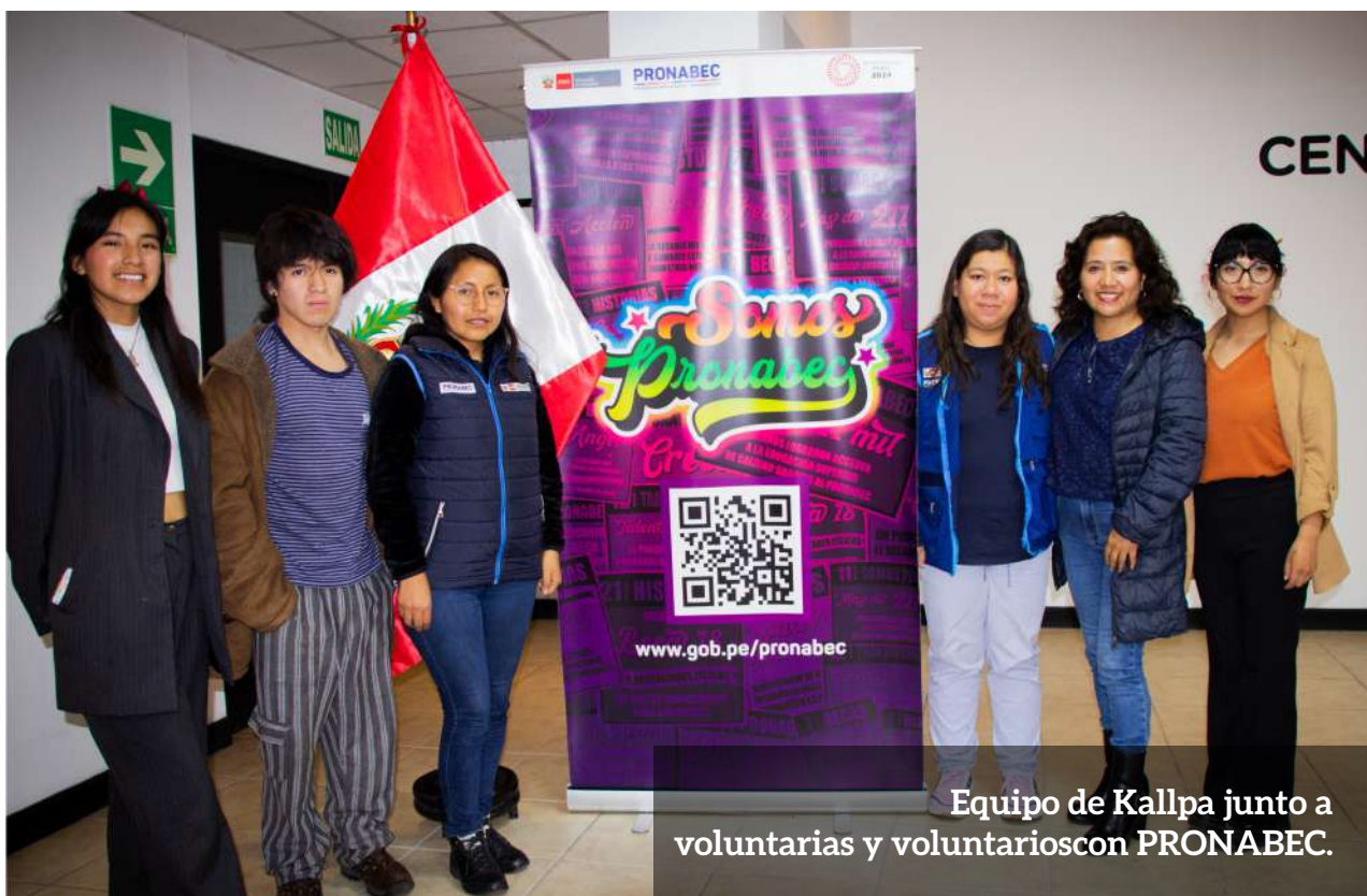
Equipo de Kallpa junto a voluntarias y voluntarios con PRONABEC.