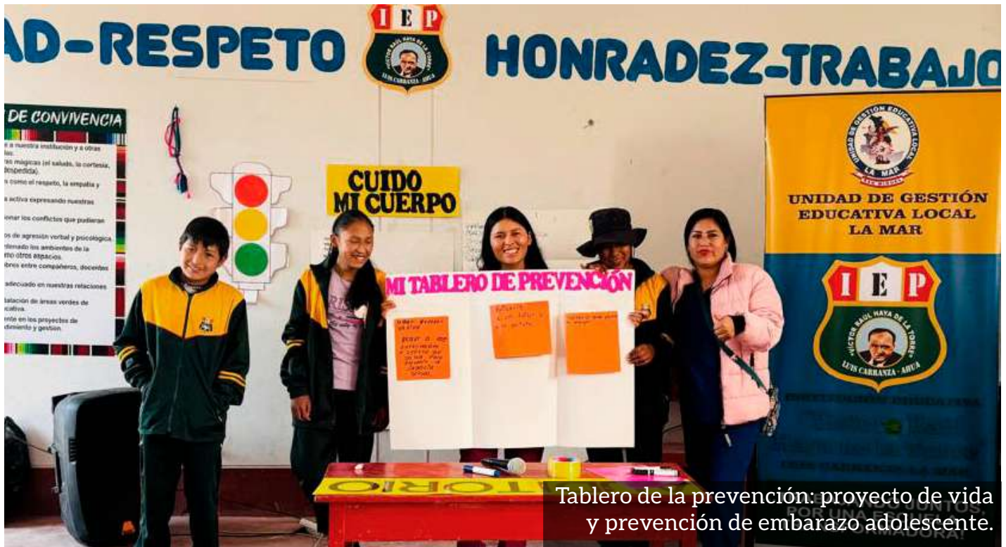
Tablero de la prevención: proyecto de vida y prevención de embarazo adolescente.

Hasta la fecha, estamos implementando la fase puente del proyecto “Derechos sexuales y reproductivos para pueblos indígenas de Ayacucho”. Para ello, estamos recorriendo las zonas altoandinas de Ayacucho con un bus itinerante, ofreciendo orientación y consejería en salud sexual reproductiva y proyectos de vida a los adolescentes de 155 instituciones educativas de nivel secundario en zonas rurales, así como a 4