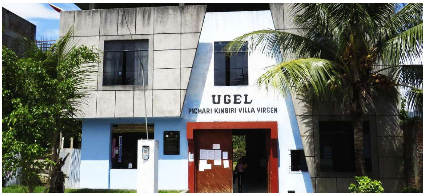
Unidad de Gestión Educativa Local de Pichari Kimbiri - Villa Virgen

Agradecemos la coordinación con la UGEL Pichari Kimbiri que nos ha permitido realizar todas las coordinaciones junto a la Gerencia Regional de Educación para poder realizar esta capacitación.