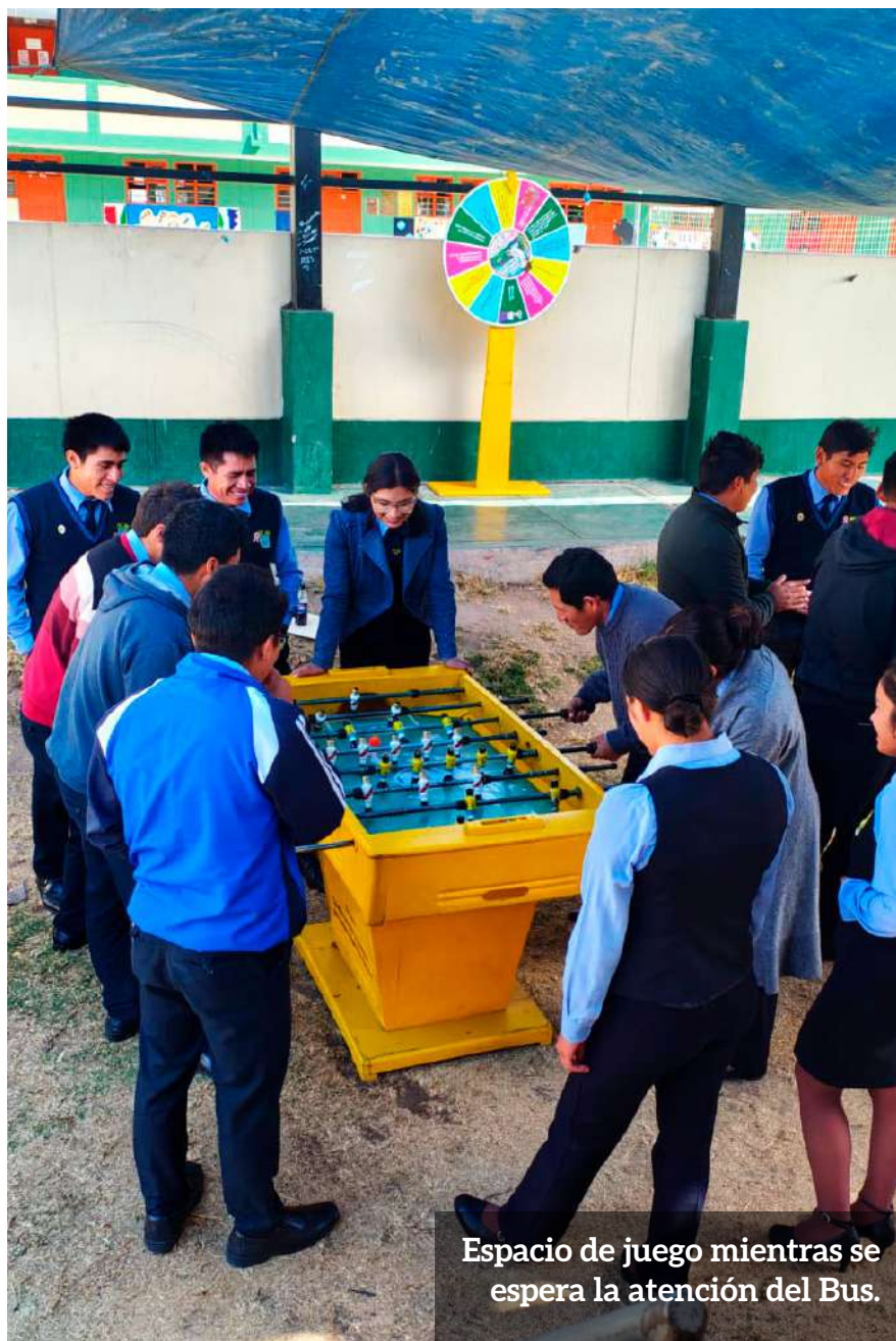
Espacio de juego mientras se espera la atención del Bus.

“Se ha capacitado a un total de 170 docentes tutores y 655 jóvenes”