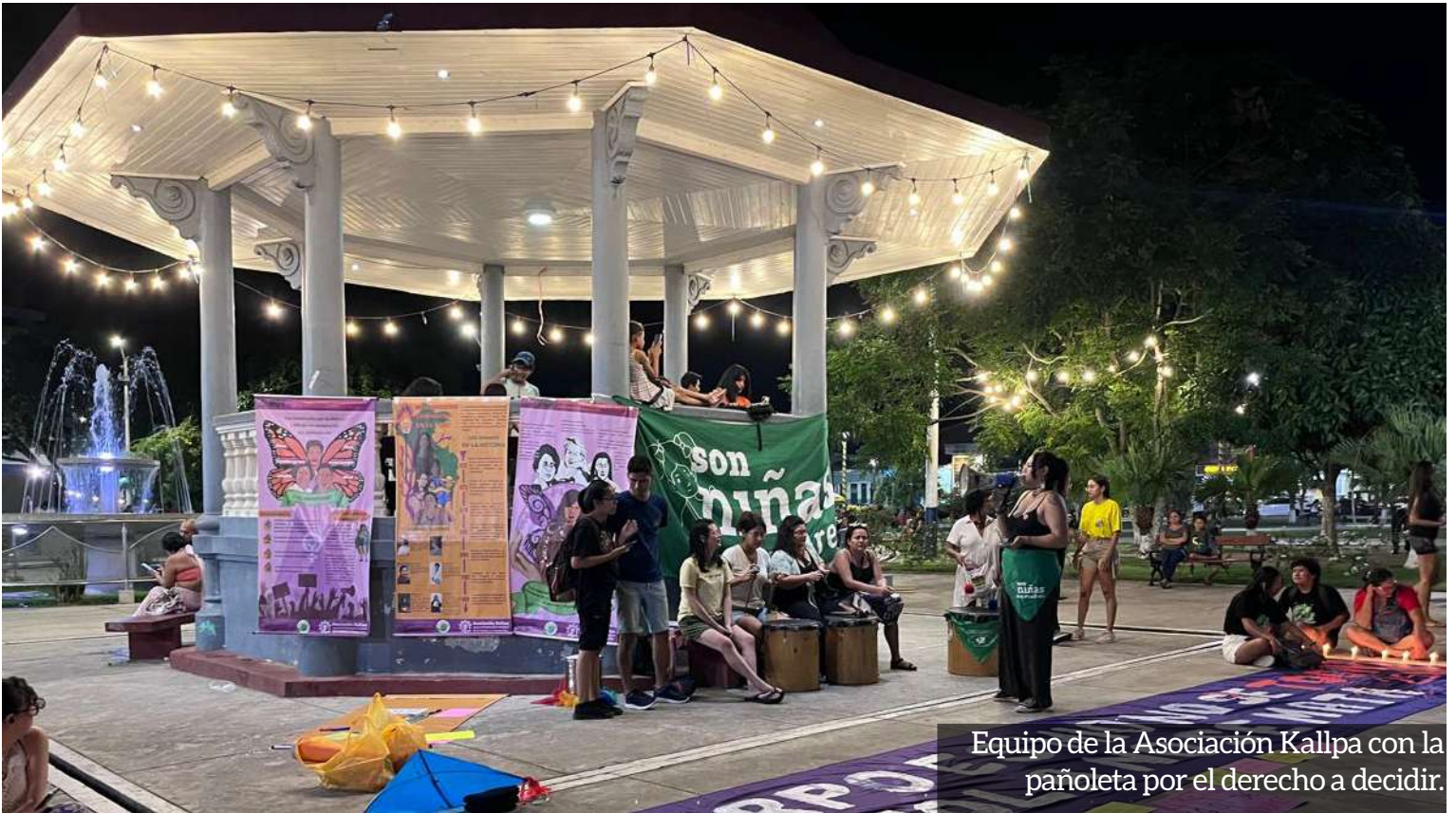
Equipo de la Asociación Kallpa con la pañoleta por el derecho a decidir.