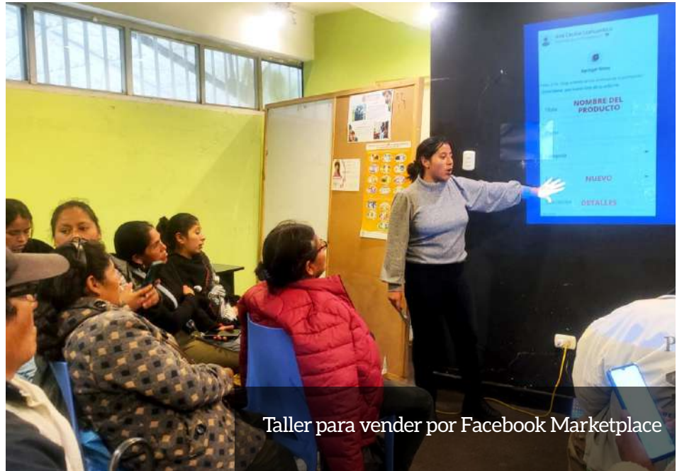
Taller para vender por Facebook Marketplace

Luego de ello se desarrolló una práctica en la cual las y los emprendedores aprendieron a utilizar las cámaras de sus teléfonos para capturar imágenes atractivas de sus productos. Con conceptos como la regla de los tercios, ilumina-