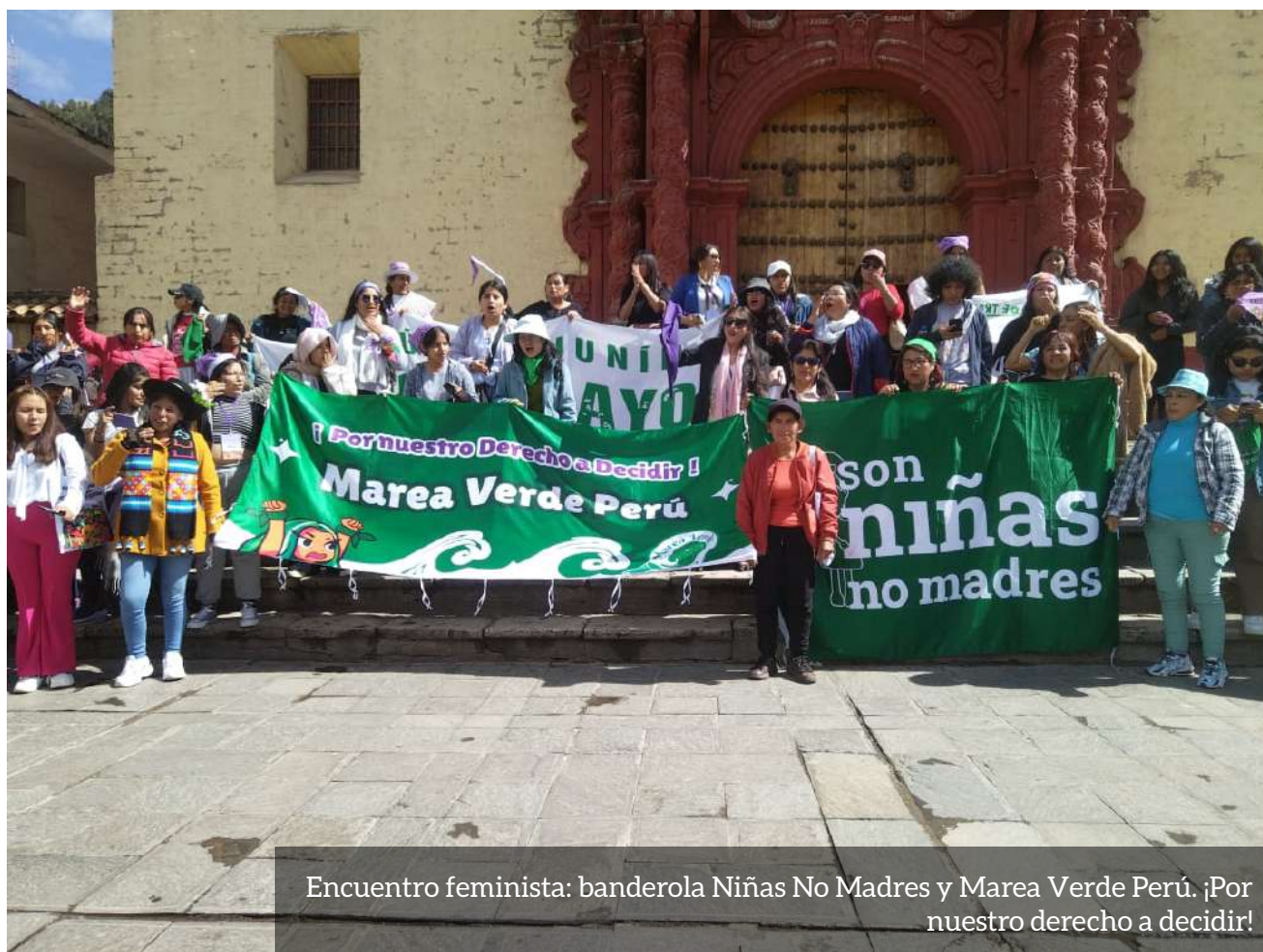
Encuentro feminista: banderola Niñas No Madres y Marea Verde Perú. ¡Por nuestro derecho a decidir!