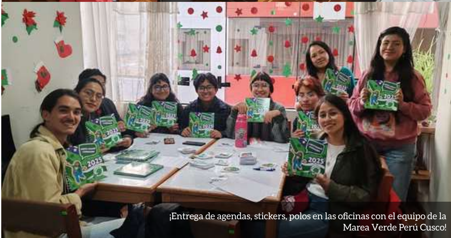
¡Entrega de agendas, stickers, polos en las oficinas con el equipo de la Marea Verde Perú Cusco!