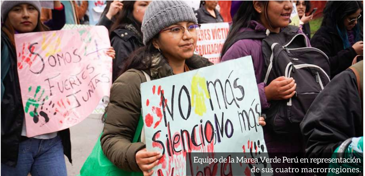
Equipo de la Marea Verde Perú en representación de sus cuatro macrorregiones.

La Marea Verde Perú unió sus colores con el morado el 25 de noviembre , con motivo del Día Internacional de la Eliminación de la Violencia contra las Mujeres . En esta fecha tan significativa, activistas de diversas macrorregiones del país se organizaron y convocaron una serie de acciones para visibilizar esta problemática que sigue afectando a millones de mujeres en el Perú y el mundo.