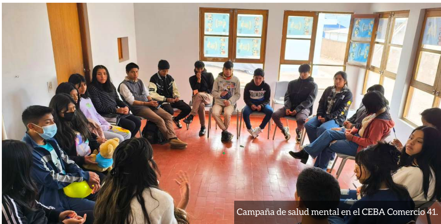
Campaña de salud mental en el CEBA Comercio 41.

Desde Kallpa, mantenemos nuestro compromiso de trabajo que favorezca a las y los estudiantes de los CEBA de Cusco , contribuyendo a su desarrollo y, sobre todo, al cierre de las brechas que enfrentan día a día.