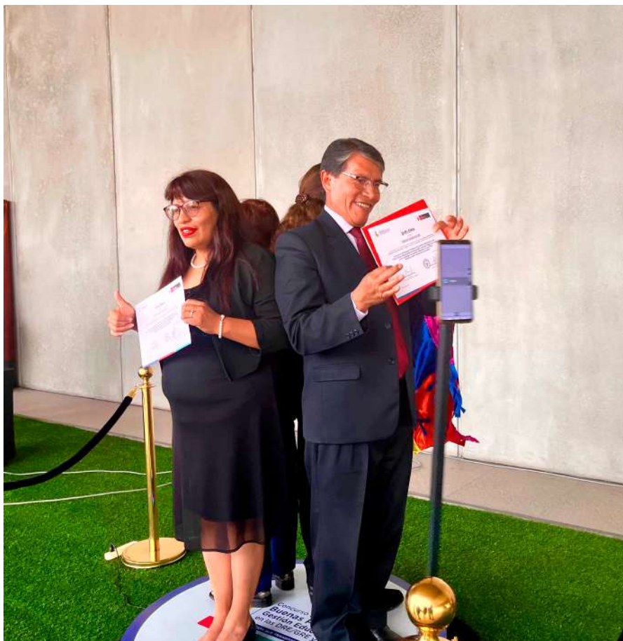
■ Equipo de la Gerencia Regional de Educación Cusco en una divertida sesión de fotos luego de la premiación.