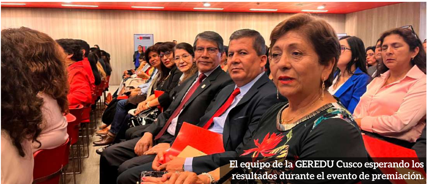
El equipo de la GEREDU Cusco esperando los resultados durante el evento de premiación.

“Este logro destaca el valor del trabajo multisectorial y articulado, demostrando que la colaboración entre instituciones es clave para fortalecer el desarrollo”.