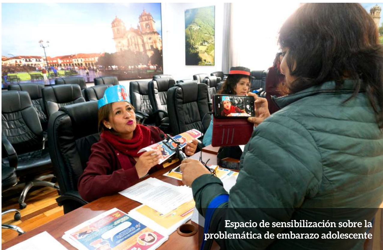
Espacio de sensibilización sobre la problemática de embarazo adolescente