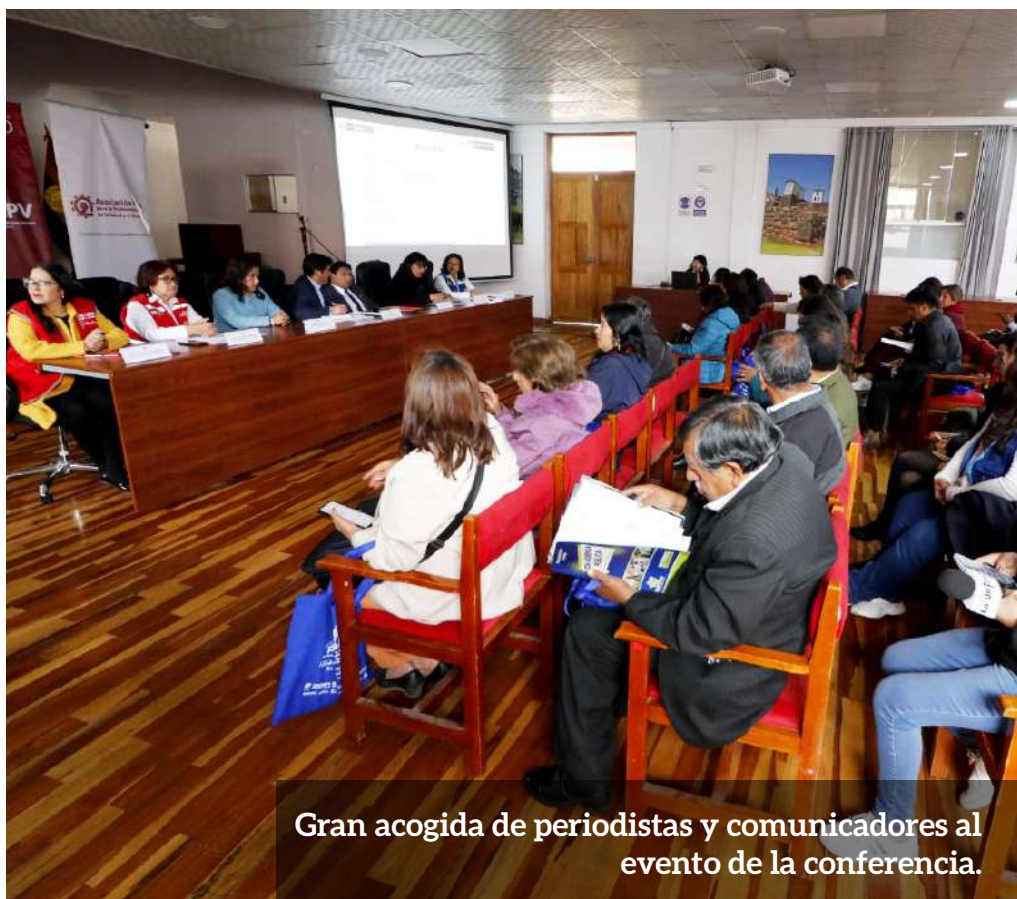
Gran acogida de periodistas y comunicadores al evento de la conferencia.