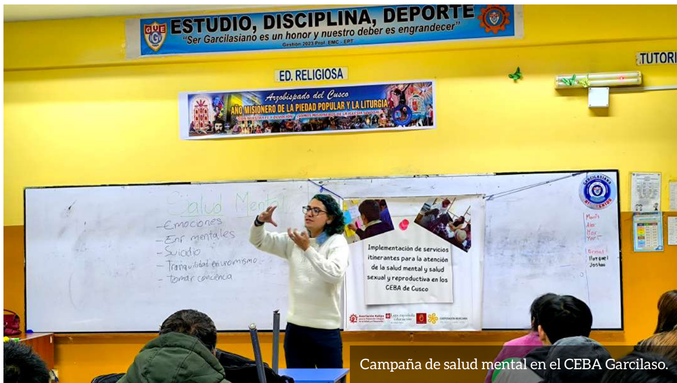
Campaña de salud mental en el CEBA Garcilaso.