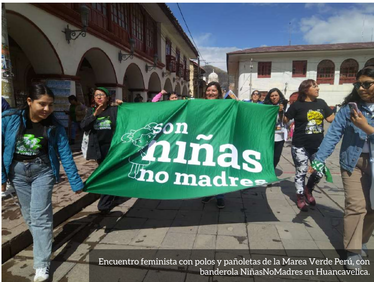
Encuentro feminista con polos y pañoletas de la Marea Verde Perú, con banderola NiñasNoMadres en Huancavelica.