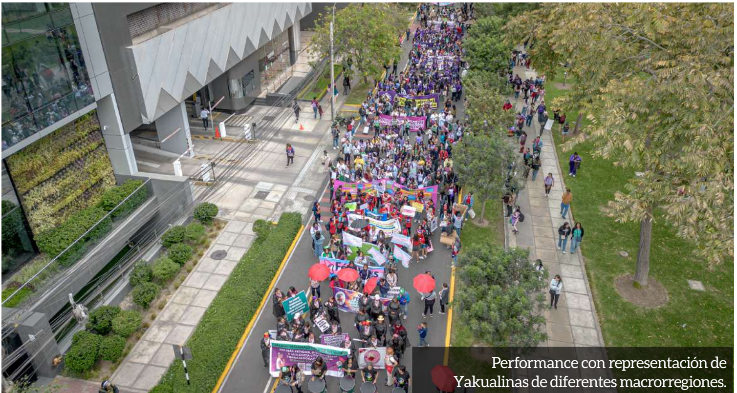
Performance con representación de Yakualinas de diferentes macrorregiones.