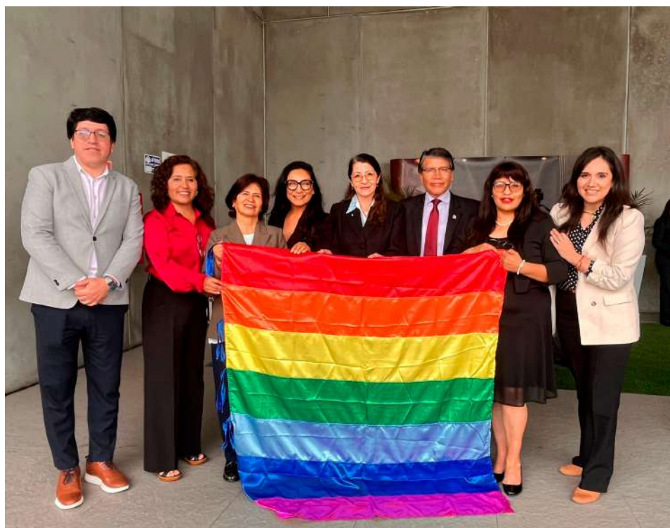
■ Equipo Kallpa y GEREDU Cusco