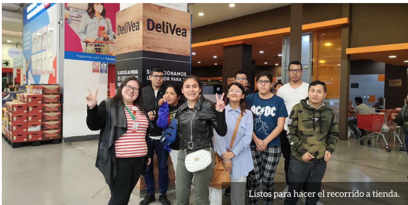
Listos para hacer el recorrido a tienda.