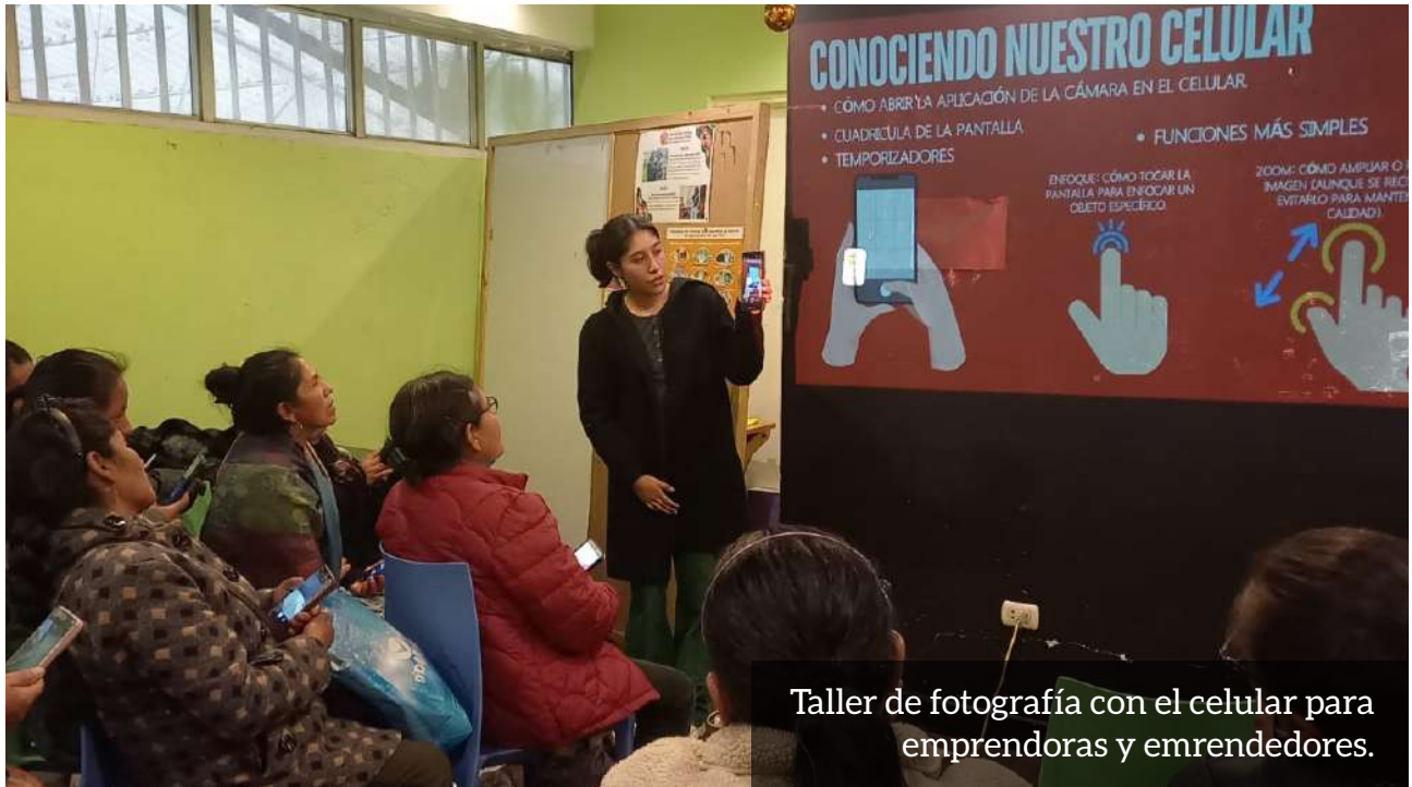
Taller de fotografía con el celular para emprendedoras y emrendedores.