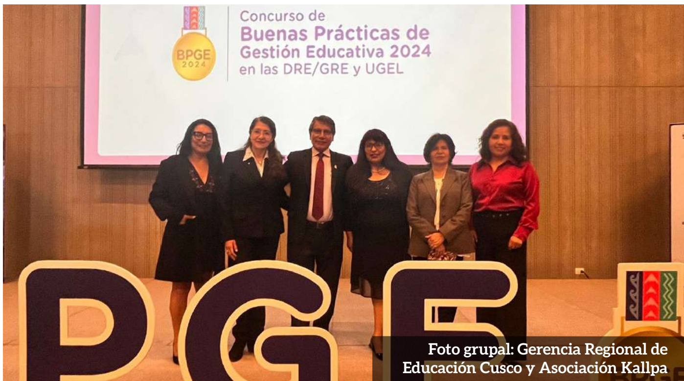
Foto grupal: Gerencia Regional de Educación Cusco y Asociación Kallpa

En una ceremonia especial realizada en el Centro de Convenciones de la ciudad de Lima, la Gerencia Regional de Educación Cusco fue premiada por el Ministerio de Educación al obtener el primer lugar en el Concurso de Buenas Prácticas de Gestión Educativa en las Gerencias Regionales, Direcciones Regionales y Unidades de Gestión Educativa Local 2024, denominado “Gestión que Transforma Escuela”, organizado por el Ministerio de Educación.