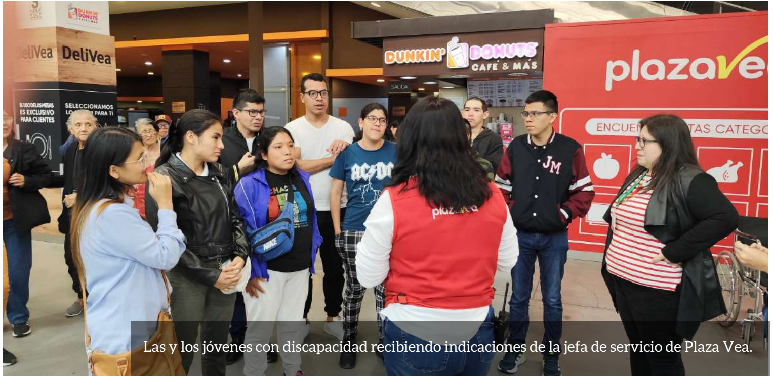
Las y los jóvenes con discapacidad recibiendo indicaciones de la jefa de servicio de Plaza Vea.