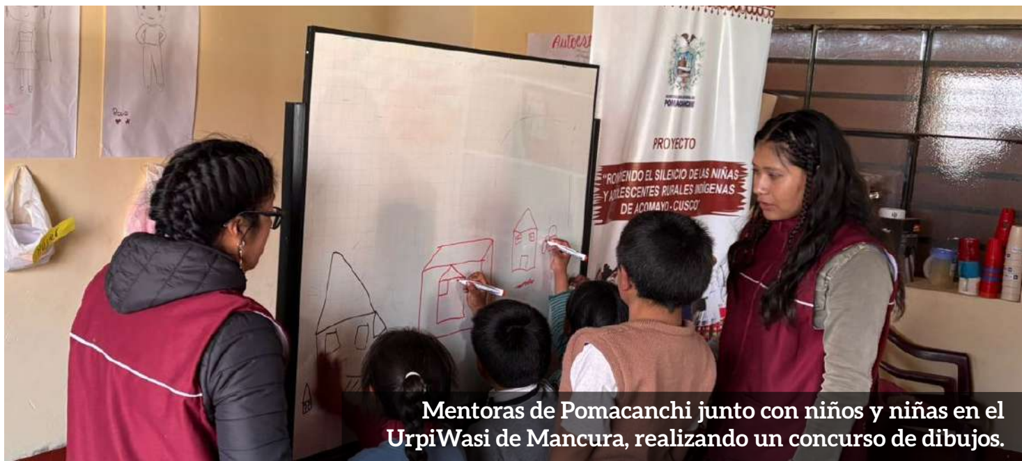
Mentoras de Pomacanchi junto con niños y niñas en el UrpiWasi de Mancura, realizando un concurso de dibujos.