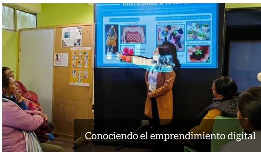
Conociendo el emprendimiento digital

motor clave para el desarrollo económico, el Centro de Jóvenes y Empleo Inclusivo (CJEI) se posiciona como un referente al brindar capacitaciones inclusivas y accesibles. Su plan de