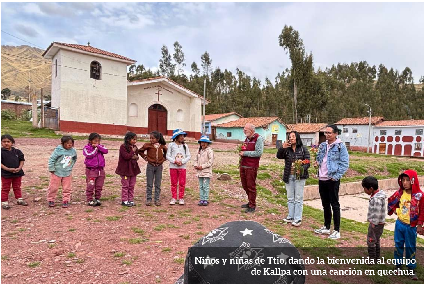
Niños y niñas de Ttio, dando la bienvenida al equipo de Kallpa con una canción en quechua.