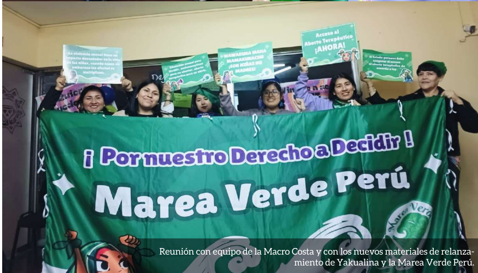
Reunión con equipo de la Macro Costa y con los nuevos materiales de relanzamiento de Yakualina y la Marea Verde Perú.