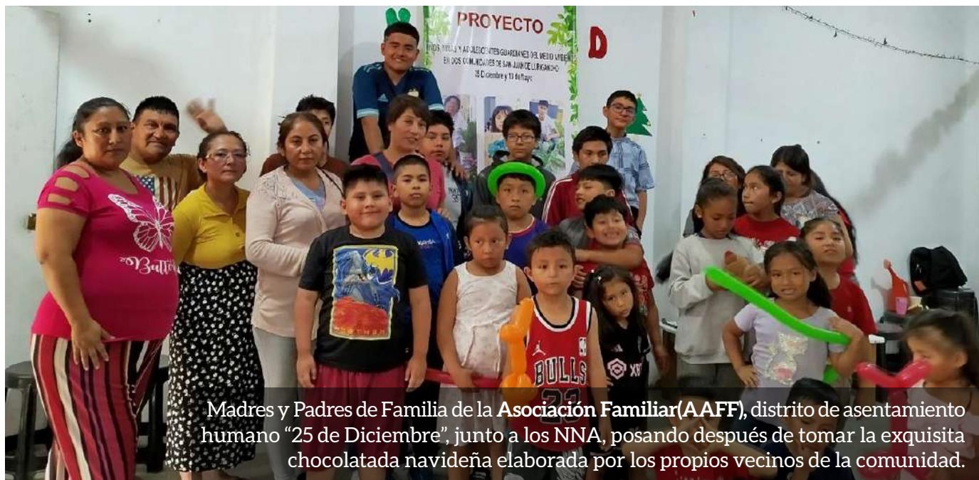
Madres y Padres de Familia de la Asociación Familiar(AAFF) , distrito de asentamiento humano “25 de Diciembre”, junto a los NNA, posando después de tomar la exquisita chocolatada navideña elaborada por los propios vecinos de la comunidad.