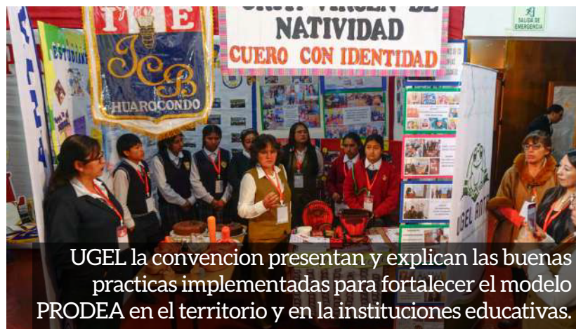
UGEL la convención presentan y explican las buenas practicas implementadas para fortalecer el modelo PRODEA en el territorio y en la instituciones educativas.

de la Ficha de Monitoreo a UGEL (escala de 0 a 40 puntos), instrumento oficial que evaluó ocho indicadores clave del Modelo PRODEA, vinculados a la articulación intersectorial, el monitoreo a instituciones