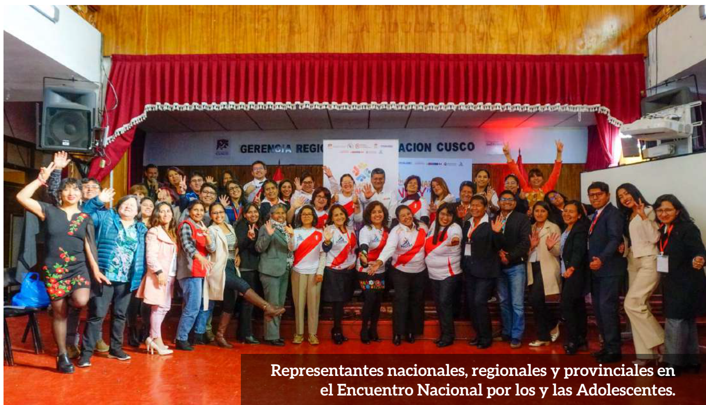
Representantes nacionales, regionales y provinciales en el Encuentro Nacional por los y las Adolescentes.