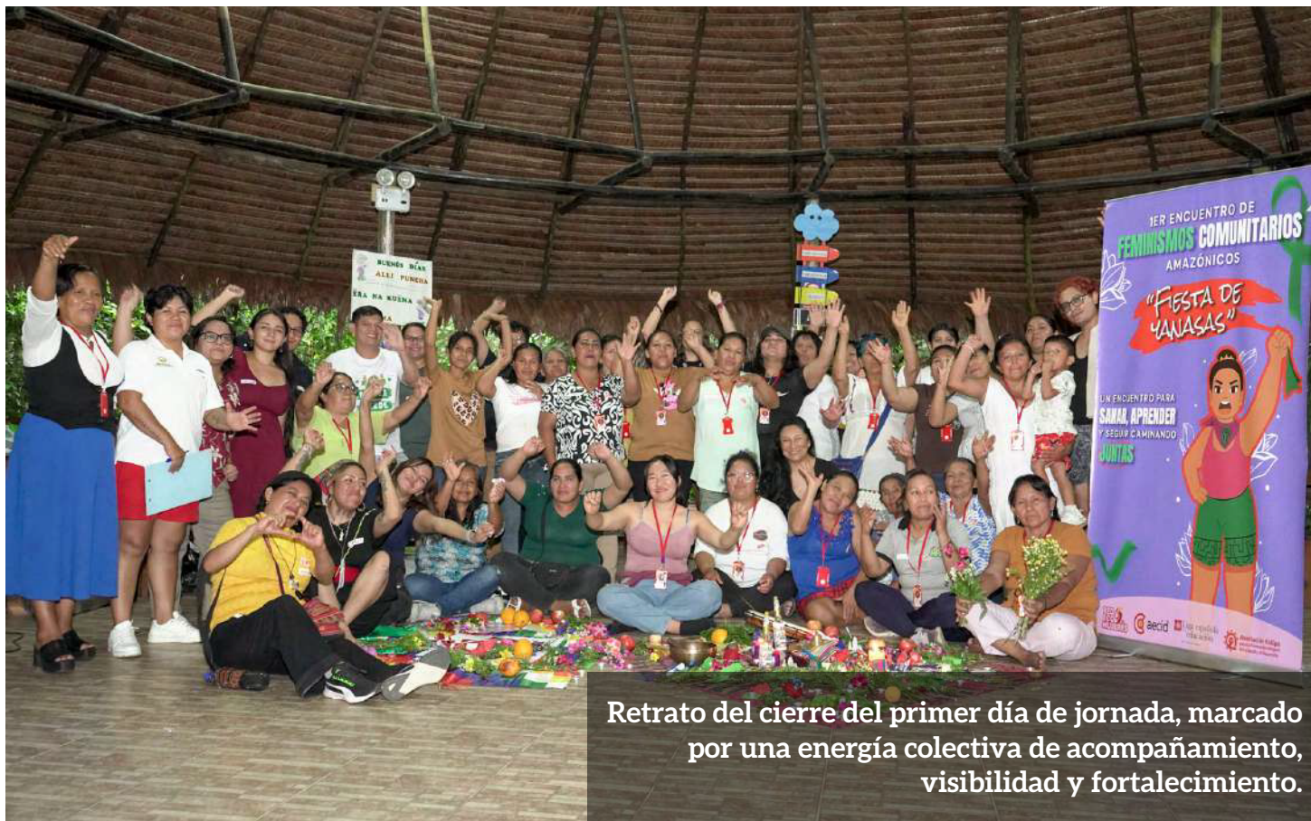
Retrato del cierre del primer día de jornada, marcado por una energía colectiva de acompañamiento, visibilidad y fortalecimiento.