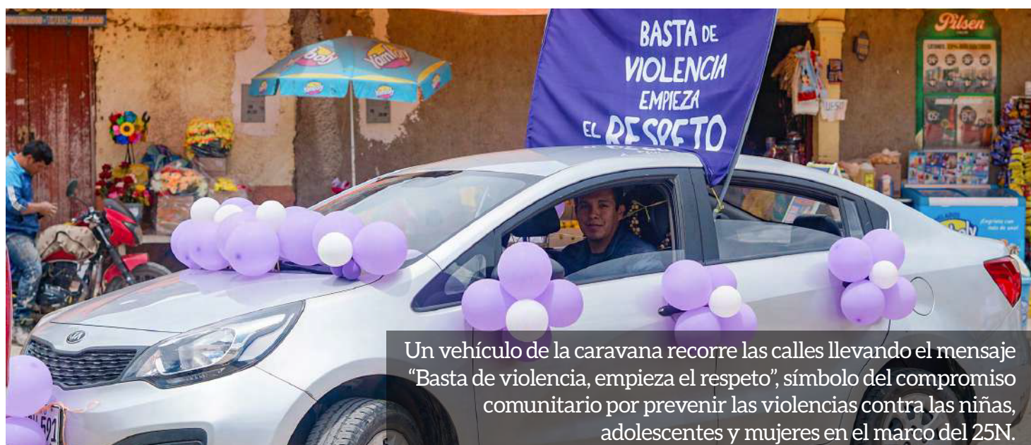
Un vehículo de la caravana recorre las calles llevando el mensaje “Basta de violencia, empieza el respeto”, símbolo del compromiso comunitario por prevenir las violencias contra las niñas, adolescentes y mujeres en el marco del 25N.

Acompañaron la caravana vehículos con mensajes como “Basta de violencia, empieza el respeto” , mientras las y los participantes entonaban arengas que resonaron en cada tramo del recorrido, llevando el