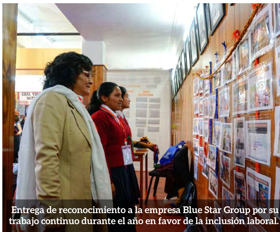
Entrega de reconocimiento a la empresa Blue Star Group por su trabajo continuo durante el año en favor de la inclusión laboral.

permitió reafirmar que la articulación entre los sectores educación, salud, trabajo y programas sociales es clave para garantizar oportunidades reales y sostenibles para la adolescencia rural. Como resultado central, se fortalecieron compromisos intersectoriales regionales y nacionales mediante la firma de actas de compromiso y acuerdos para su alineamiento con los instrumentos de política pública vigentes, consolidando a Cusco como un referente nacional en la promoción del desarrollo integral de las y los adolescentes rurales.