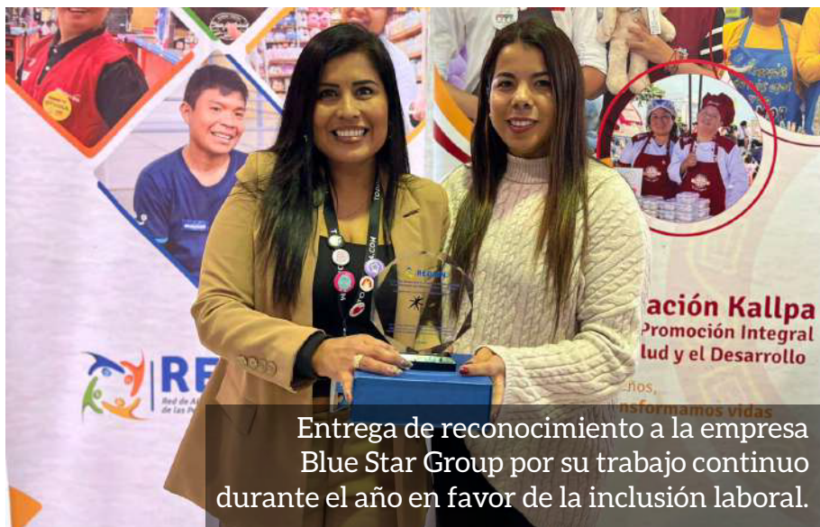
Entrega de reconocimiento a la empresa Blue Star Group por su trabajo continuo durante el año en favor de la inclusión laboral.

En el ámbito del emprendimiento, durante el 2025 el proyecto impulsó procesos de capacitación dirigidos a mujeres, madres, migrantes y jóvenes con discapacidad, fortale-