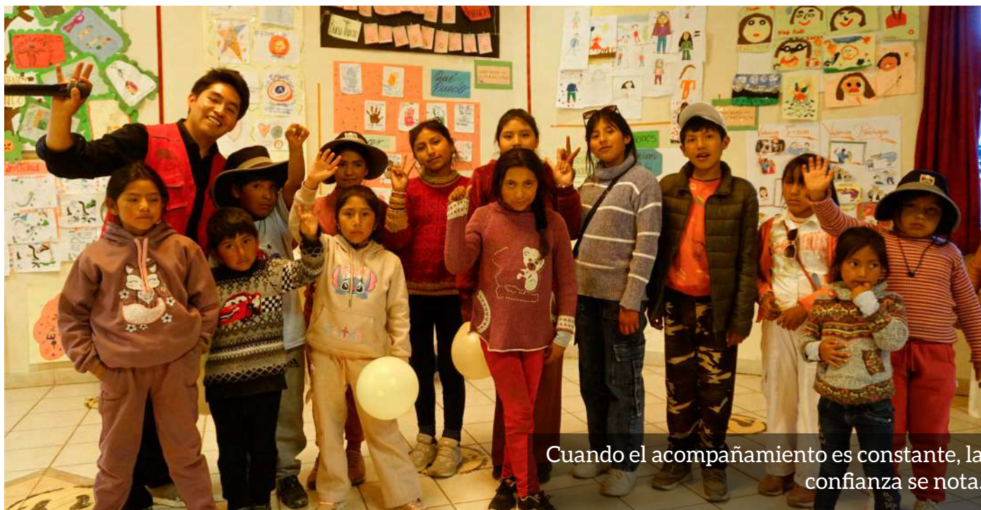
Quando el acompañamiento es constante, la confianza se nota.