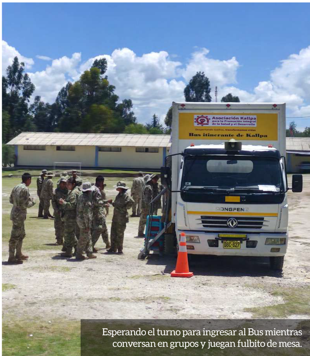
Esperando el turno para ingresar al Bus mientras conversan en grupos y juegan fulbito de mesa.

Cuando el Coronel nos abrió las puertas para trabajar junto a Kallpa, la atmósfera cambió: el brillo en los ojos de los chicos al ver los juegos lúdicos iluminó el patio de armas. Había una sed de alegría, una chispa de inocencia que el régimen no había podido apagar. Recuerdo con especial asombro su apertura y camaradería. Me contaron, con una naturalidad que me dejó sin aliento, sobre