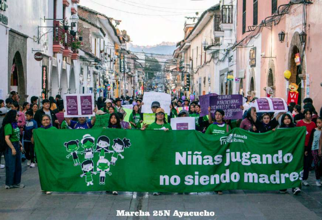
Marcha 25N Ayacucho