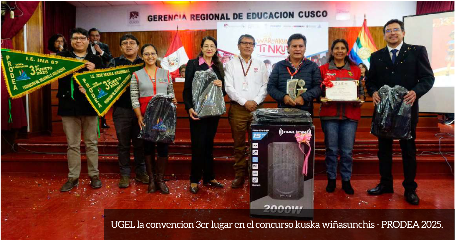
UGEL la convencion 3er lugar en el concurso kуска wiñasunchis - PRODEA 2025.