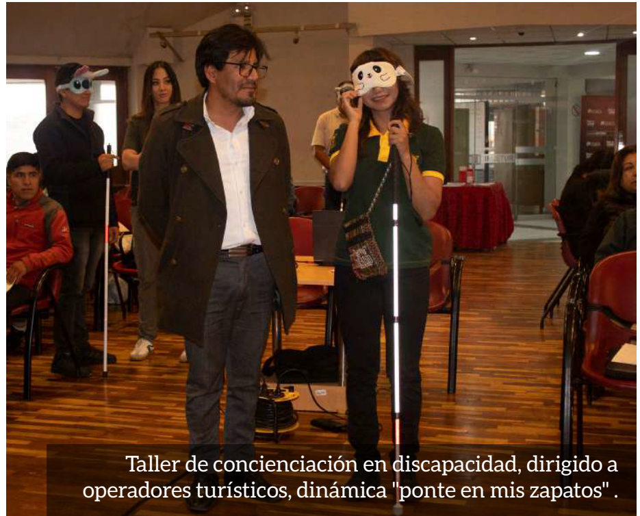
Taller de concienciación en discapacidad, dirigido a operadores turísticos, dinámica "ponte en mis zapatos".

El proyecto deja como principal aprendizaje que el turismo inclusivo no solo es un derecho, sino también una oportunidad para mejorar la calidad, competitividad y sostenibilidad del destino Cusco. Desde Kallpa, se reafirma el compromiso de seguir articulando esfuerzos con instituciones públicas, privadas y de la sociedad civil para consolidar una región más accesible para todas las personas.