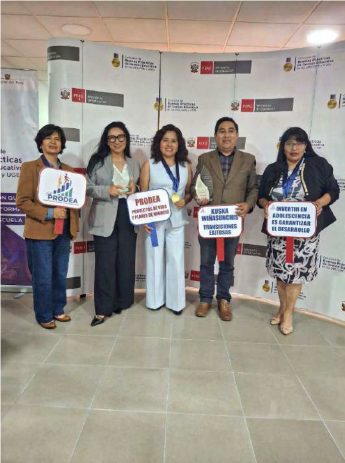
Equipo de la Gerencia Regional de Educación de Cusco y Asociación Kallpa en la premiación del Ministerio de Educación.