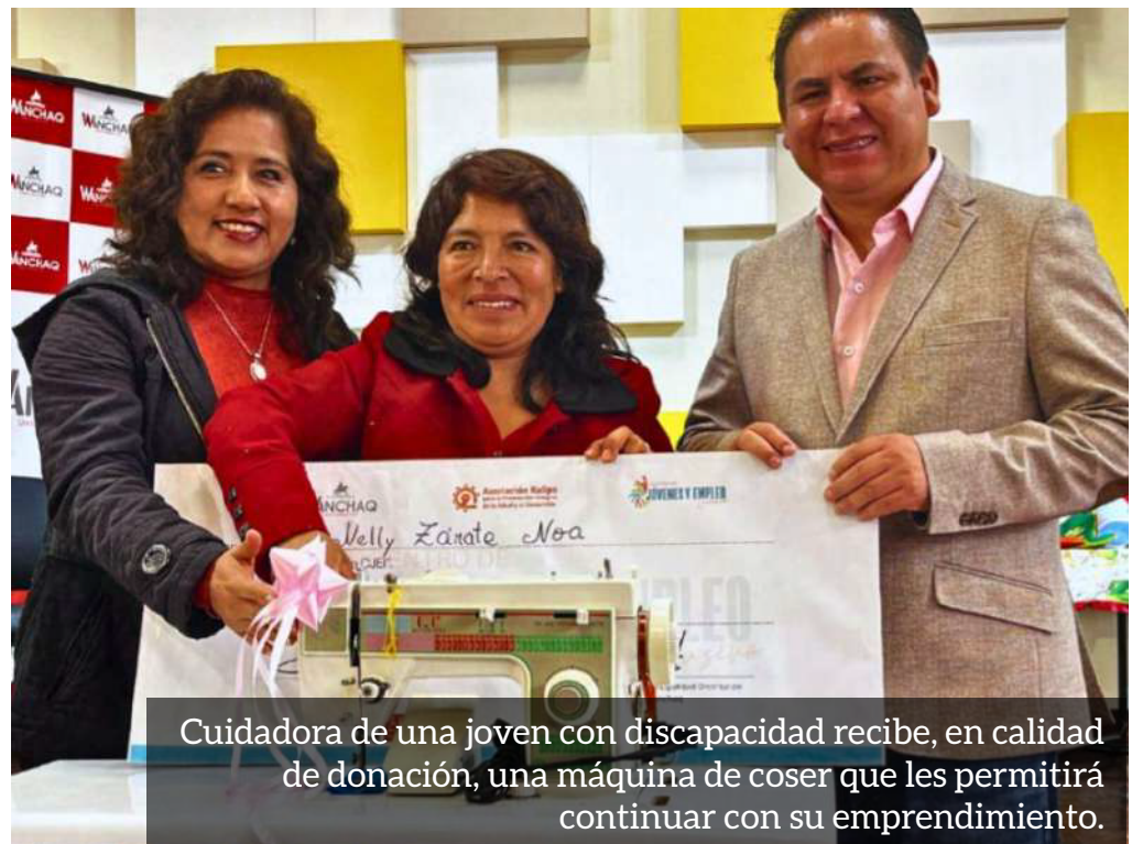
Cuidadora de una joven con discapacidad recibe, en calidad de donación, una máquina de coser que les permitirá continuar con su emprendimiento.