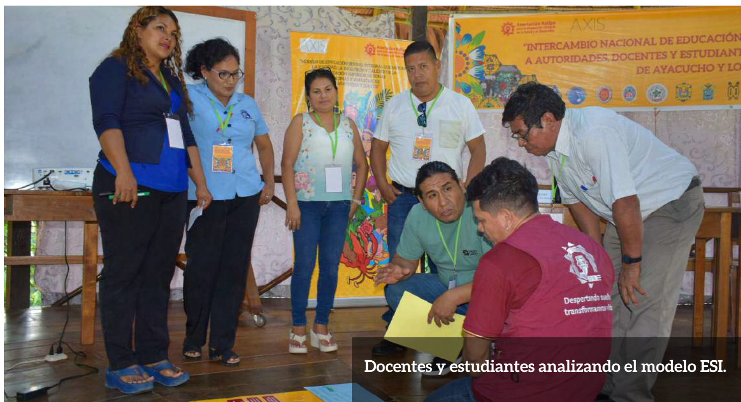
Docentes y estudiantes analizando el modelo ESI.

“Agradecemos a AXIS, cuyo compromiso y acompañamiento estratégico fueron determinantes para el logro de los resultados alcanzados en favor de la Educación Sexual Integral para la Educación Superior”.