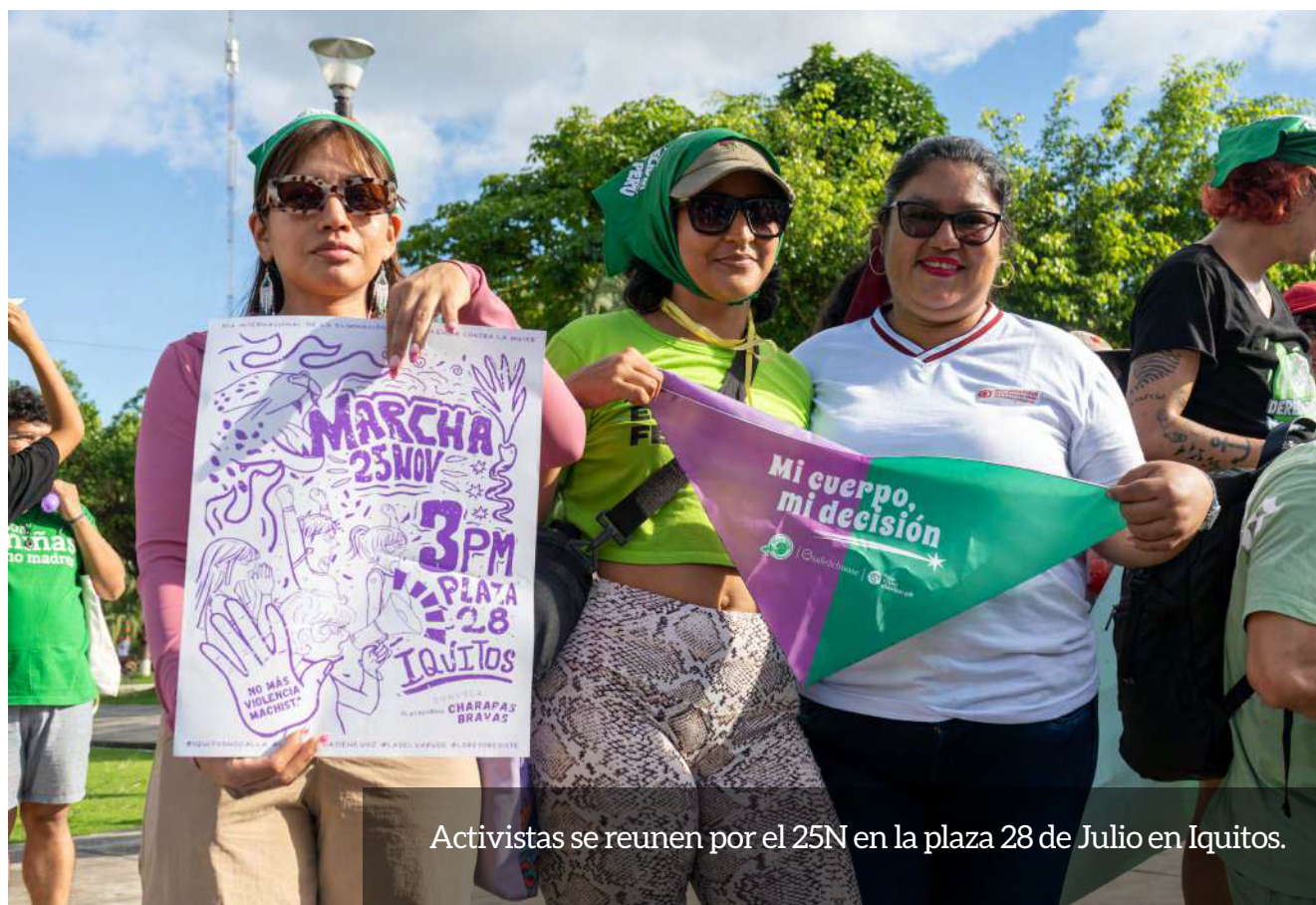
Activistas se reúnen por el 25N en la plaza 28 de Julio en Iquitos.