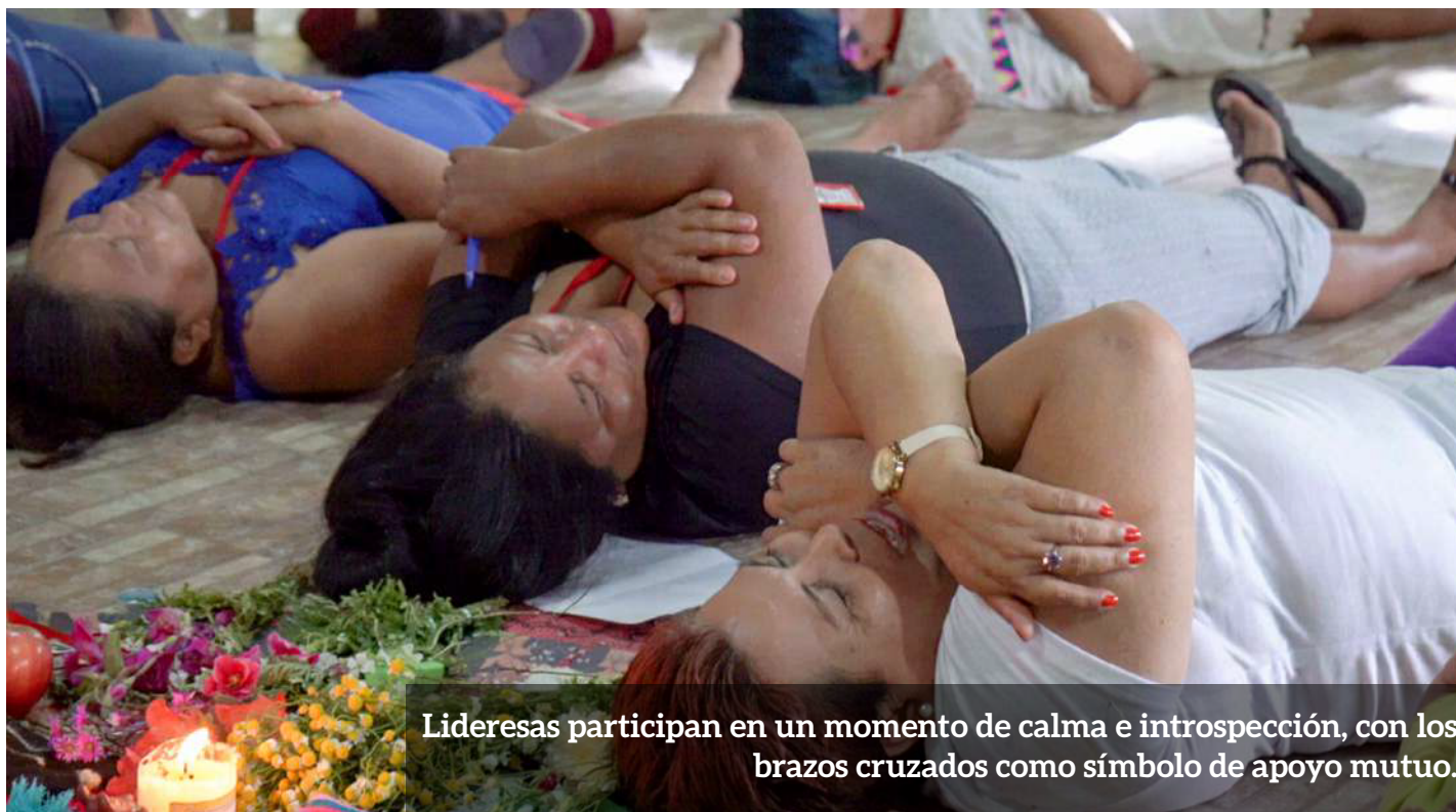
Lideresas participan en un momento de calma e introspección, con los brazos cruzados como símbolo de apoyo mutuo.