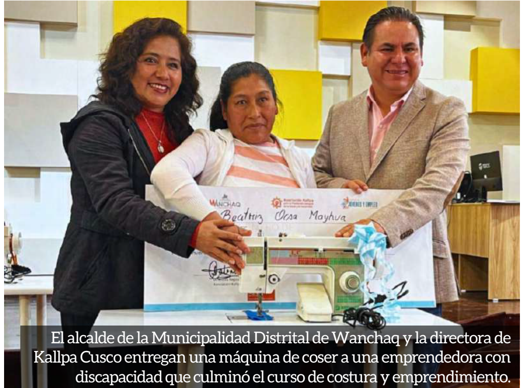
El alcalde de la Municipalidad Distrital de Wanchaq y la directora de Kallpa Cusco entregan una máquina de coser a una emprendedora con discapacidad que culminó el curso de costura y emprendimiento.

Agradecemos a OMAPED Wanchaq por la alianza y el trabajo articulado que permite que más personas alcancen sus metas y sueños, porque cuando una persona se fortalece, crece toda nuestra comunidad.