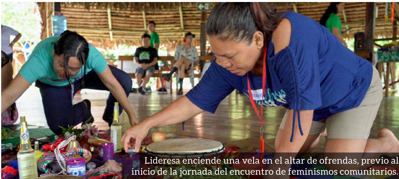
Lideresa enciende una vela en el altar de ofrendas, previo al inicio de la jornada del encuentro de feminismos comunitarios.

Lideresas de la Red Eco de Mujeres fortalecen el cuidado colectivo y la lucha contra la violencia desde sus territorios