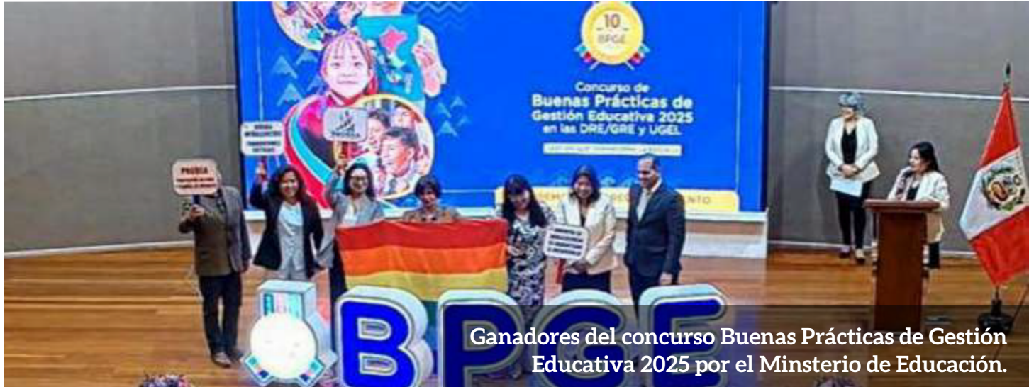
Ganadores del concurso Buenas Prácticas de Gestión Educativa 2025 por el Ministerio de Educación.