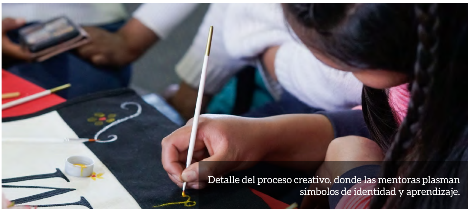
Detalle del proceso creativo, donde las mentoras plasman símbolos de identidad y aprendizaje.

“Más que un acto formal, fue un encuentro íntimo, pues, a través de una actividad creativa, cada mentora personalizó su propia bolsa, convirtiéndola en un lienzo donde plasmaron su historia, su esencia y su forma única de ver la vida”.