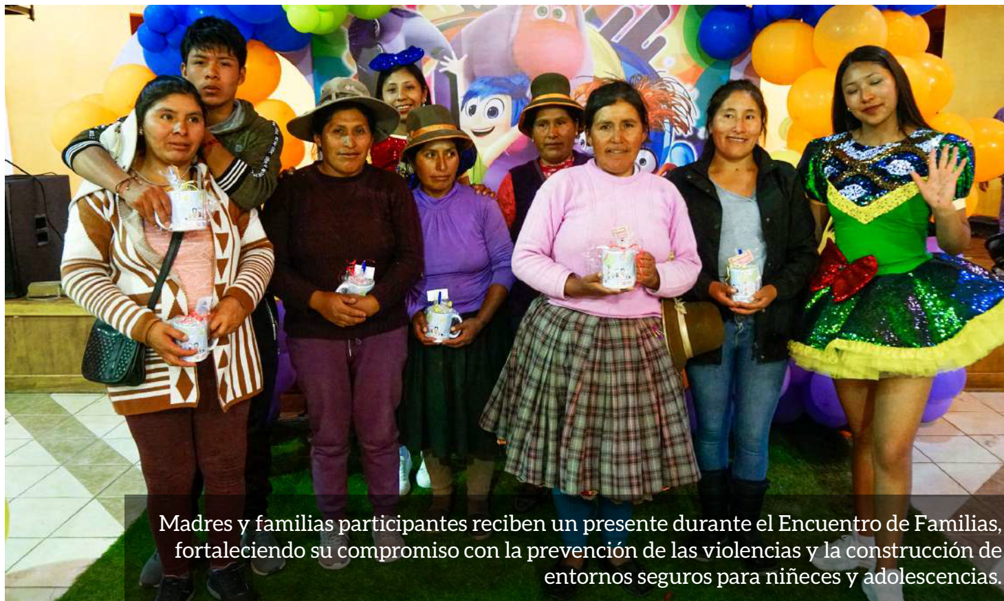
Madres y familias participantes reciben un presente durante el Encuentro de Familias, fortaleciendo su compromiso con la prevención de las violencias y la construcción de entornos seguros para niñas y adolescencias.