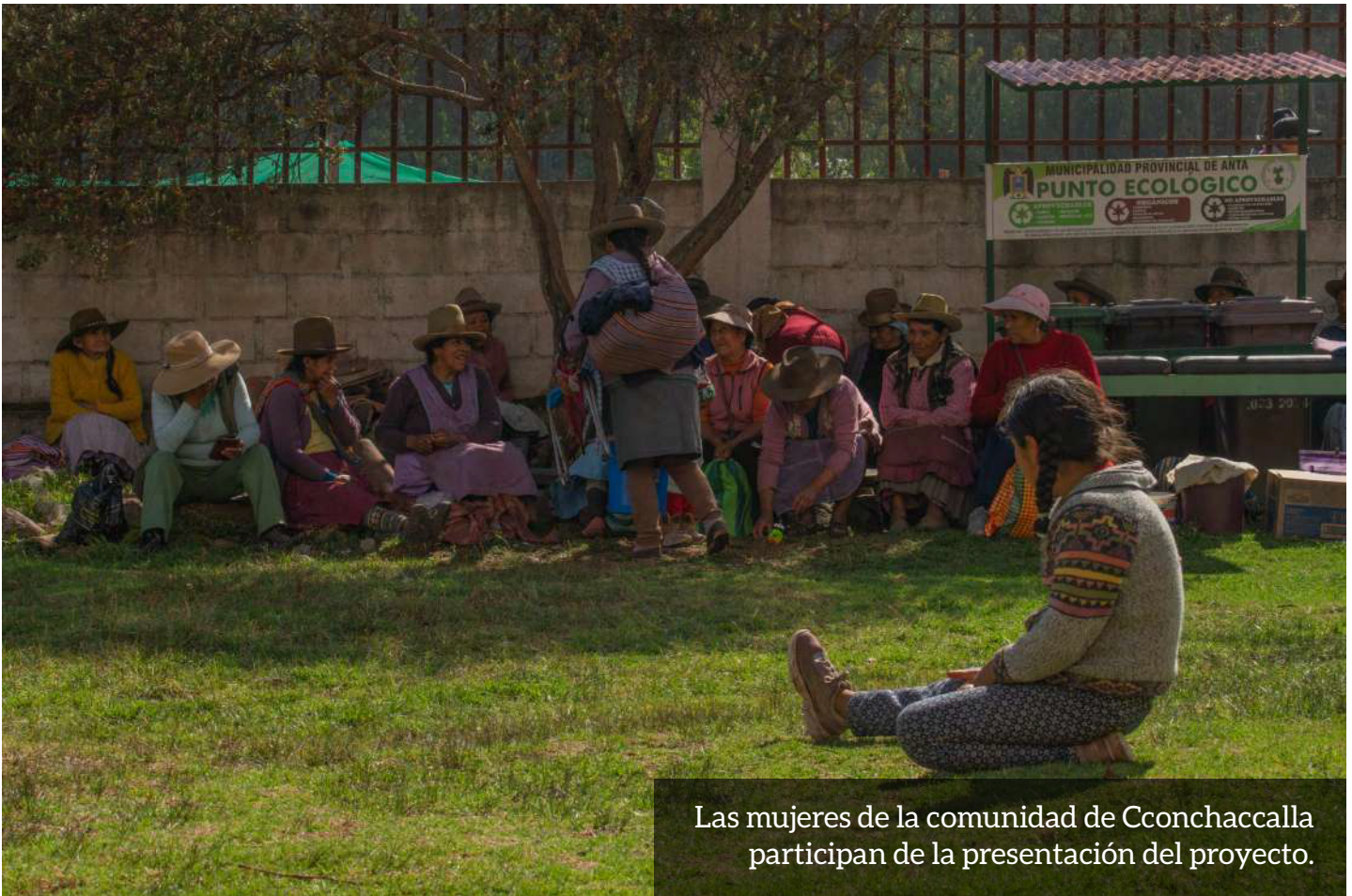
Las mujeres de la comunidad de Cconchaccalla participan de la presentación del proyecto.