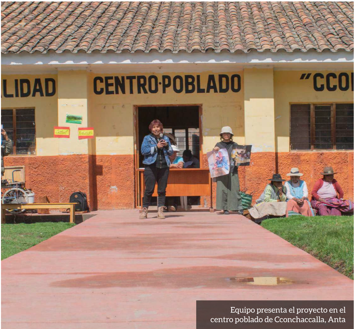
Equipo presenta el proyecto en el centro poblado de Cconchacalla, Anta

busca fomentar espacios de encuentro y acompañamiento, y sentar bases sólidas para que las comunidades vivan más saludables y resilientes, y tengan mayores oportunidades de desarrollo para sus niños y familias.