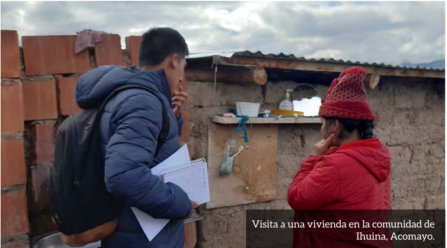
Visita a una vivienda en la comunidad de Ihuina, Acomayo.