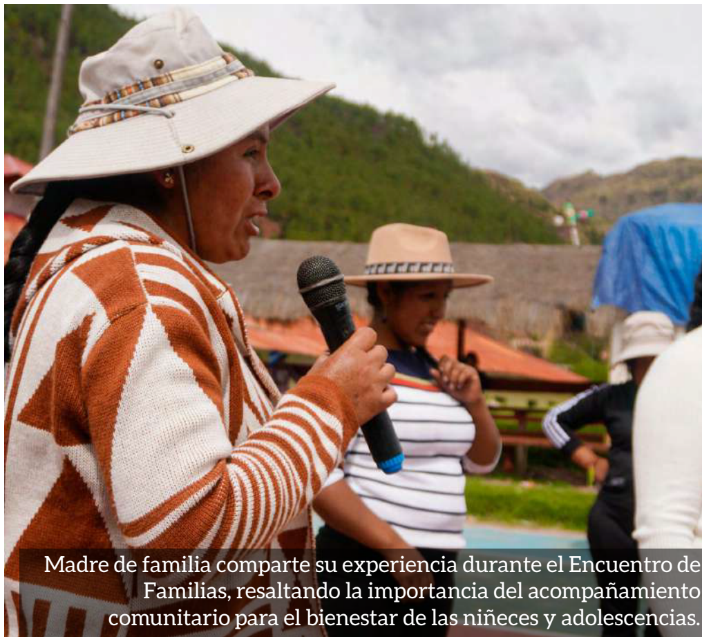
Madre de familia comparte su experiencia durante el Encuentro de Familias, resaltando la importancia del acompañamiento comunitario para el bienestar de las niñas y adolescencias.

Agradecemos la cooperación solidaria de la Liga Española de Educación y Cultura Popular y el financiamiento de la Generalitat Valenciana .