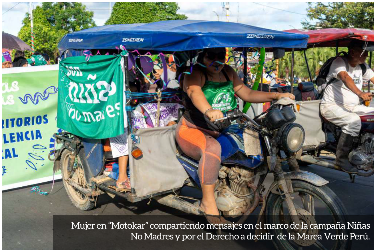
Mujer en "Motokar" compartiendo mensajes en el marco de la campaña Niñas No Madres y por el Derecho a decidir de la Marea Verde Perú.