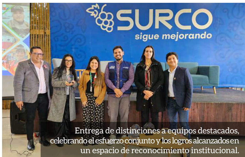
Entrega de distinciones a equipos destacados, celebrando el esfuerzo conjunto y los logros alcanzados en un espacio de reconocimiento institucional.

Desde el equipo Lima, estamos con mucha alegría y satisfacción por los logros que se están cumpliendo y reafirmamos nuestro agradecimiento y compromiso con la Fédération Genevoise de Coopération - FGC y Association Kallpa Genève , por permitirnos seguir despertando sueños y transformando vidas de jóvenes con discapacidad que quieren seguir saliendo adelante.