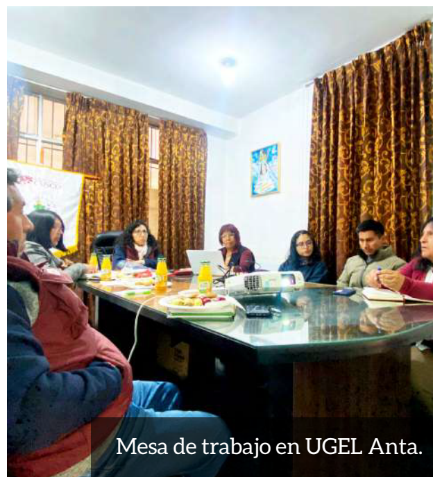
Mesa de trabajo en UGEL Anta.

Nuestras acciones se iniciaron en septiembre de 2025 y se orientan a mejorar los resultados educativos de los niños en etapa primaria , así como a beneficiar a mujeres quechuhablantes con bajo dominio del español mediante la implementación de un programa comunitario de alfabetización. Del mismo modo, el proyecto busca promover prácticas de salud y nutrición entre los miembros de las comunidades para prevenir enfermedades como la anemia y otras transmitidas por el agua o de origen respiratorio. El proyecto tendrá una duración de tres años para atender estos puntos. Con respecto a nuestro primer eje, a la fecha se han realizado talleres de validación de ciertas estrategias educativas en las comunidades, con miras a iniciar el proceso de alfabetización comunitaria de las mujeres. Asimismo, se han llevado a cabo reuniones