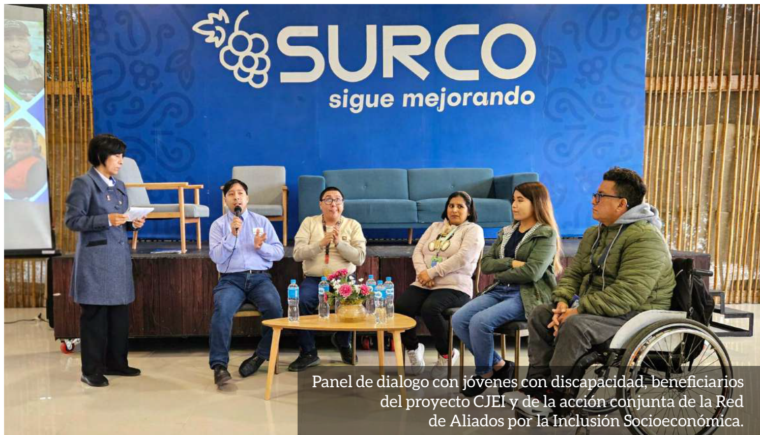
Panel de dialogo con jóvenes con discapacidad, beneficiarios del proyecto CJEI y de la acción conjunta de la Red de Aliados por la Inclusión Socioeconómica.