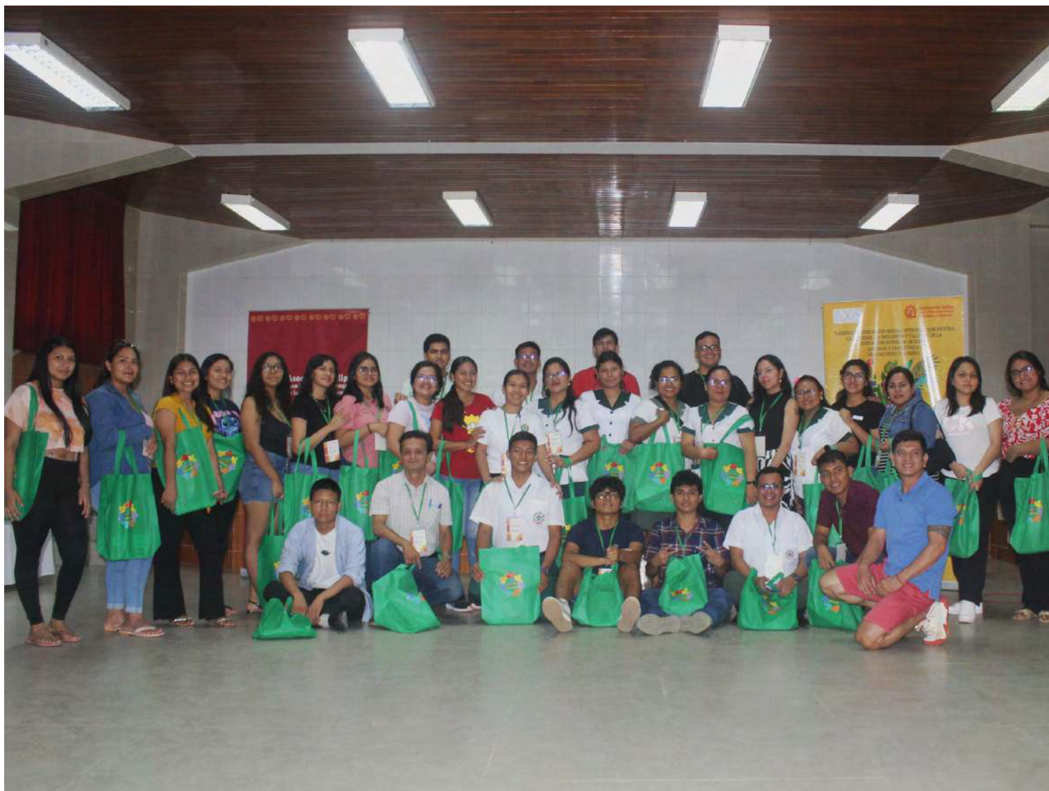
Encuentro de Educación Sexual Integral para Estudiantes de Educación Superior.