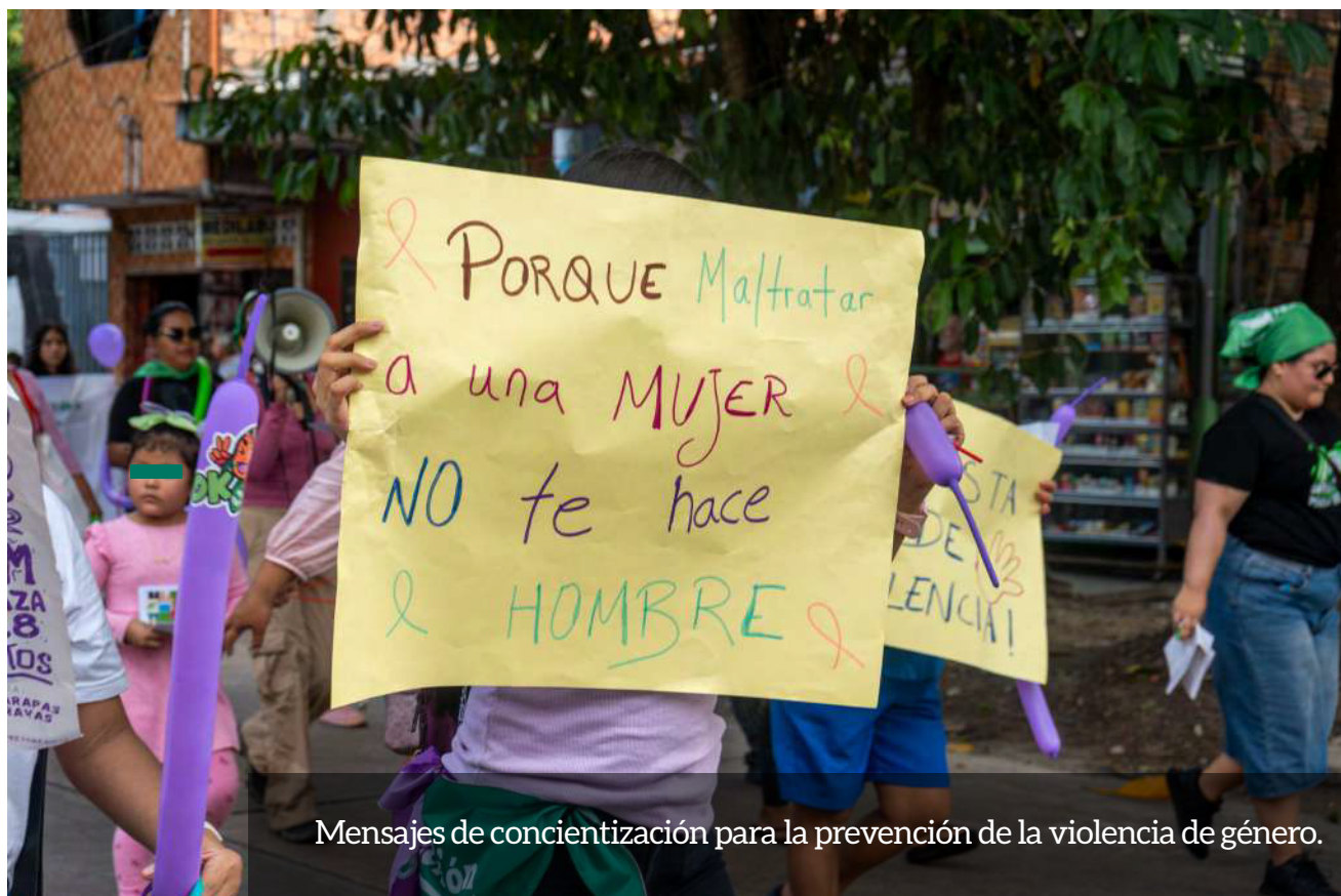
Mensajes de concientización para la prevención de la violencia de género.