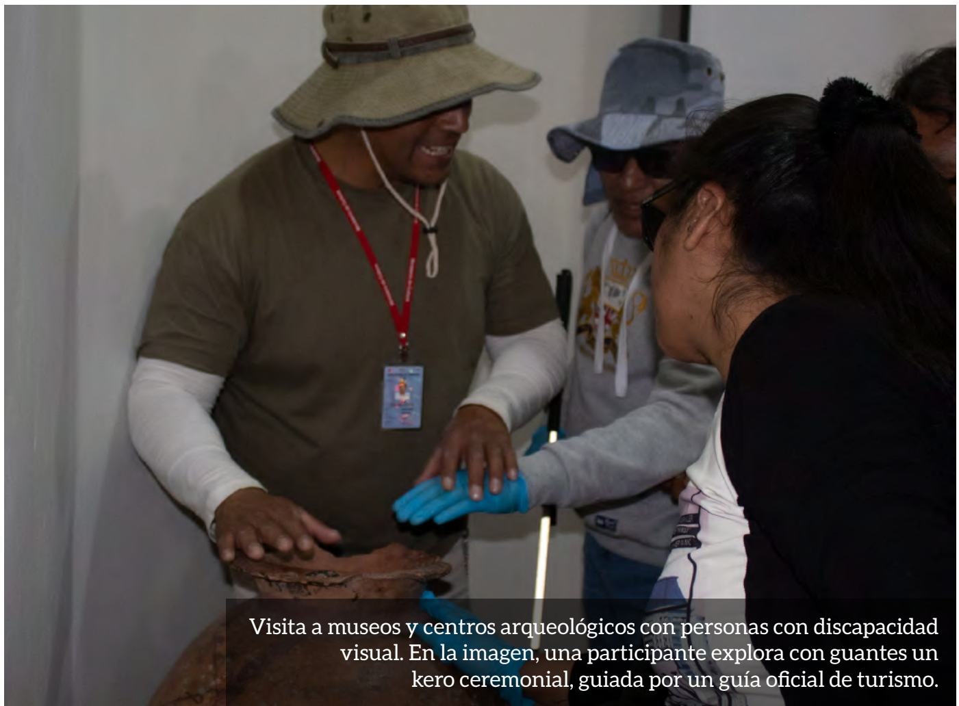
Visita a museos y centros arqueológicos con personas con discapacidad visual. En la imagen, una participante explora con guantes un kero ceremonial, guiada por un guía oficial de turismo.