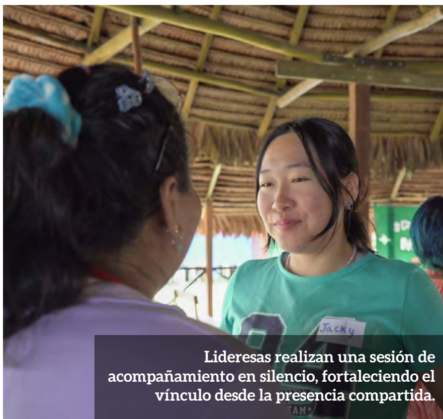
Lideresas realizan una sesión de acompañamiento en silencio, fortaleciendo el vínculo desde la presencia compartida.

“A lo largo del encuentro, las participantes compartieron dinámicas corporales y colectivas que permitieron reconocerse como territorios vivos” .