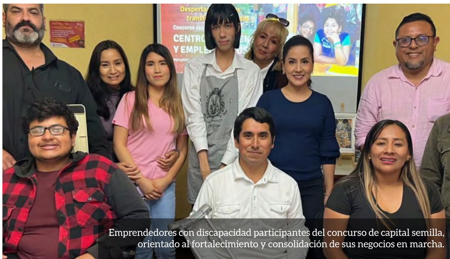
Emprendedores con discapacidad participantes del concurso de capital semilla, orientado al fortalecimiento y consolidación de sus negocios en marcha.