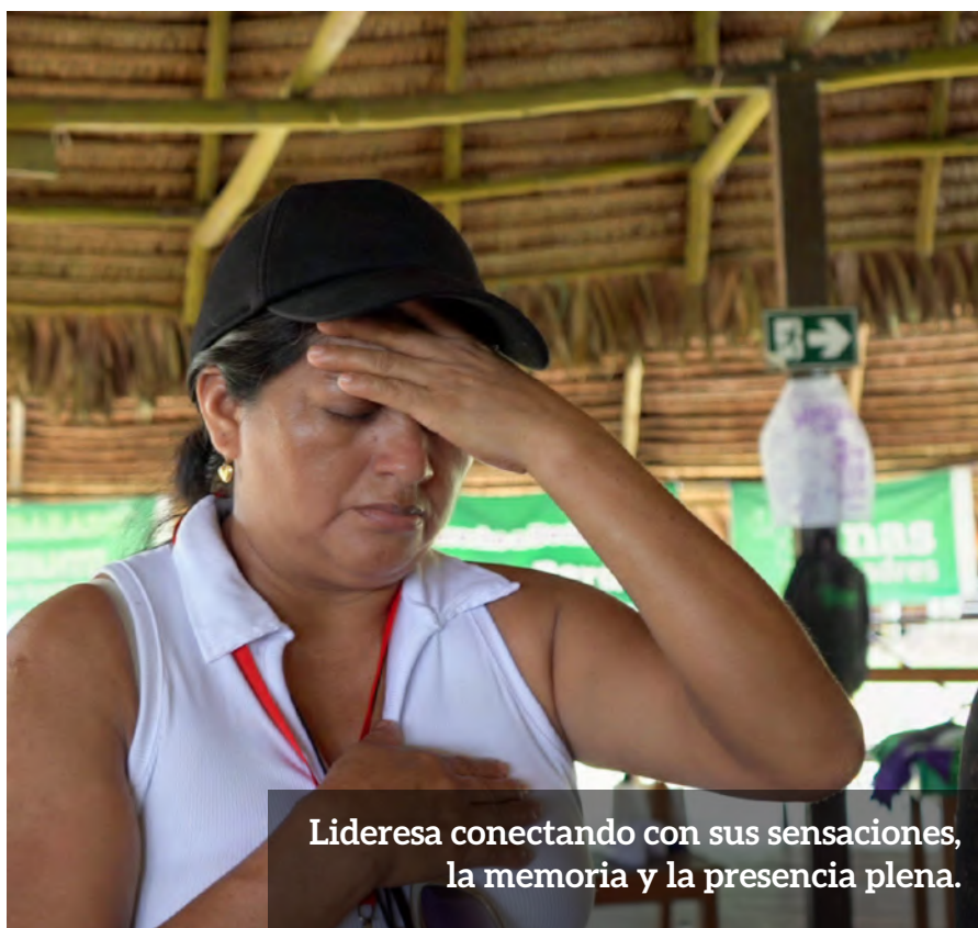
Lideresa conectando con sus sensaciones, la memoria y la presencia plena.