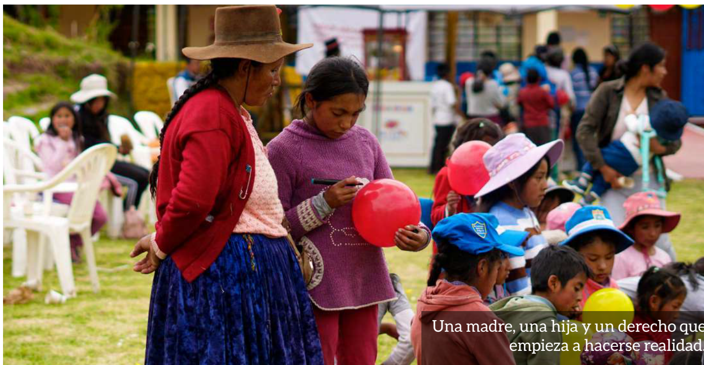
Una madre, una hija y un derecho que empieza a hacerse realidad.