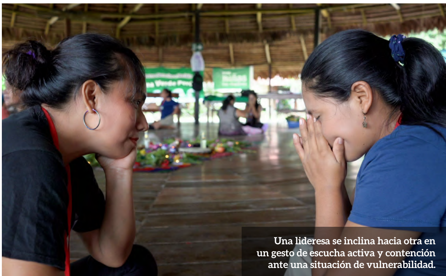
Una lideresa se inclina hacia otra en un gesto de escucha activa y contención ante una situación de vulnerabilidad.