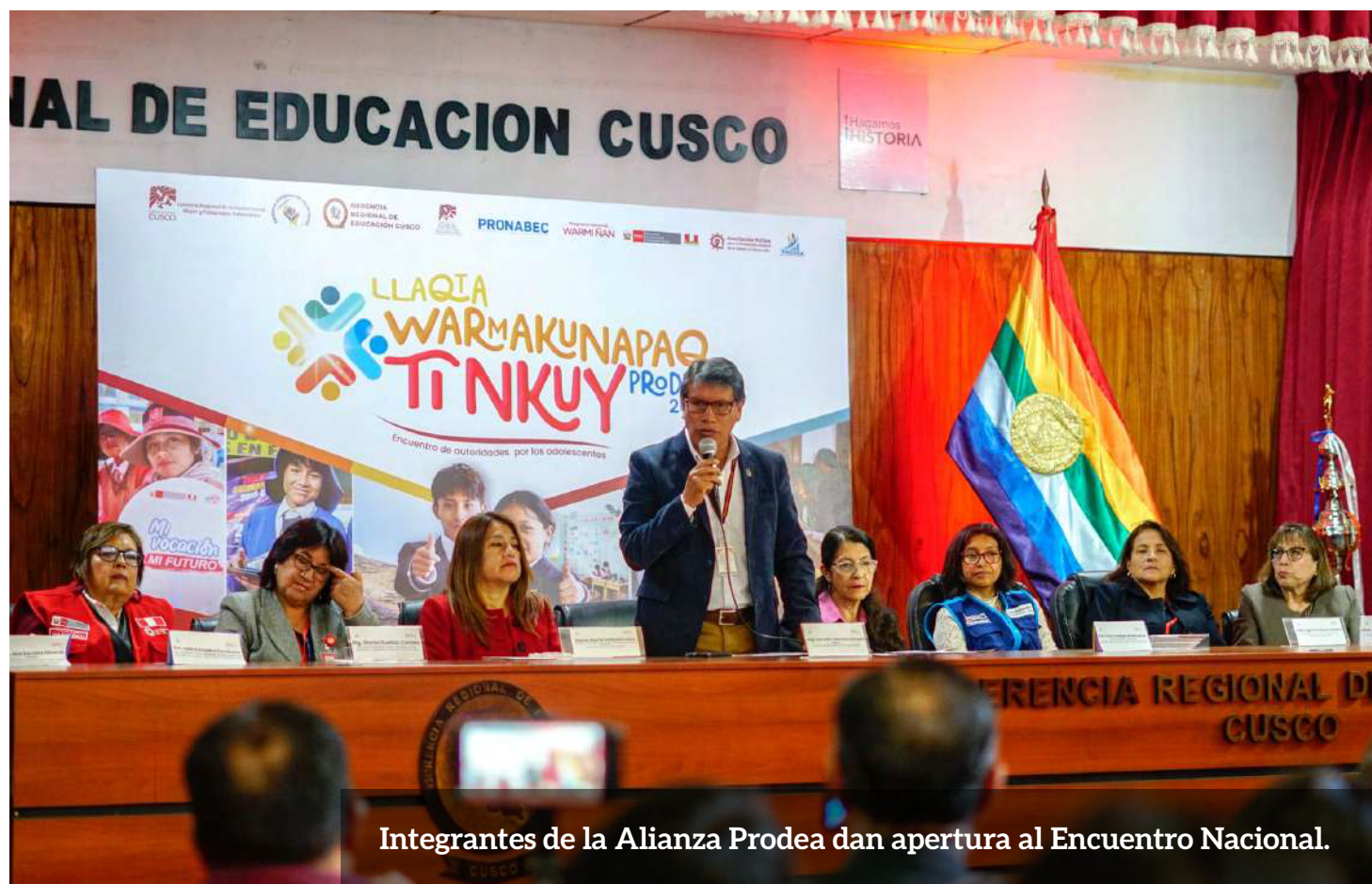
Integrantes de la Alianza Prodea dan apertura al Encuentro Nacional.