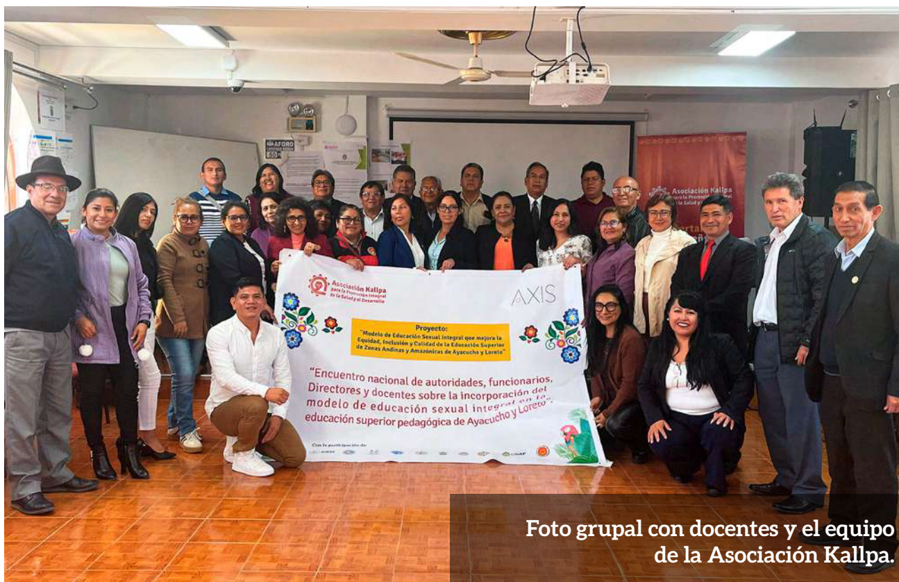
Foto grupal con docentes y el equipo de la Asociación Kallpa.