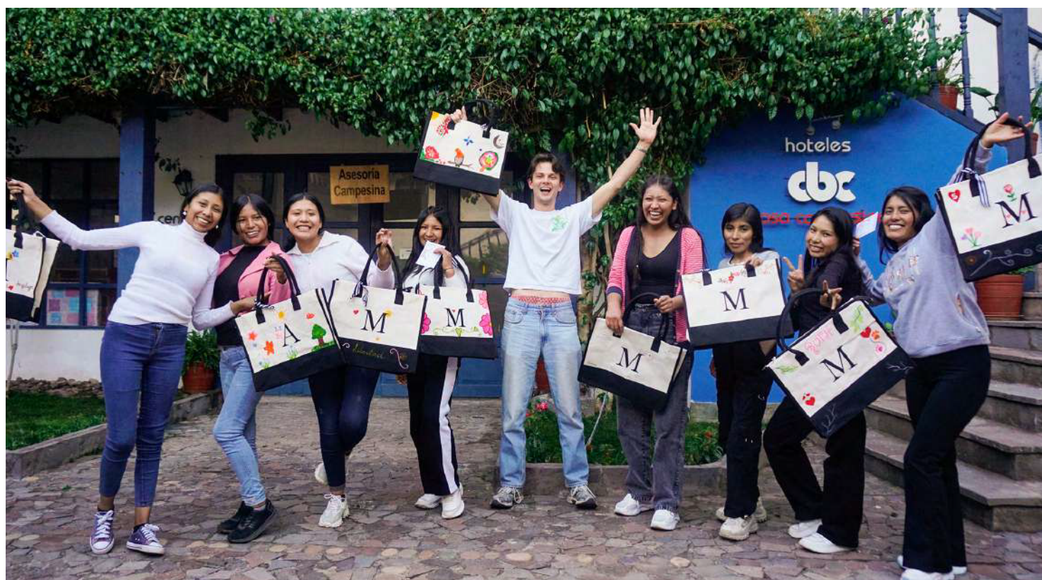
Foto grupal durante la ceremonia de reconocimiento, celebrando el compromiso y el trabajo colectivo de las mentoras.

Agradecemos la cooperación solidaria de la Liga Española de Educación y Cultura Popular y el financiamiento de la Generalitat Valenciana.