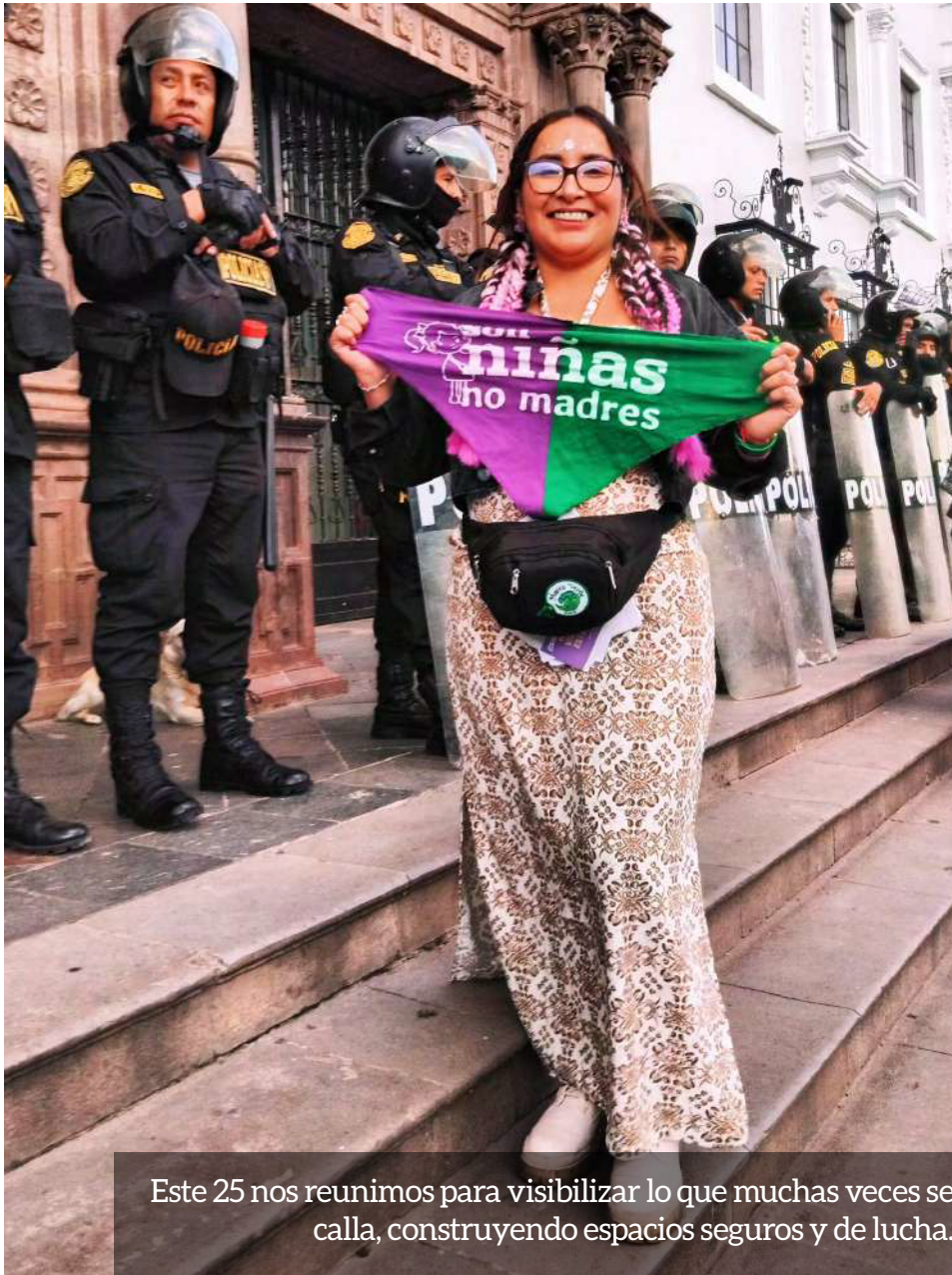
Este 25 nos reunimos para visibilizar lo que muchas veces se calla, construyendo espacios seguros y de lucha.

El proyecto de la Marea Verde Perú llega a su cierre después de años de trabajo sostenido, articulación colectiva y compromiso profundo con la erradicación de la violencia contra las mujeres, niñas y adolescentes. Sin embargo, la Marea Verde Perú sigue viva y activa; siempre ha sido más que solo una serie de acciones: significa un espacio seguro de encuentro, organización y respuesta frente a una realidad que sigue exigiendo justicia. Un espacio que se ha replicado y sigue creciendo con más fuerza, liderado por sus jóvenes activistas.