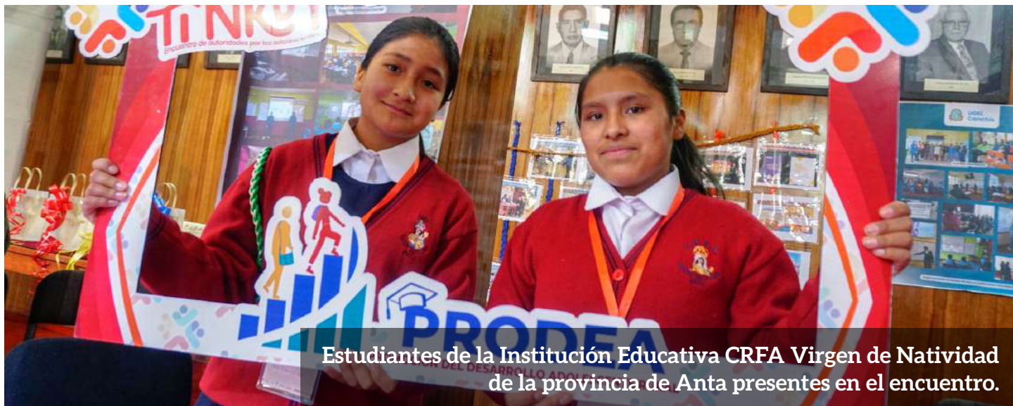
Estudiantes de la Institución Educativa CRFA Virgen de Natividad de la provincia de Anta presentes en el encuentro.