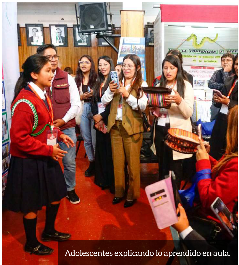
Adolescentes explicando lo aprendido en aula.

“La feria permitió visibilizar buenas prácticas, promover el intercambio de experiencias y motivar a otros territorios a continuar fortaleciendo una gestión educativa articulada”.