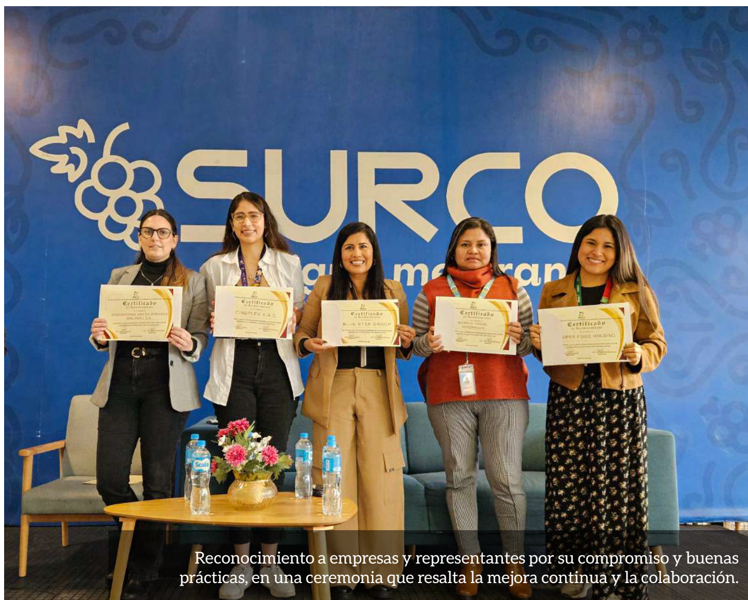
Reconocimiento a empresas y representantes por su compromiso y buenas prácticas, en una ceremonia que resalta la mejora continua y la colaboración.