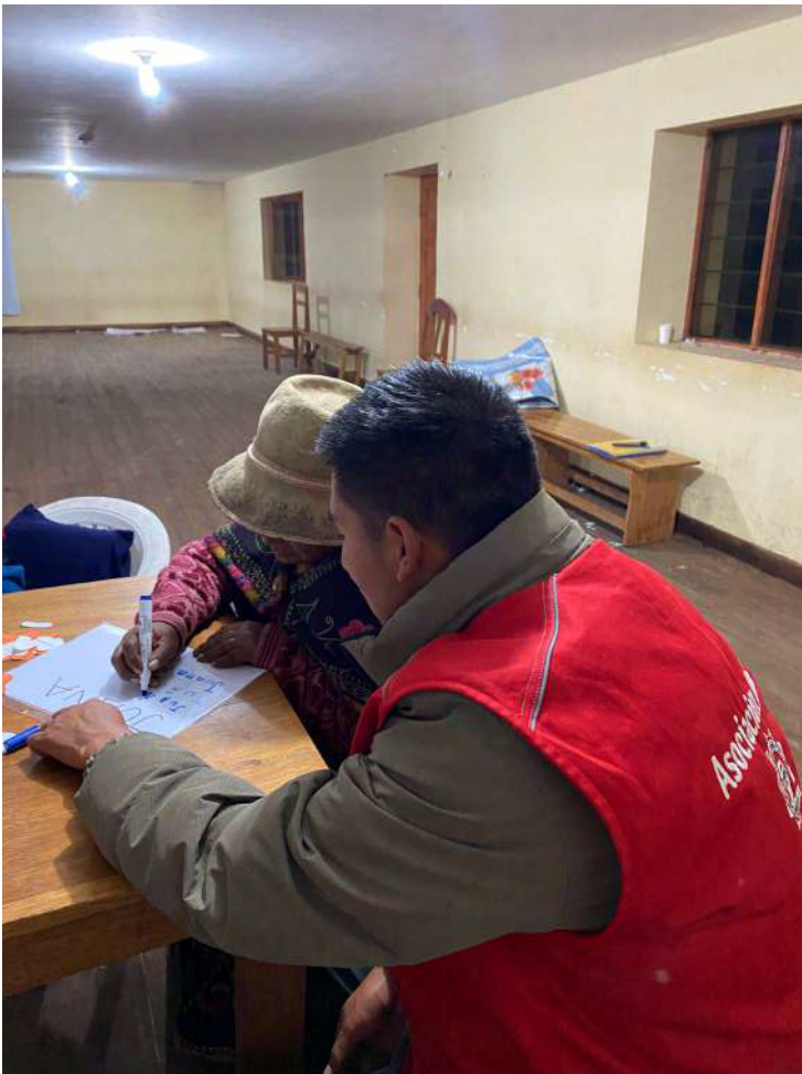
Paso a paso, la alfabetización tardía va dando sus frutos.