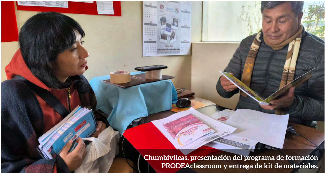
Chumbivilcas, presentación del programa de formación PRODEAclassroom y entrega de kit de materiales.