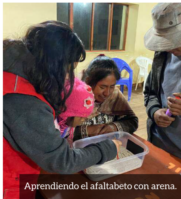
Aprendiendo el alfabeto con arena.