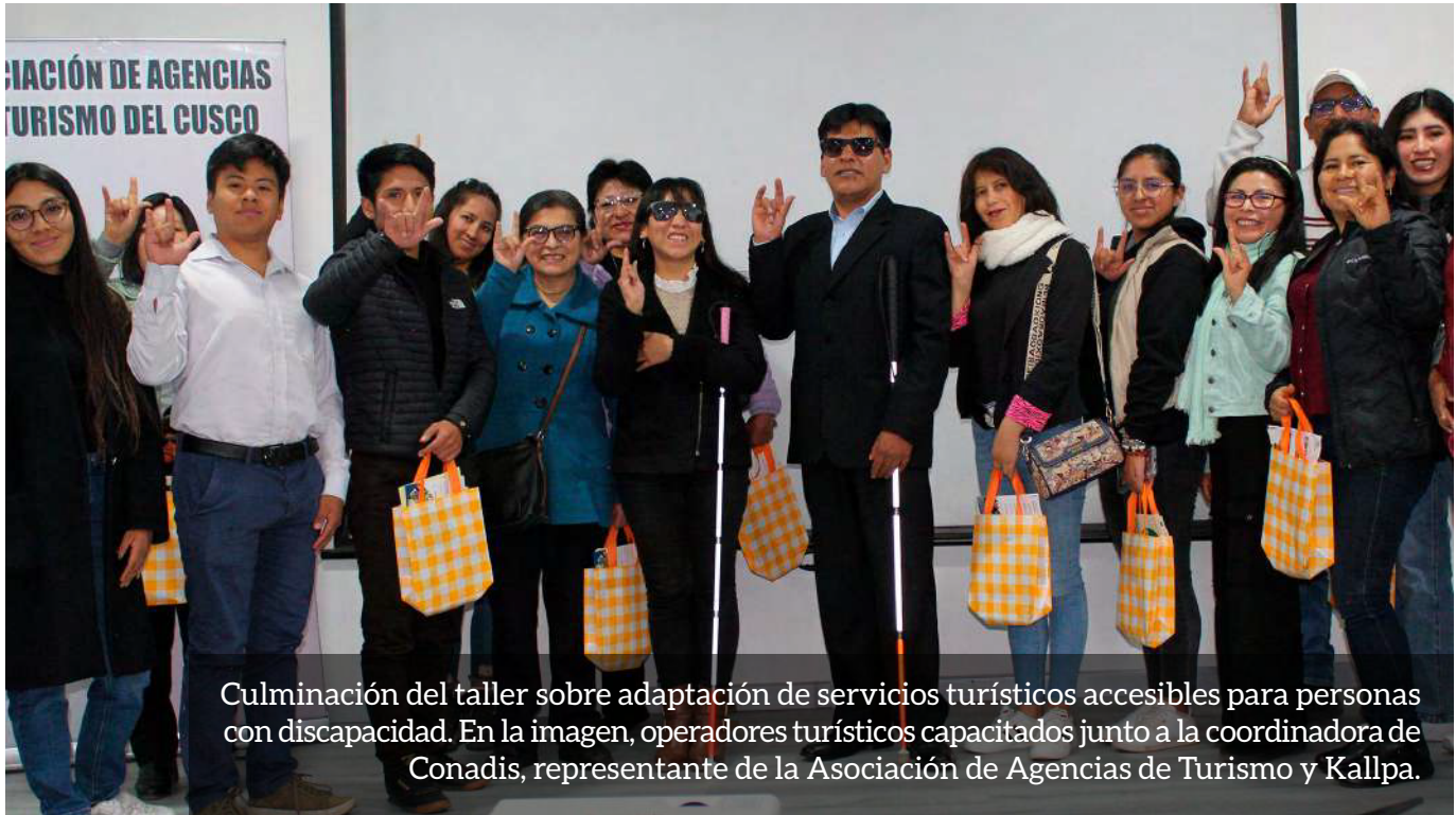
Culminación del taller sobre adaptación de servicios turísticos accesibles para personas con discapacidad. En la imagen, operadores turísticos capacitados junto a la coordinadora de Conadis, representante de la Asociación de Agencias de Turismo y Kallpa.