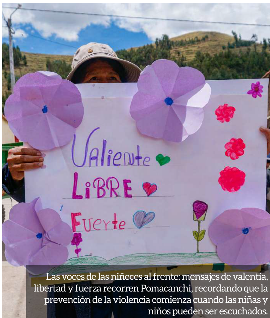
Las voces de las niñas al frente: mensajes de valentía, libertad y fuerza recorren Pomacanchi, recordando que la prevención de la violencia comienza cuando las niñas y niños pueden ser escuchados.

Desde Kallpa, reafirmamos nuestro compromiso de seguir impulsando acciones de incidencia que rompan el silencio, cuestionen las violencias normalizadas y promuevan una cultura de respeto, igualdad y protección, convencidas y convencidos de que prevenir la violencia es una responsabilidad compartida y un paso indispensable para garantizar niñas y adolescencias sin discriminación ni miedo.