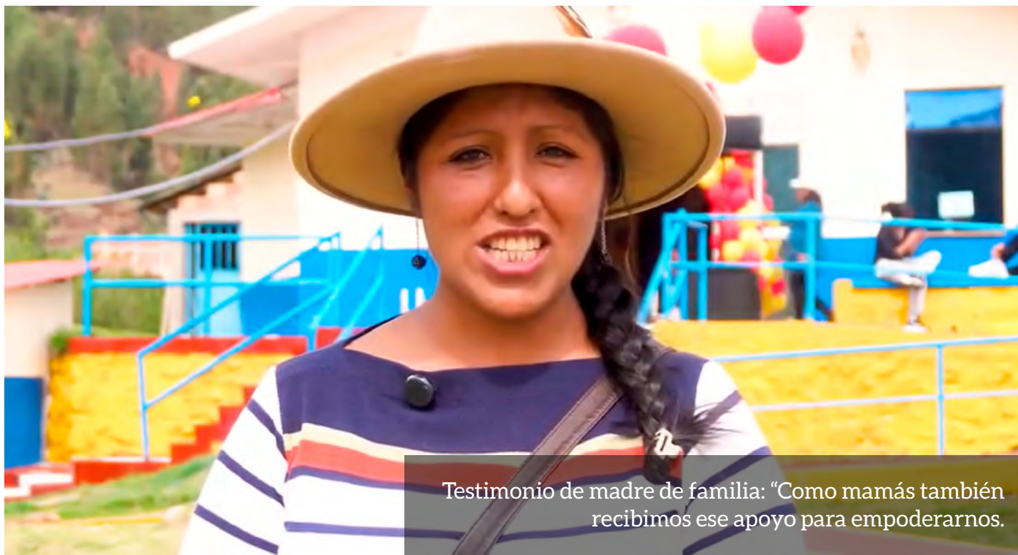
Testimonio de madre de familia: “Como mamás también recibimos ese apoyo para empoderarnos.