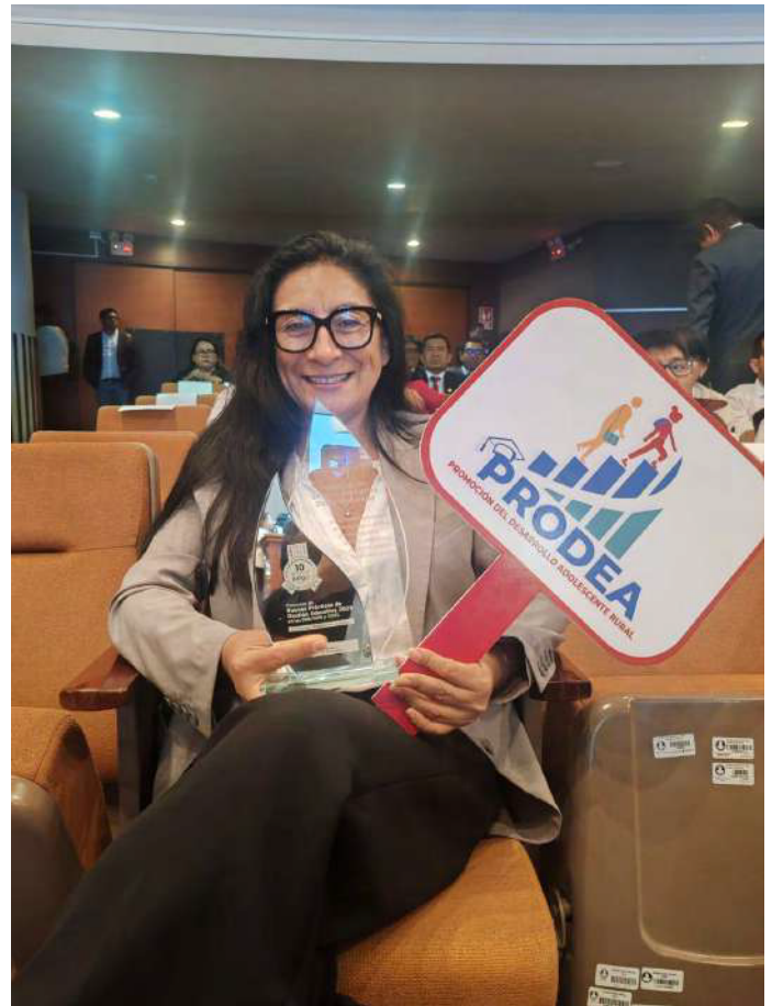
Asociación Kallpa parte de la alianza PRODEA con la placa de reconocimiento.