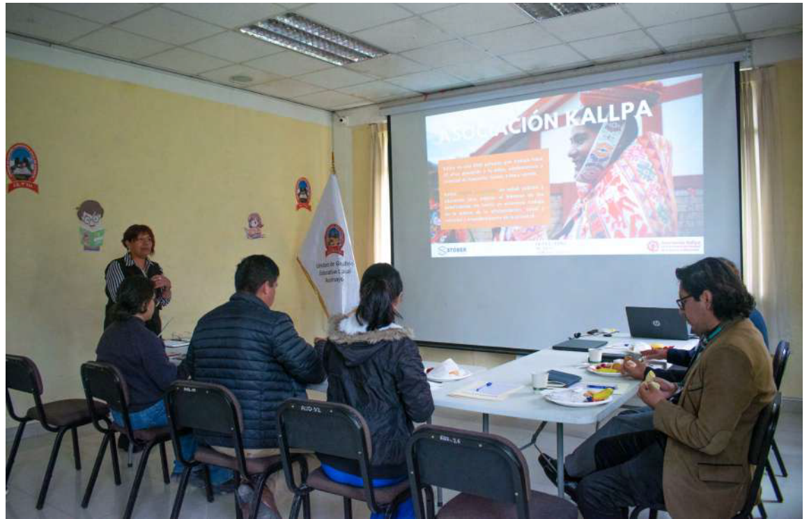
Mesa de trabajo en UGEL Acomayo.