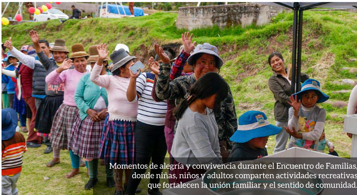
Momentos de alegría y convivencia durante el Encuentro de Familias, donde niñas, niños y adultos comparten actividades recreativas que fortalecen la unión familiar y el sentido de comunidad.