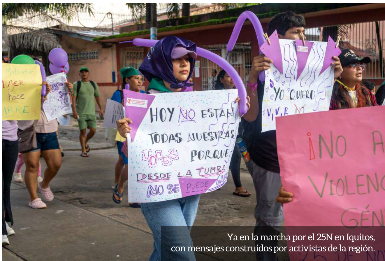
Ya en la marcha por el 25N en Iquitos, con mensajes construidos por activistas de la región.