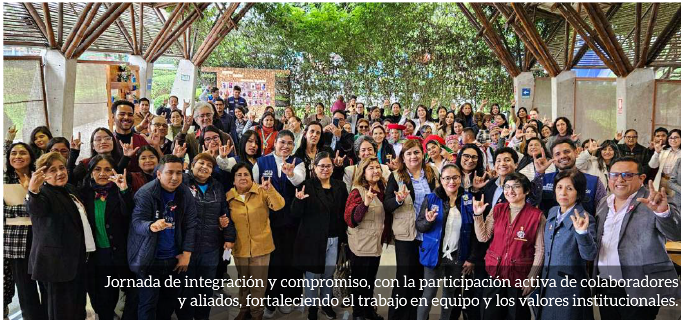
Jornada de integración y compromiso, con la participación activa de colaboradores y aliados, fortaleciendo el trabajo en equipo y los valores institucionales.