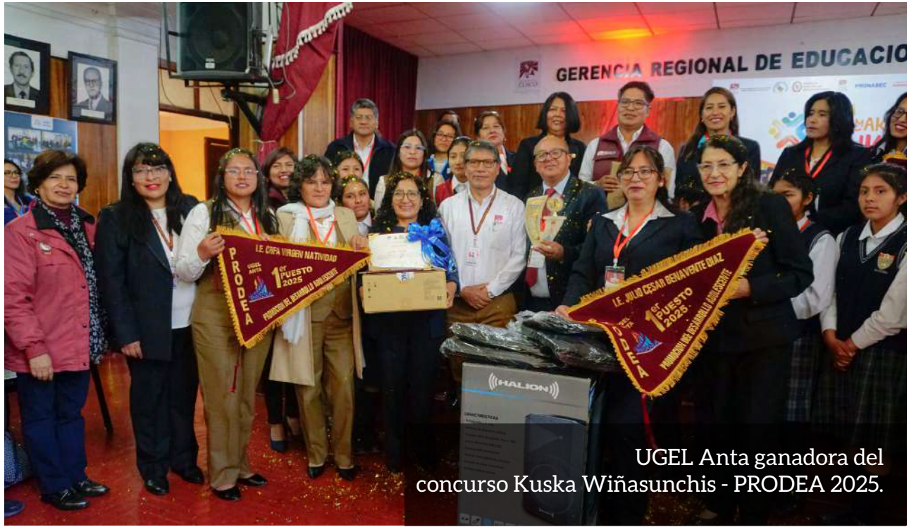
UGEL Anta ganadora del concurso Kuska Wiñasunchis - PRODEA 2025.