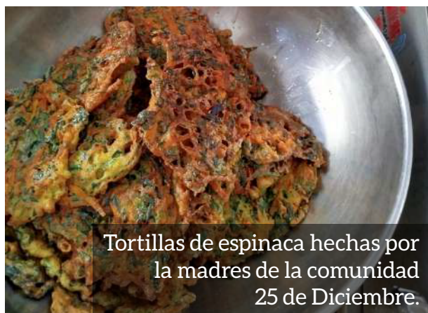
Tortillas de espinaca hechas por la madres de la comunidad 25 de Diciembre.

“Hacemos pequeños orificios poco profundos y sembramos las plantitas, dejando espacio entre ellas para que