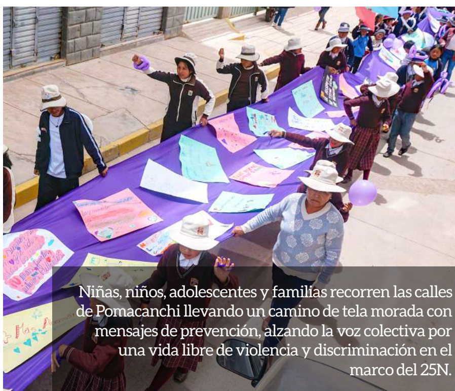
Niñas, niños, adolescentes y familias recorren las calles de Pomacanchi llevando un camino de tela morada con mensajes de prevención, alzando la voz colectiva por una vida libre de violencia y discriminación en el marco del 25N.

Agradecemos la cooperación solidaria de la Liga Española de Educación y Cultura Popular y el financiamiento de la Generalitat Valenciana.