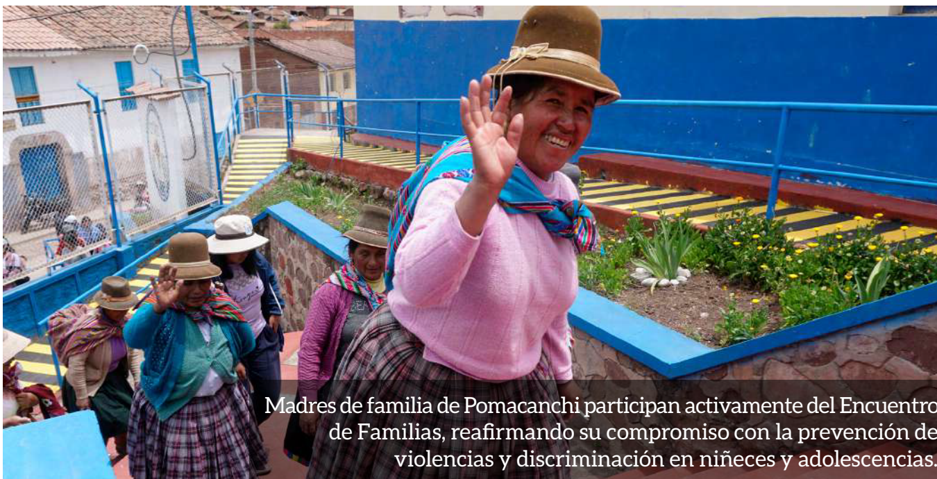
Madres de familia de Pomacanchi participan activamente del Encuentro de Familias, reafirmando su compromiso con la prevención de violencias y discriminación en niñeces y adolescencias.