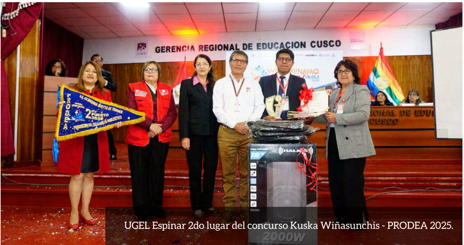
UGEL Espinar 2do lugar del concurso Kуска Wiñasunchis - PRODEA 2025.