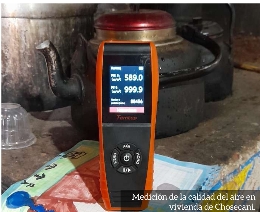
Medición de la calidad del aire en vivienda de Chosecani.