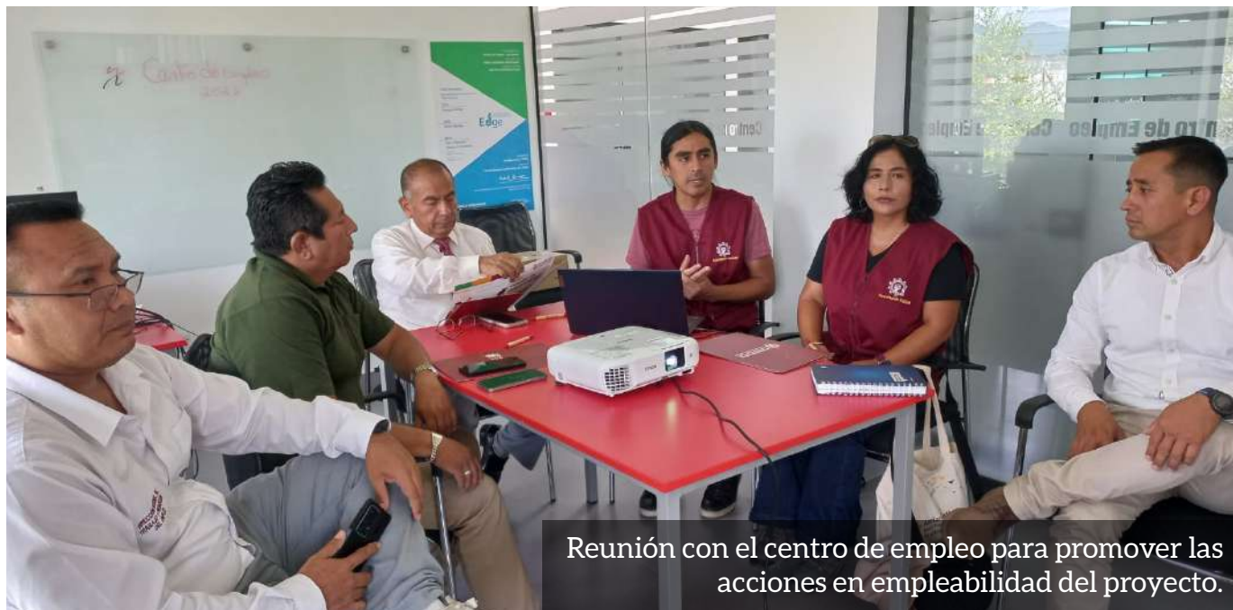
Reunión con el centro de empleo para promover las acciones en empleabilidad del proyecto.