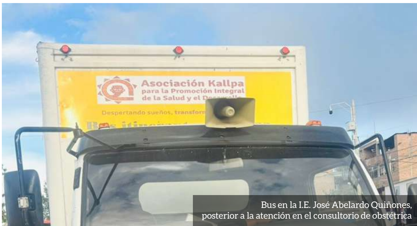
Bus en la I.E. José Abelardo Quiñones, posterior a la atención en el consultorio de obstétrica