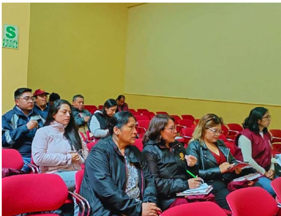
Funcionarios de la Municipalidad asistiendo al taller de cuota laboral.