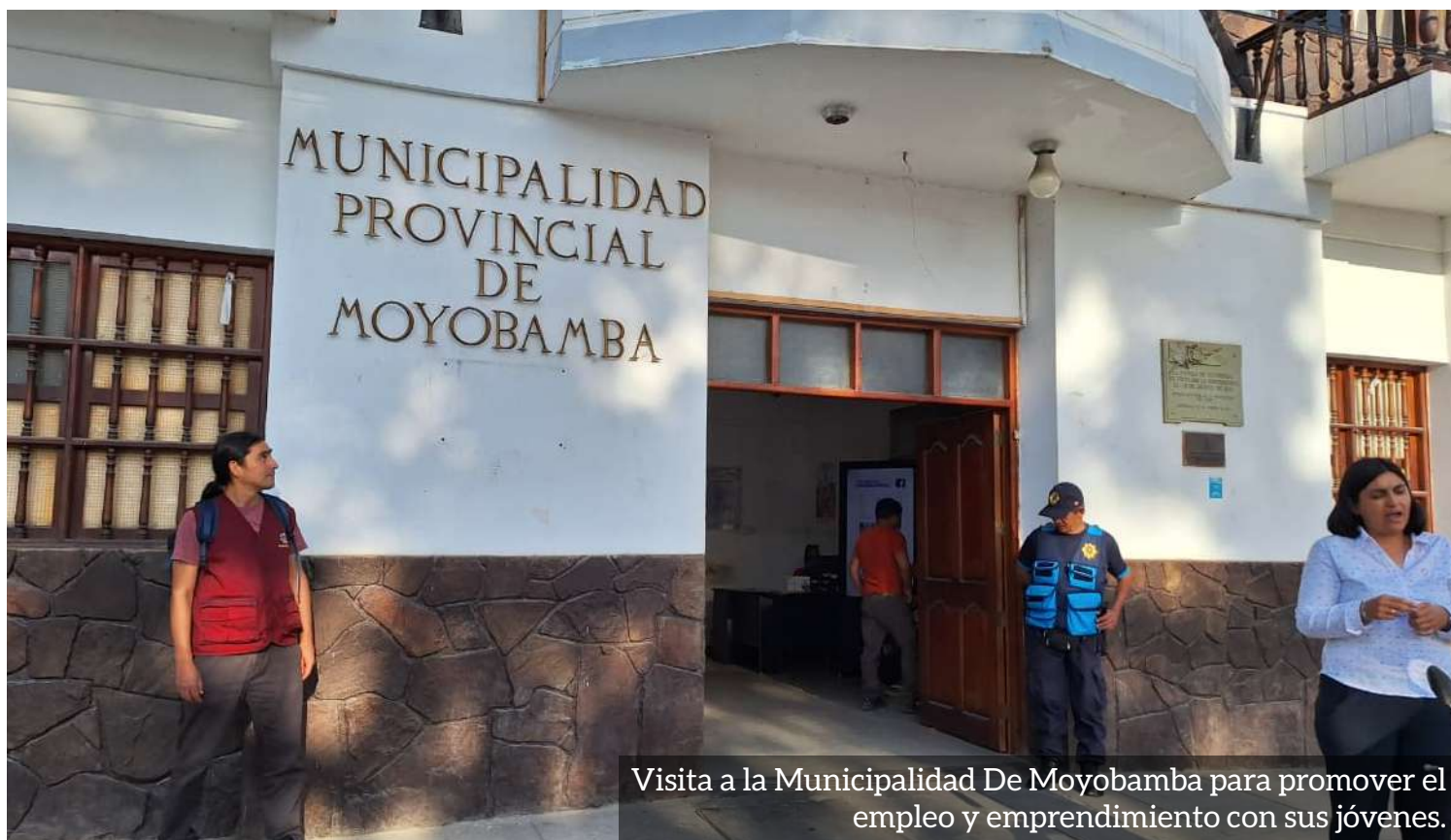
Visita a la Municipalidad De Moyobamba para promover el empleo y emprendimiento con sus jóvenes.