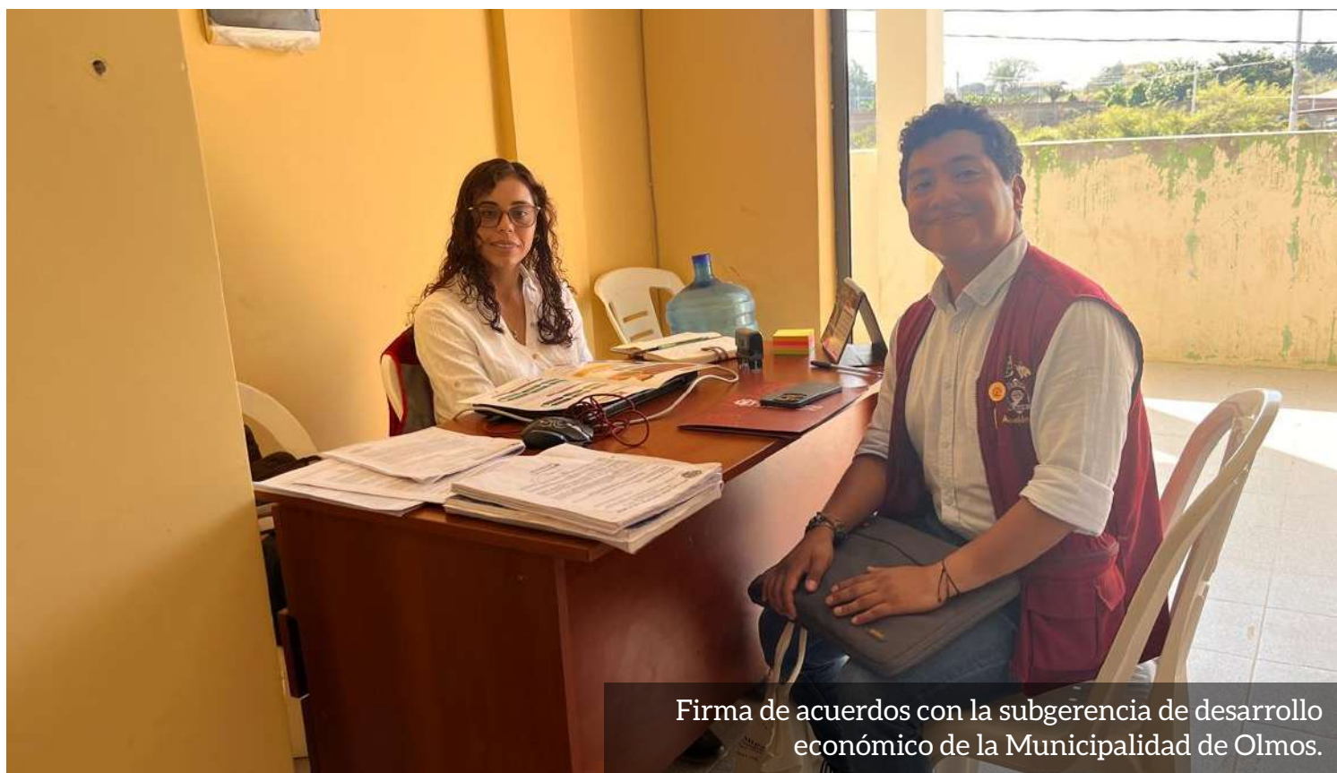
Firma de acuerdos con la subgerencia de desarrollo económico de la Municipalidad de Olmos.