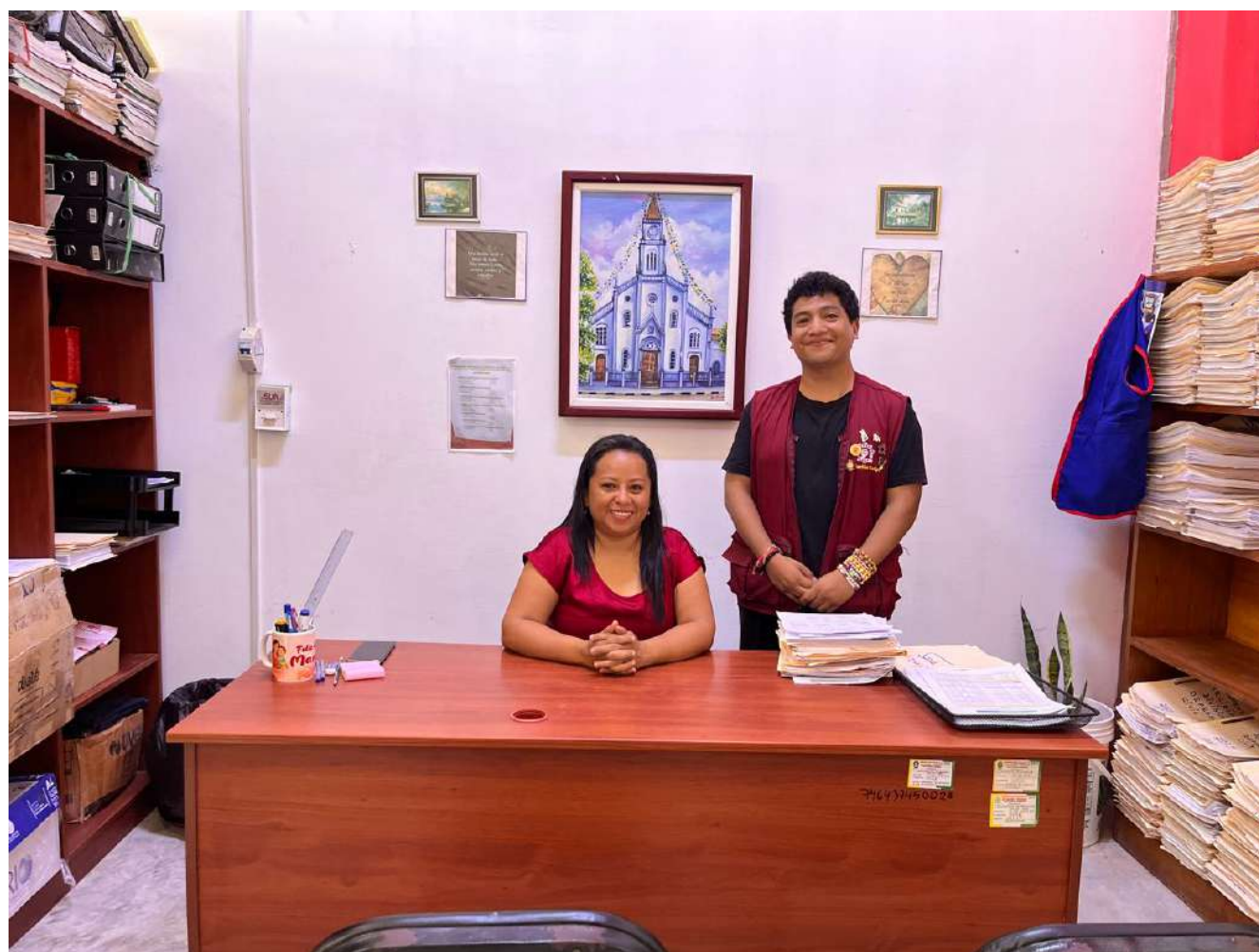
Reunión con representantes del centro de empleo de la región de San Martín.