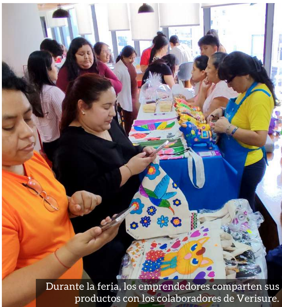
Durante la feria, los emprendedores comparten sus productos con los colaboradores de Verisure.

Desde el equipo Lima, expresamos nuestra alegría y satisfacción por los logros alcanzados y reafirmamos nuestro agradecimiento y compromiso con la Fédération Genevoise de Coopération - FGC y la Association Kallpa Genève, por permitirnos seguir despertando sueños y transformando las vidas de jóvenes con discapacidad que desean seguir saliendo adelante.