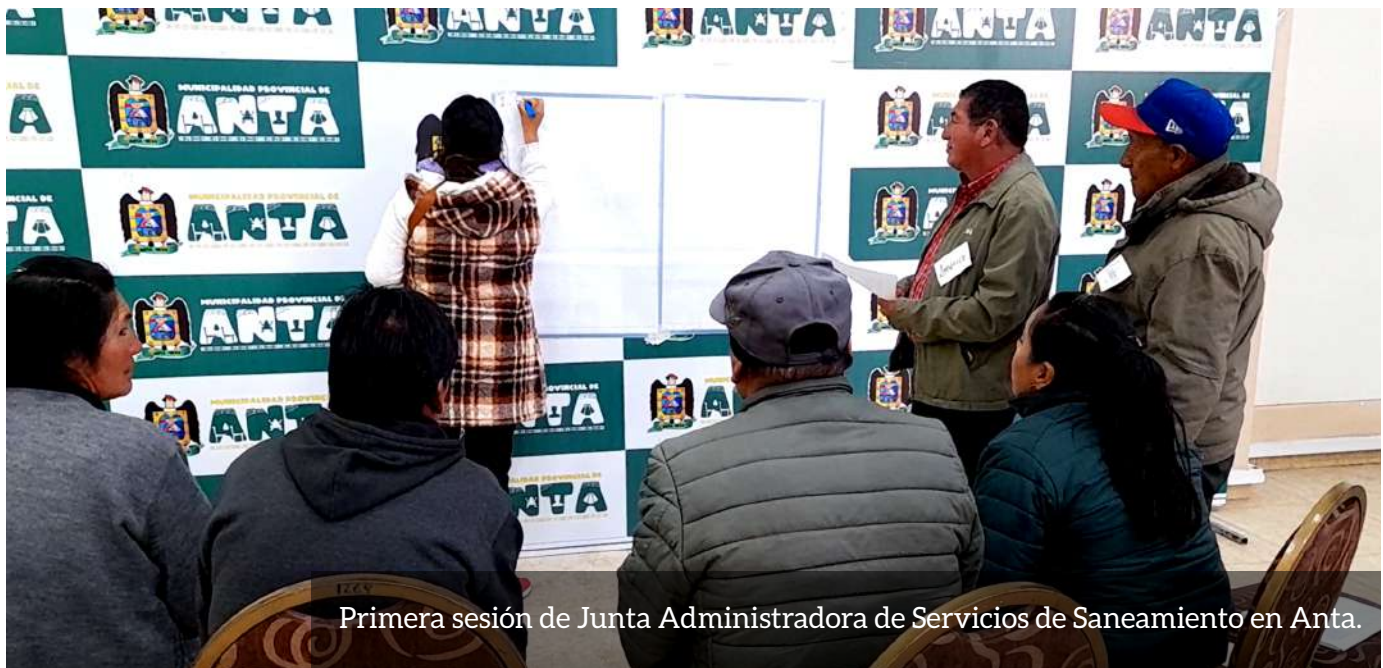
Primera sesión de Junta Administradora de Servicios de Saneamiento en Anta.

Asimismo, sabemos que un desempeño escolar óptimo depende de una alimentación sana y nutritiva. No obstante, identificamos que el aporte alimentario que reciben nuestras escuelas este año cuenta con un solo insumo proteico: el atún enlatado. Con miras a generar un mayor impacto en la nutrición de las niñas y los niños, a fines de marzo estrechamos lazos con el Programa de Alimentación Escolar (PAE)