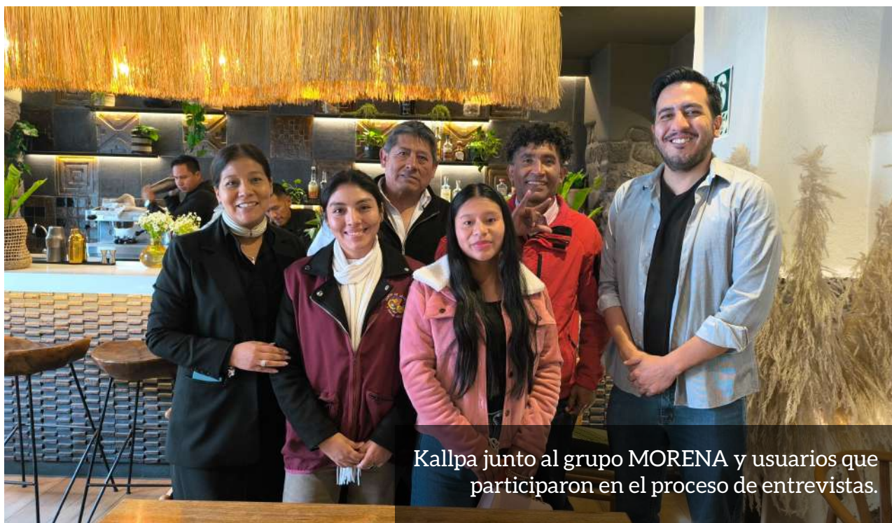
Kallpa junto al grupo MORENA y usuarios que participaron en el proceso de entrevistas.