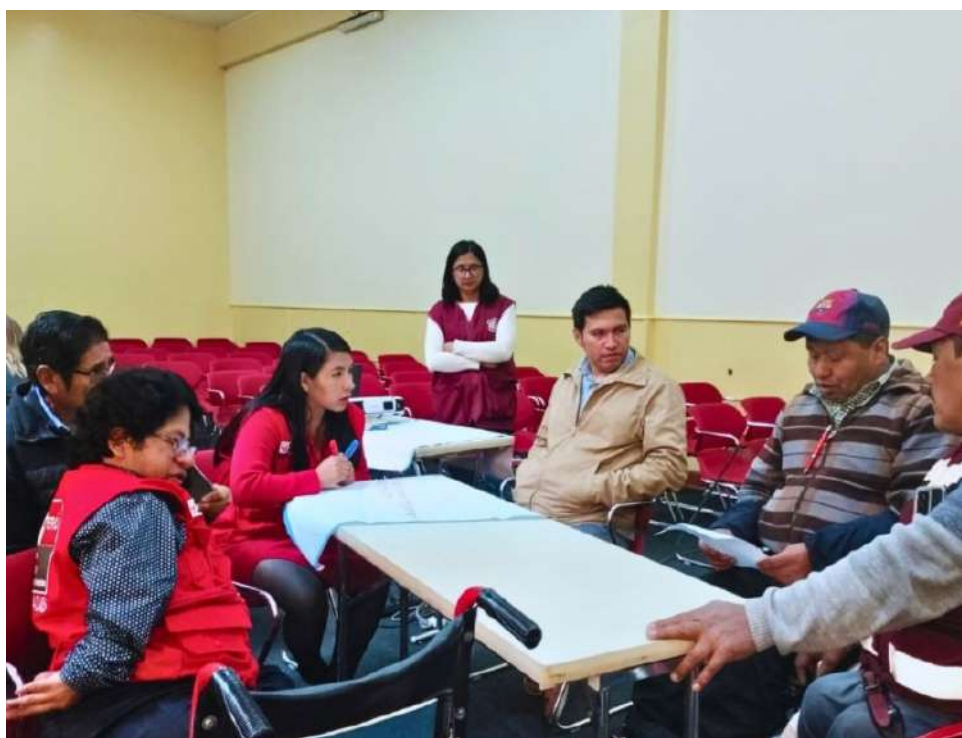
Equipo Kallpa facilitando el taller de ajustes razonables en el trabajo con personas con discapacidad.