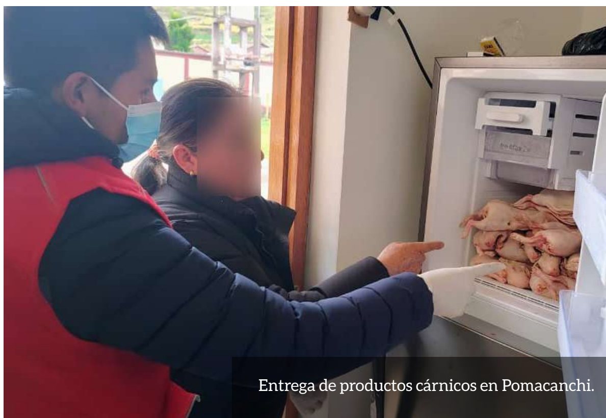
Entrega de productos cárnicos en Pomacanchi.