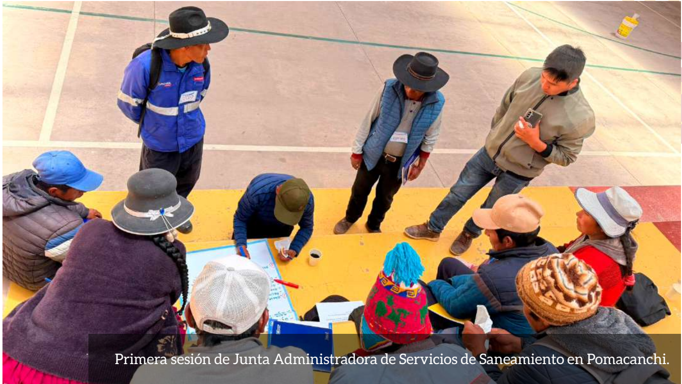
Primera sesión de Junta Administradora de Servicios de Saneamiento en Pomacanchi.