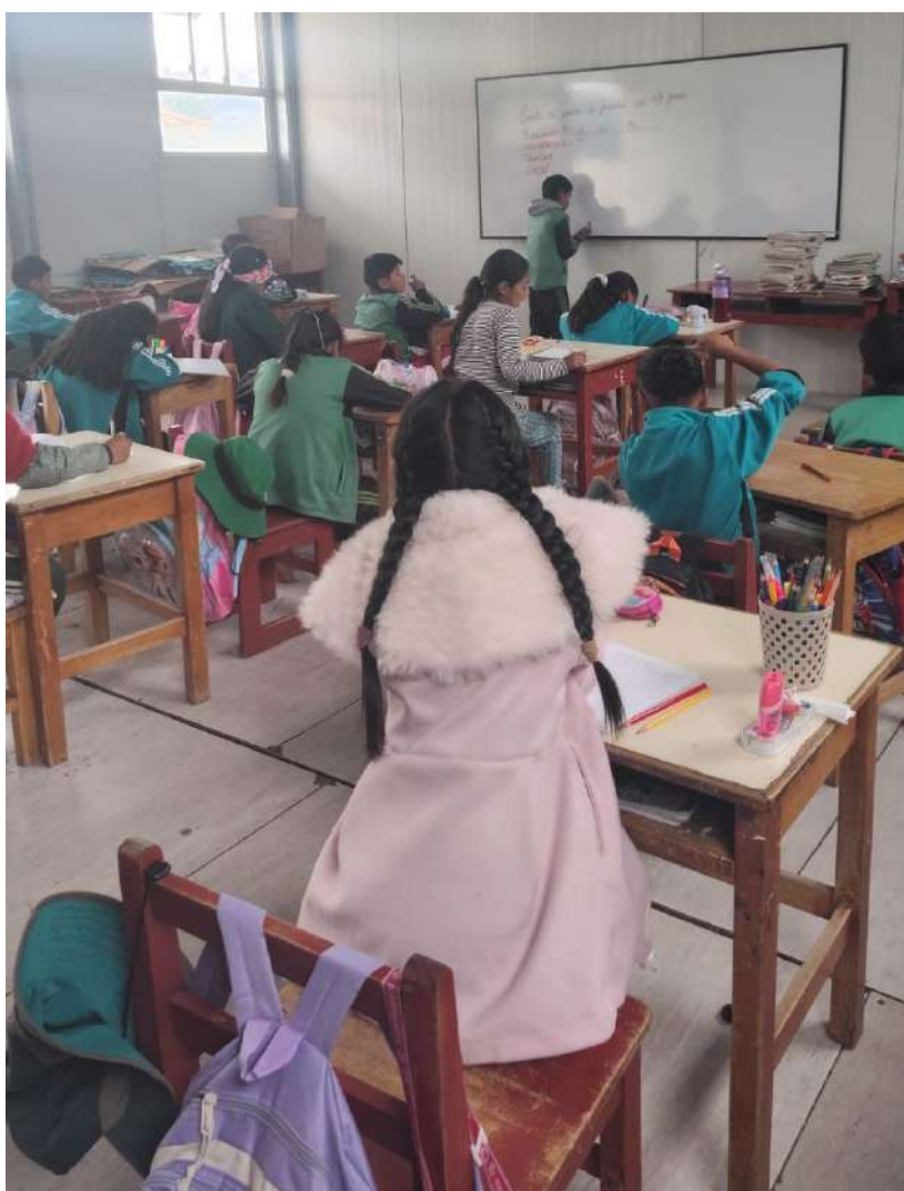
Diagnóstico de lectoescritura en escuelas