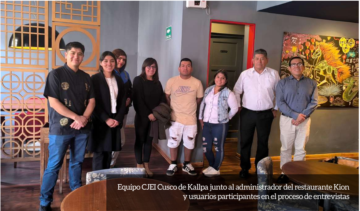
Equipo CJEI Cusco de Kallpa junto al administrador del restaurante Kion y usuarios participantes en el proceso de entrevistas