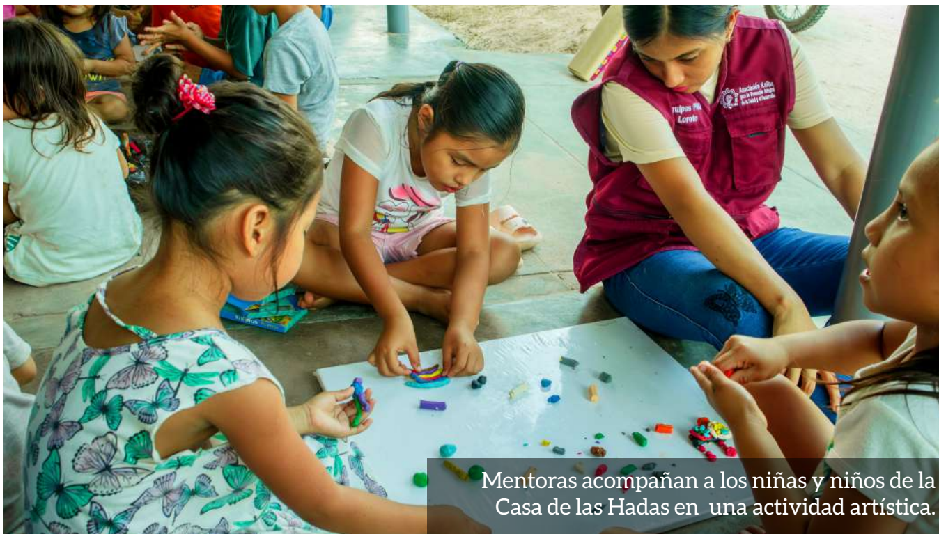
Mentoras acompañan a los niñas y niños de la Casa de las Hadas en una actividad artística.