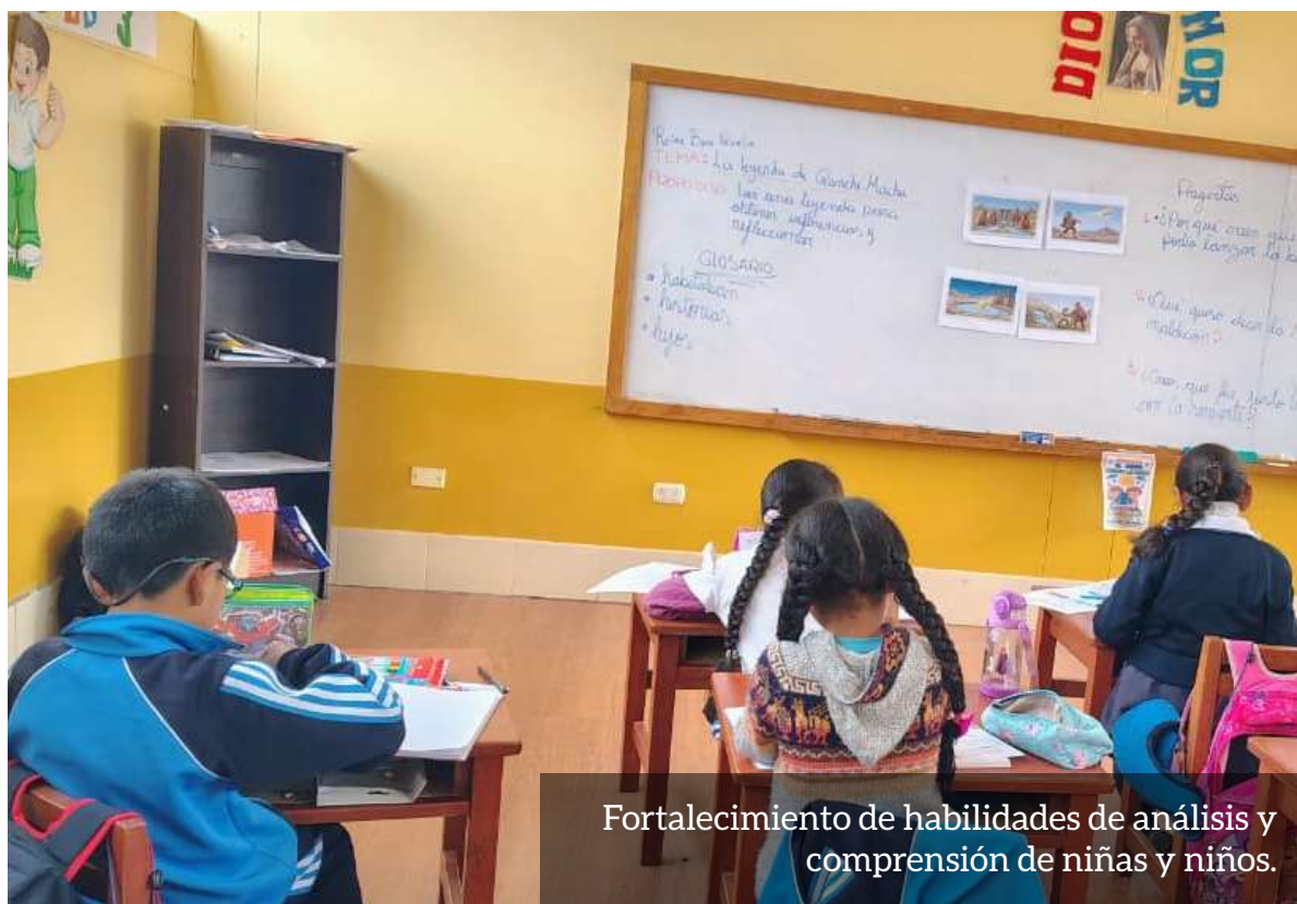
Fortalecimiento de habilidades de análisis y comprensión de niñas y niños.