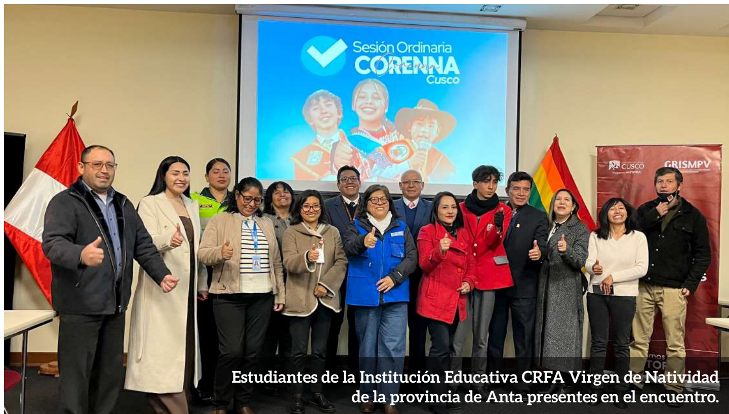
Estudiantes de la Institución Educativa CRFA Virgen de Natividad de la provincia de Anta presentes en el encuentro.