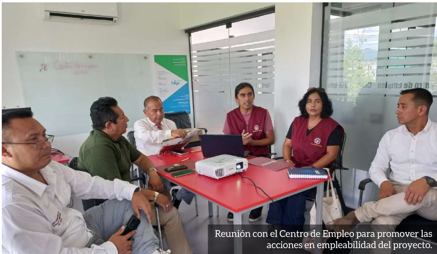
Reunión con el Centro de Empleo para promover las acciones en empleabilidad del proyecto.