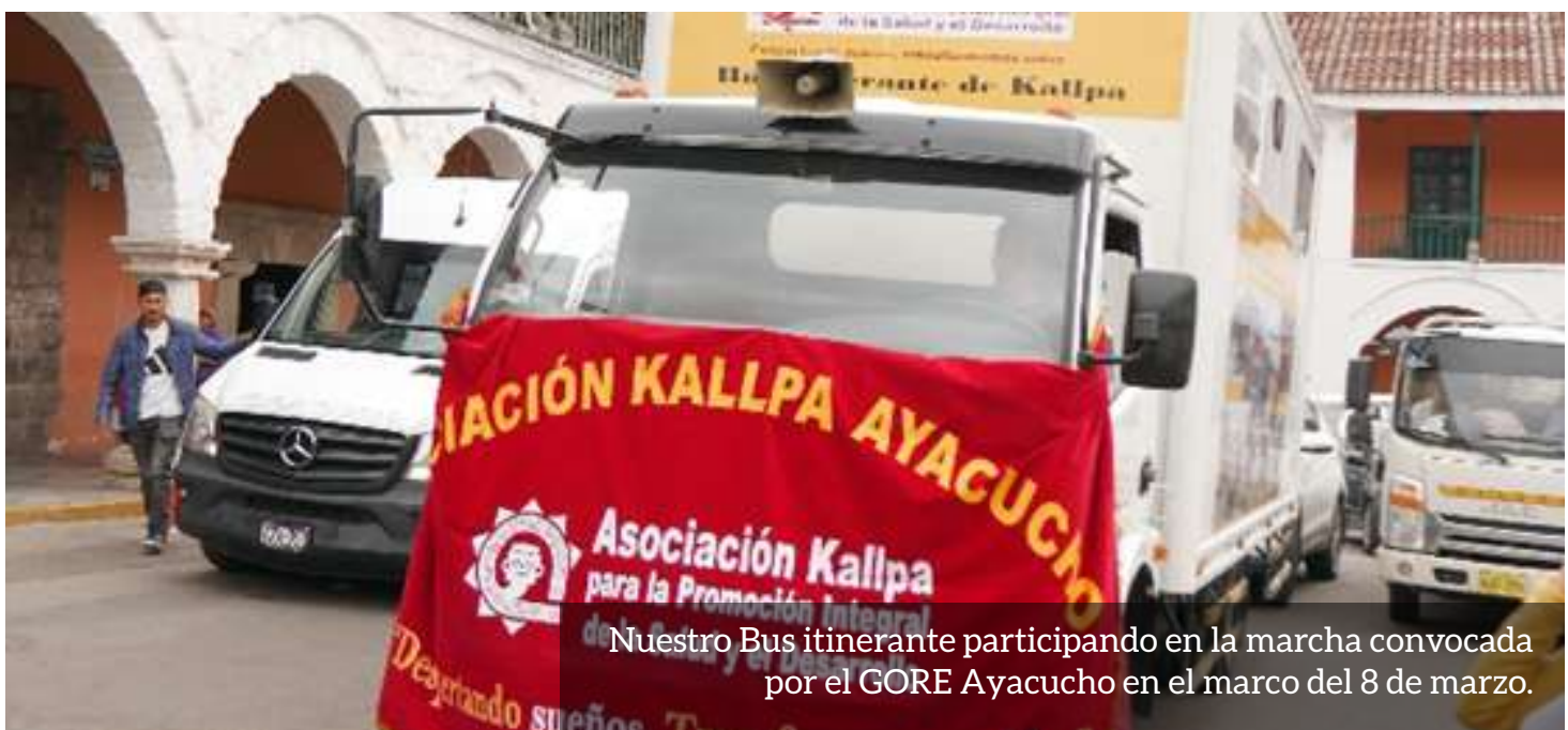
Nuestro Bus itinerante participando en la marcha convocada por el GORE Ayacucho en el marco del 8 de marzo.