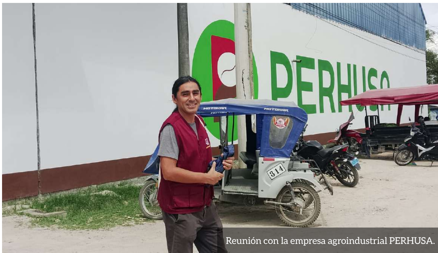
Reunión con la empresa agroindustrial PERHUSA.