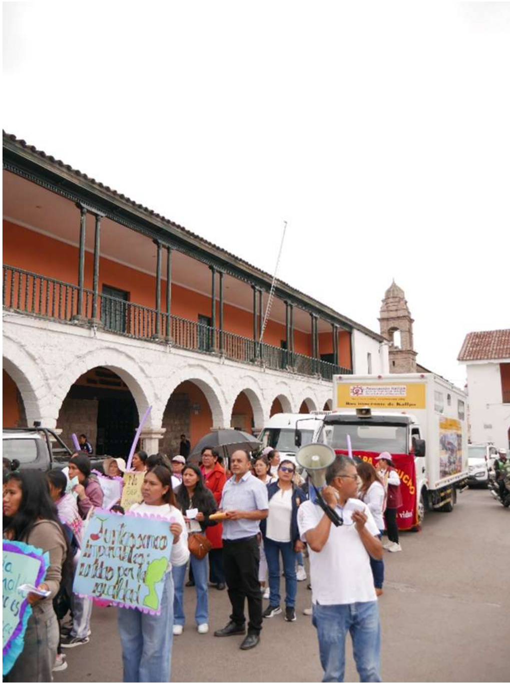
Marcha convocada por el Gobierno Regional de Ayacucho en el marco del 8 de marzo, Día Internacional de la Mujer.