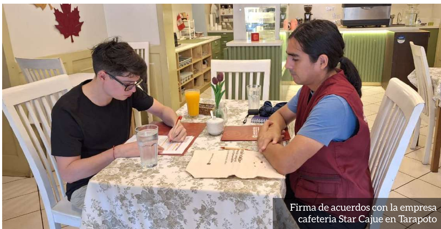
Firma de acuerdos con la empresa cafetería Star Cajue en Tarapoto

Este proceso significó un gran reto, pero nos permitió avanzar en la implementación del proyecto y a reafirmar aquello que nos mueve como organización: despertar los sueños de cada joven que decide transformar su vida. El objetivo es que cada joven pueda acceder a oportunidades dignas en sus propias comunidades, sin verse obligados a migrar y pudiendo aportar al desarrollo económico de sus territorios. Cada logro que vamos adquiriendo es una evidencia concreta del compromiso asumido por seguir construyendo oportunidades reales, inclusivas y sostenibles.