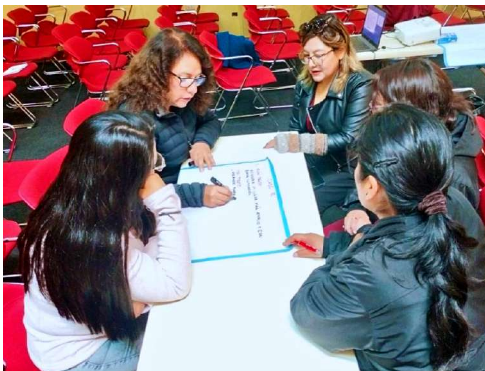
Funcionarios de la Municipalidad de Cusco, analizando y escribiendo sobre los ajustes razonables para personas con discapacidad.