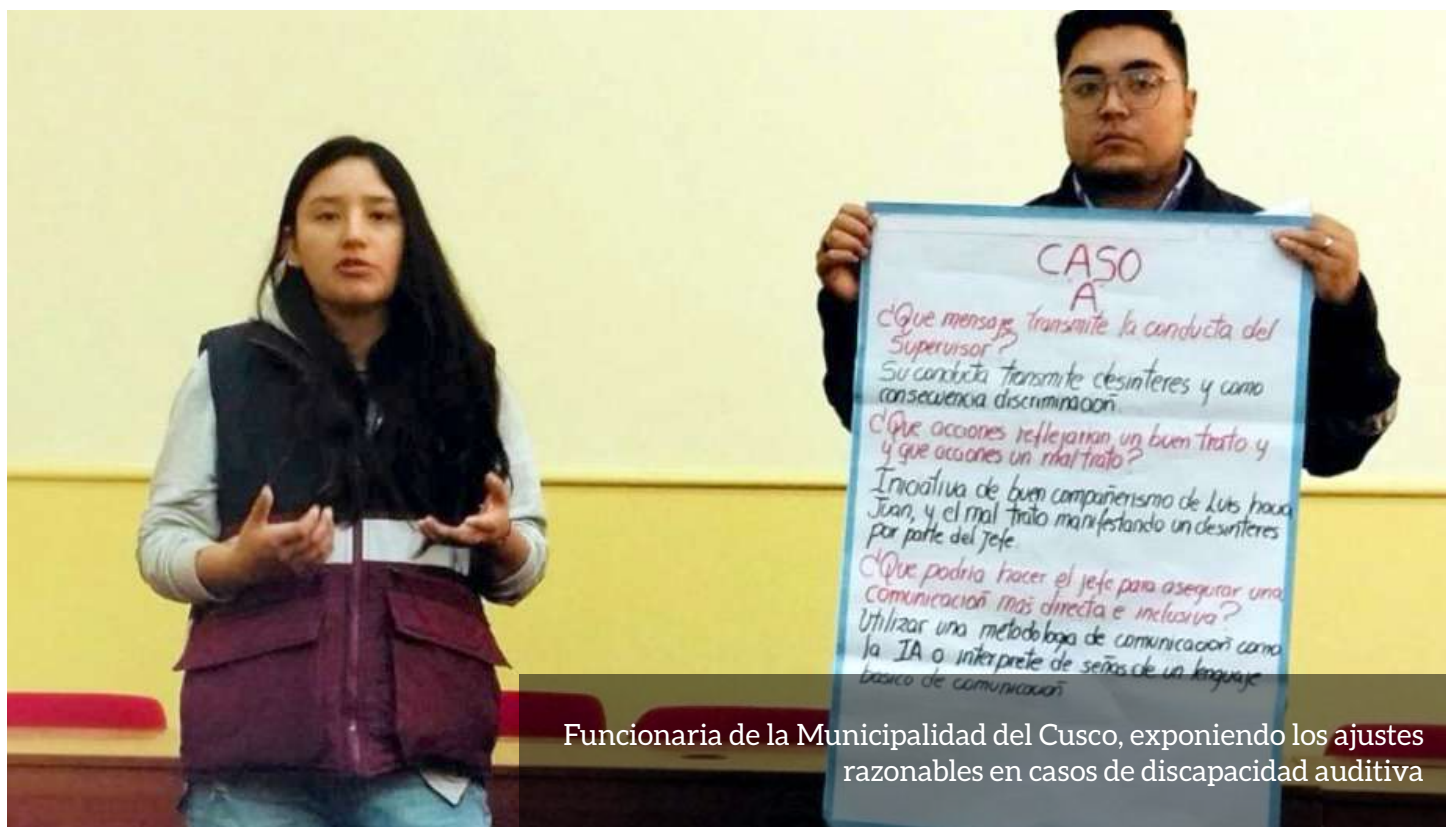
Funcionaria de la Municipalidad del Cusco, exponiendo los ajustes razonables en casos de discapacidad auditiva

Desde la Asociación Kallpa promovimos los espacios de participación, análisis y compromiso, reafirmando la importancia