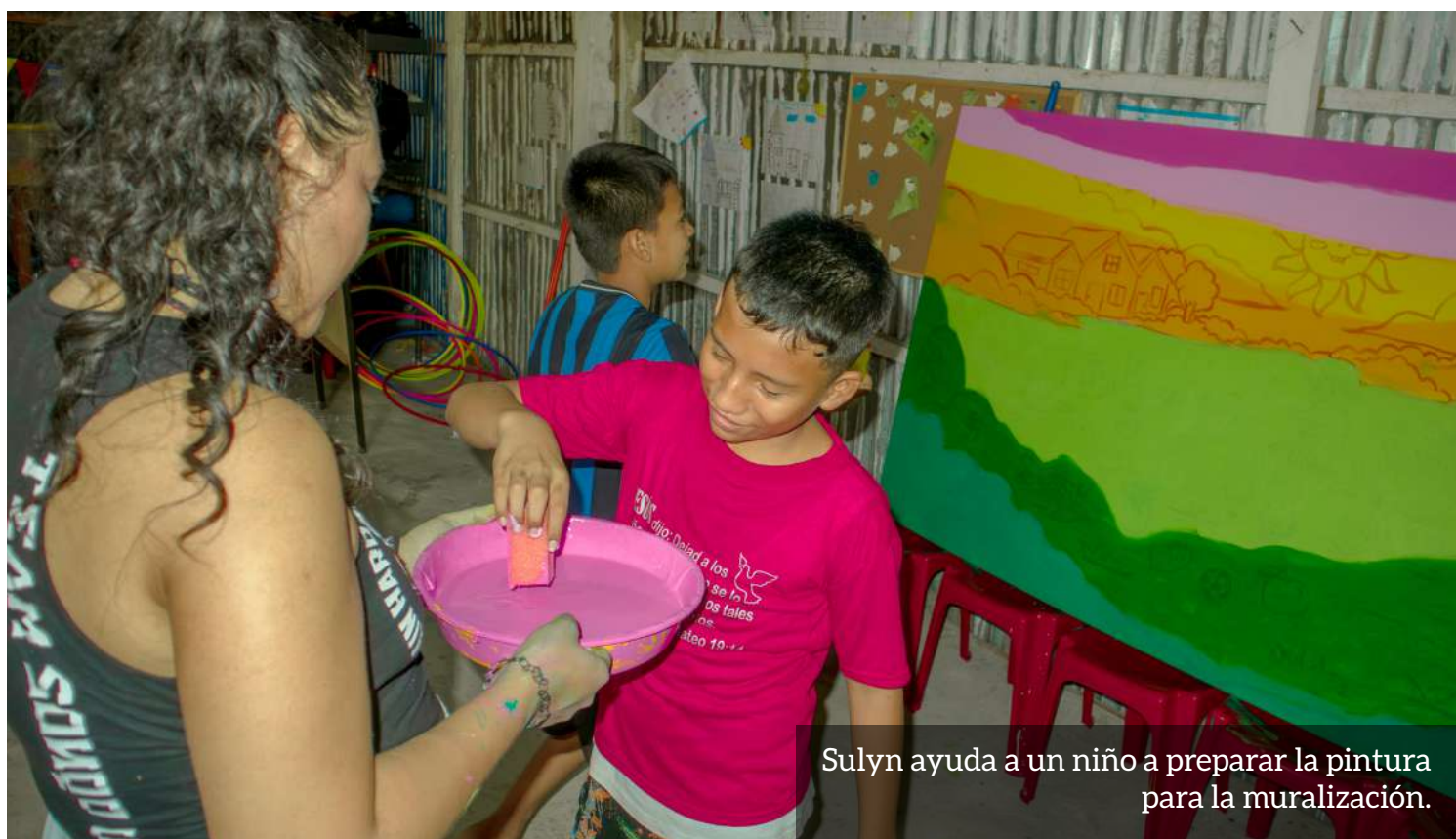
Sulyn ayuda a un niño a preparar la pintura para la muralización.