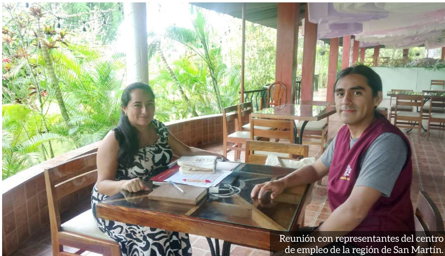
Reunión con representantes del centro de empleo de la región de San Martín.