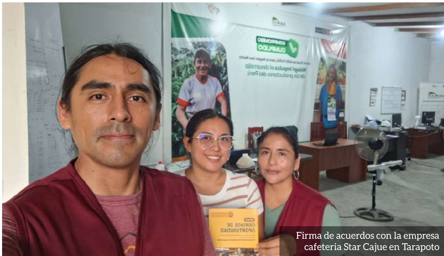
Firma de acuerdos con la empresa cafetería Star Cajue en Tarapoto