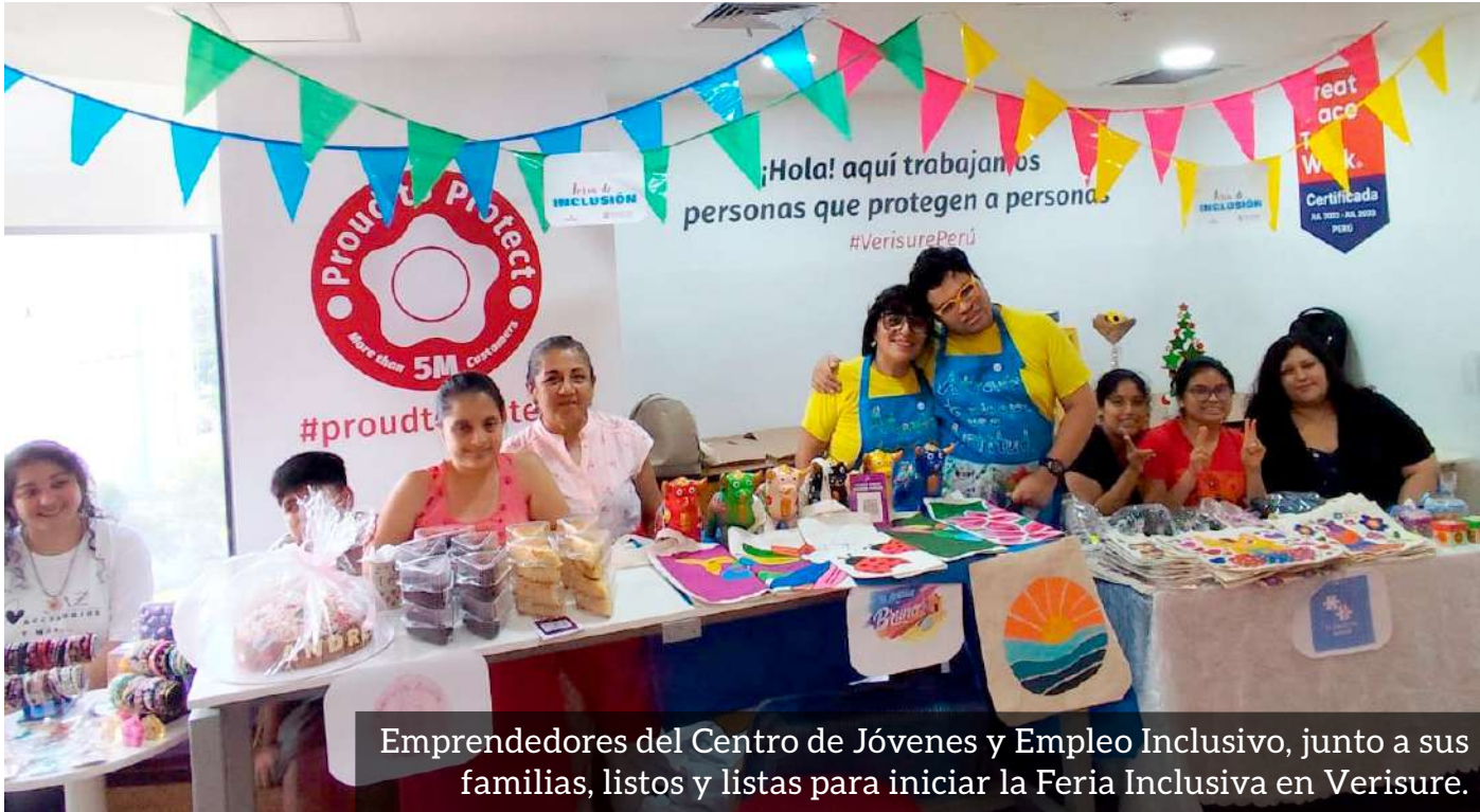
Emprendedores del Centro de Jóvenes y Empleo Inclusivo, junto a sus familias, listos y listas para iniciar la Feria Inclusiva en Verisure.