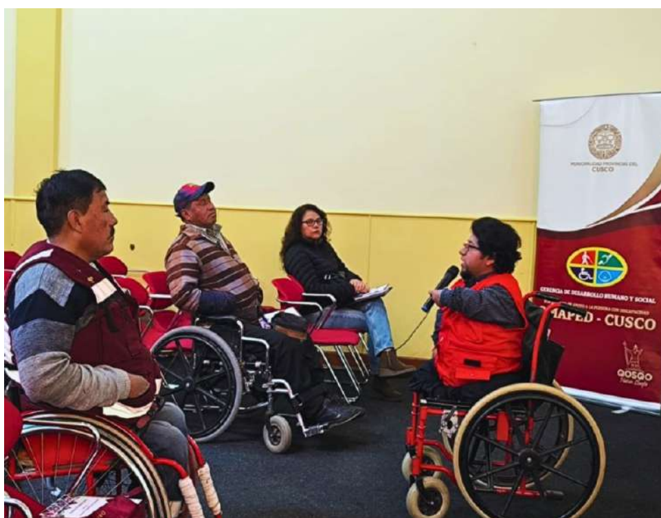
CONADIS facilitando el tema de la ley 29973 Ley General de la Persona con Discapacidad.