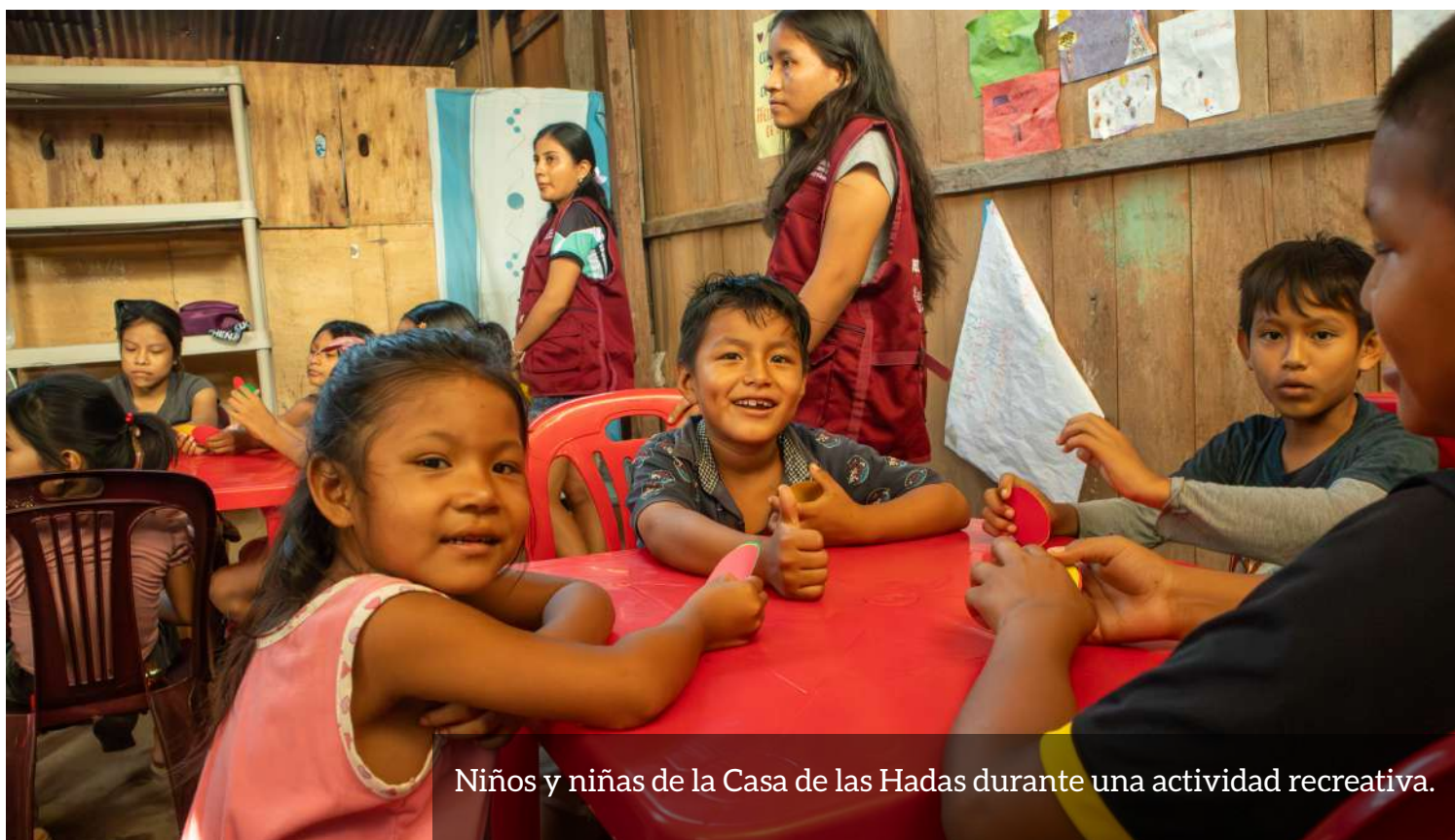
Niños y niñas de la Casa de las Hadas durante una actividad recreativa.