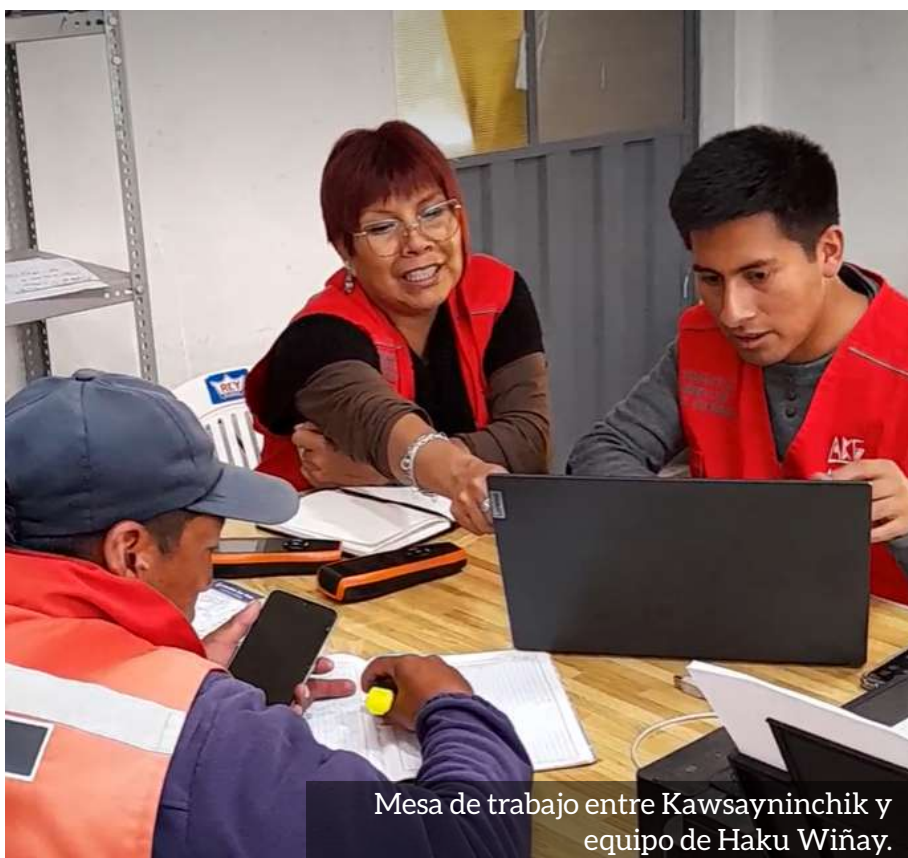
Mesa de trabajo entre Kawsayninchik y equipo de Haku Wiñay.

Estos avances representan pasos importantes en la mejora de la calidad de vida de las personas con las que trabajamos. Sabemos que el camino no es fácil, pero nos alienta ver desde ya los primeros efectos tangibles en la vida cotidiana de las comunidades: desde la conciencia sobre la exposición al humo en las viviendas hasta el fortalecimiento de las capacidades de gestión del agua, pasando por la mejora de la enseñanza y la dieta escolar. Más allá de los logros inmediatos, estas iniciativas sientan las bases para que las familias puedan proyectar un futuro más saludable, equitativo y lleno de oportunidades para sus niñas y niños.