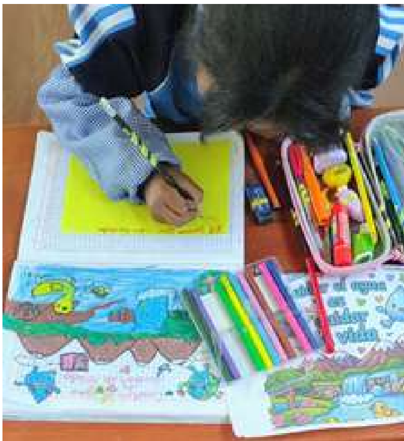
Aprendiendo de forma lúdica en las escuelas.